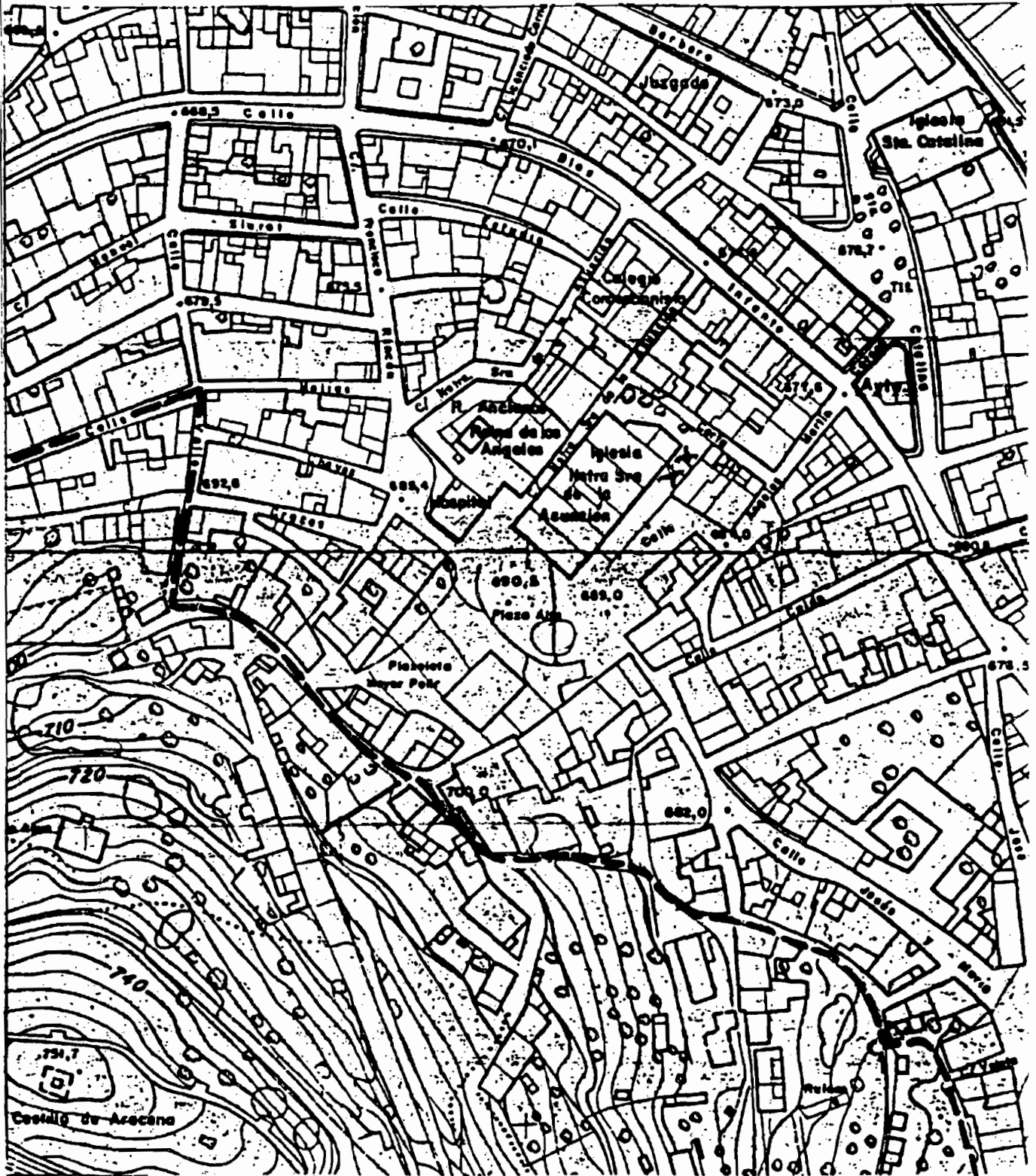
HOJA 2 de 4. CASTILLO DE ARACENA. ARACENA — HUELVA. ESCALA 1:2.000