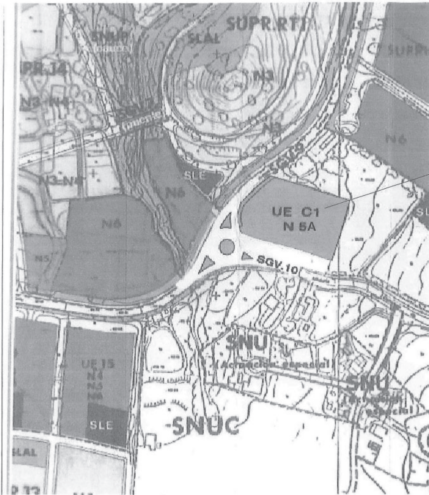
CALIFICACIÓN Y GESTIÓN