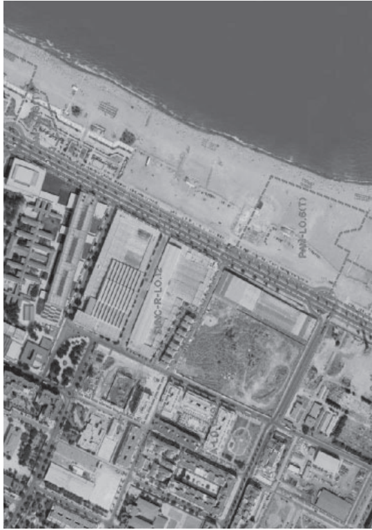
Identificación y Localización