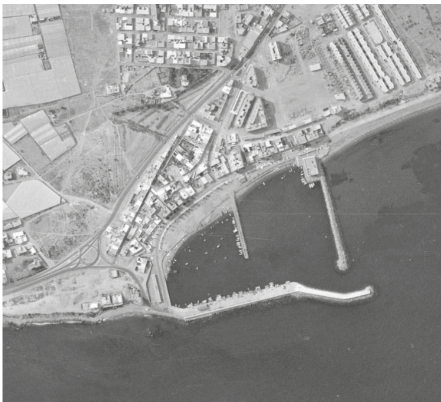
Puerto de Roquetas de Mar (1984)

El objeto del Plan de Usos es establecer la ordenación funcional del puerto de Roquetas de Mar (Almería), de acuerdo con el artículo 9 de la Ley 21/2007, de 18 de diciembre, de Régimen Jurídico y Económico de los Puertos de Andalucía.