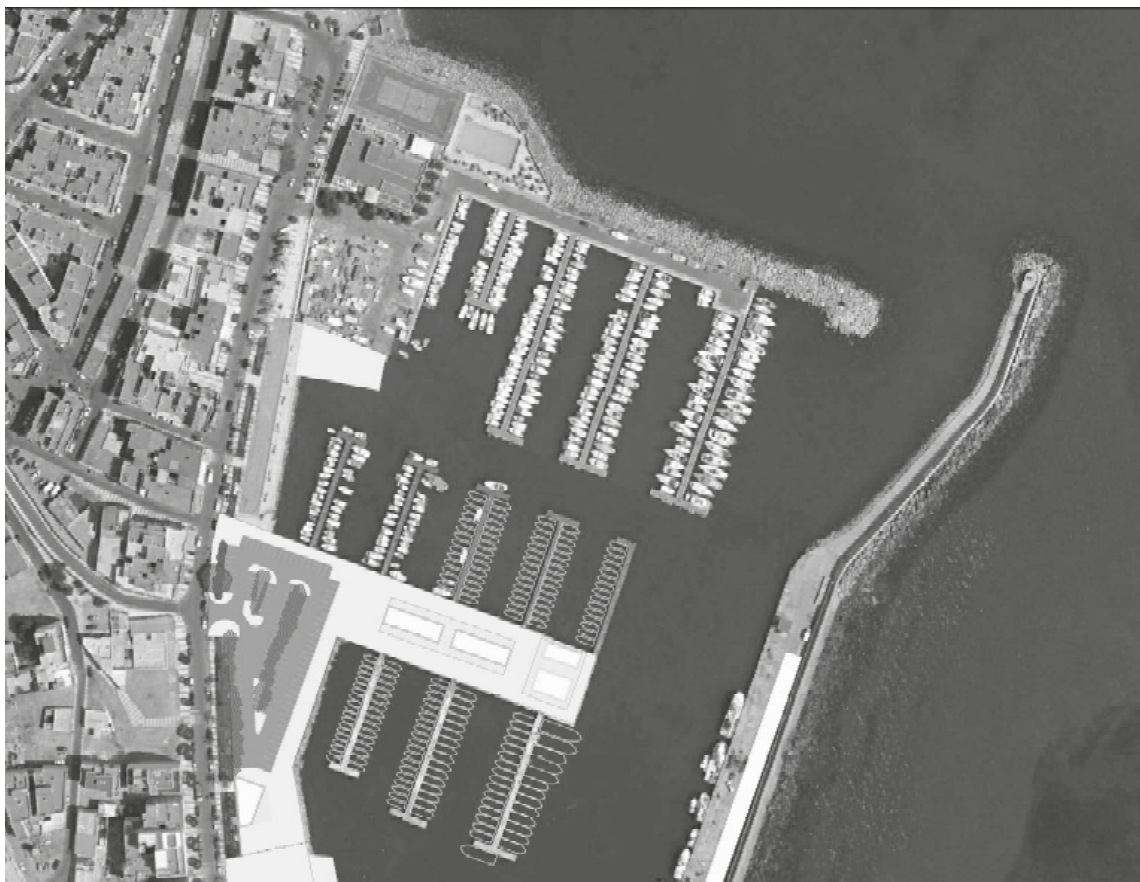
Prolongación de pantalanes. [Propuesta de imagen final]

- Prolongación de pantalanes en el extremo norte de la dársena exterior hasta agotar la capacidad de la lámina de agua destinada a la actividad náutico-recreativa, generando en torno a 30 puestos de atraque adicionales que permitan situar la oferta global del puerto próxima a las 460 embarcaciones.