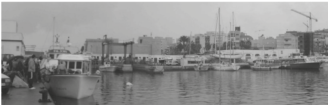
Frente del varadero desde el muelle pesquero