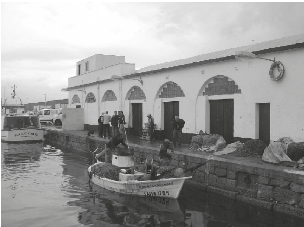
Muelle pesquero y lonja