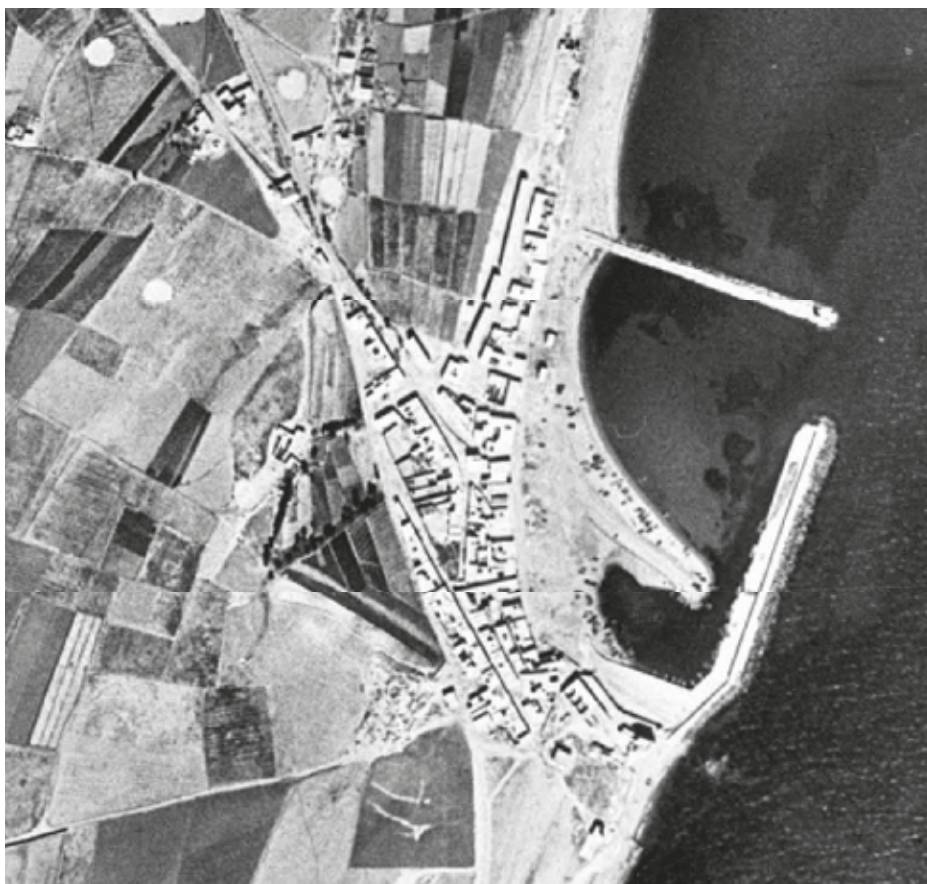
Puerto de Roquetas de Mar (1956)

El recinto portuario se ha ido configurando a partir del dique inicial de levante construido a principios del siglo XX para el refugio de la flota pesquera. Los importantes aterramientos experimentados en la década de los cuarenta obligaron a la construcción del dique norte a finales de los años 50 para la contención de arenas, completándose el abrigo con la prolongación del dique de levante a principios de los años ochenta.