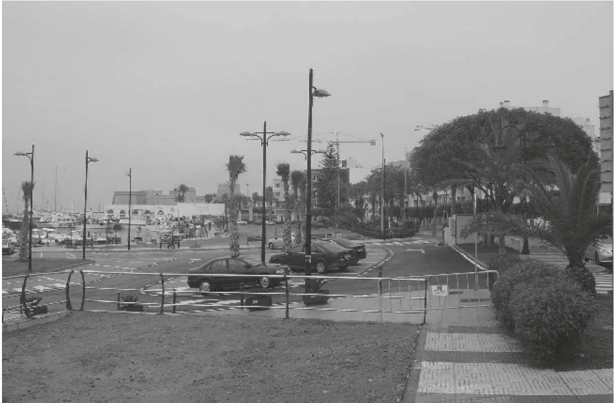
Zona de ribera de poniente

- Reurbanización de la zona de ribera de poniente para propiciar la adecuada conexión entre la trama urbana y los espacios portuarios asociados a la práctica náutico-recreativa y las actividades de carácter complementario, resolviendo la accesibilidad viaria, aparcamiento y permeabilidad puerto-ciudad.