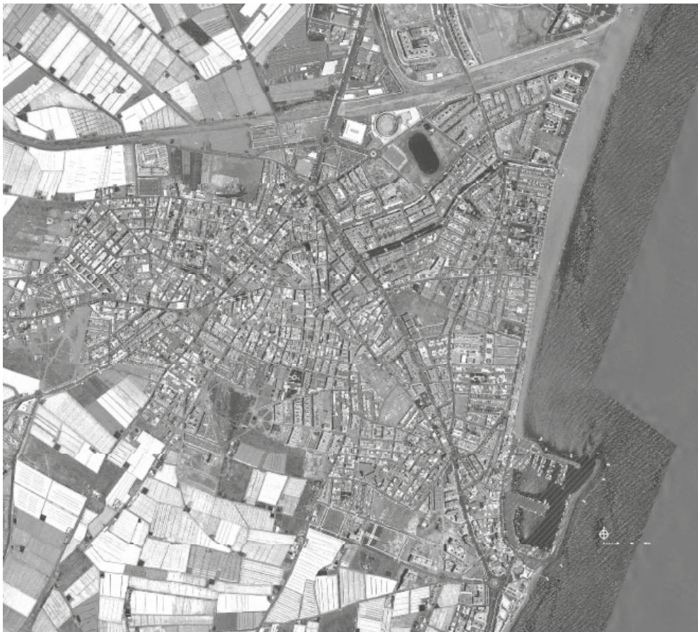
Núcleo urbano de Roquetas de Mar

Es de destacar el notable incremento de servicios y equipamientos experimentado en el área urbana próxima al puerto, donde han sido puestos en servicios recientemente nuevas zonas de ocio y espacios comerciales como el teatro auditorio y un nuevo centro comercial. Al sur del puerto, el Castillo de Santa Ana, recientemente rehabilitado, constituye la conexión entre el Paseo Marítimo y el espacio portuario.