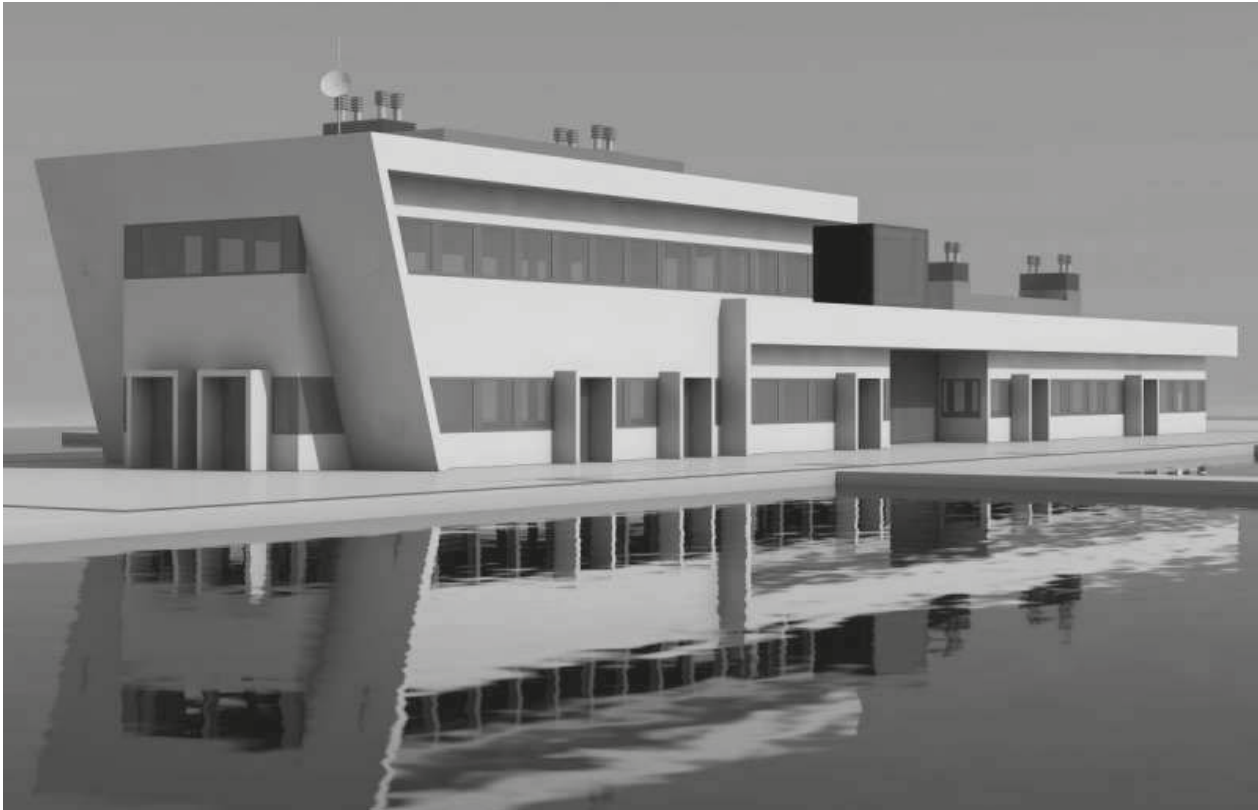
Nuevo edificio de servicios. [Infografía proyecto en redacción]

- Construcción de nuevos edificios de servicios para la función náutico-recreativa y actividades complementarias asociadas en el pantalán central y la zona de ribera de poniente.