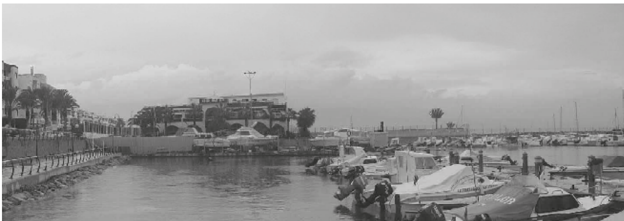
Vista de la dársena deportiva norte con el Club Náutico al fondo

En cuanto a la actividad deportiva, actualmente se desarrolla en las instalaciones gestionadas mediante concesión por el Club Náutico de Roquetas de Mar, que dispone de 183 puestos de atraque desde el año 1990, así como con los 237 puestos de atraque gestionados directamente por la Agencia Pública de Puertos de Andalucía y puestos en servicio en el año 2008.