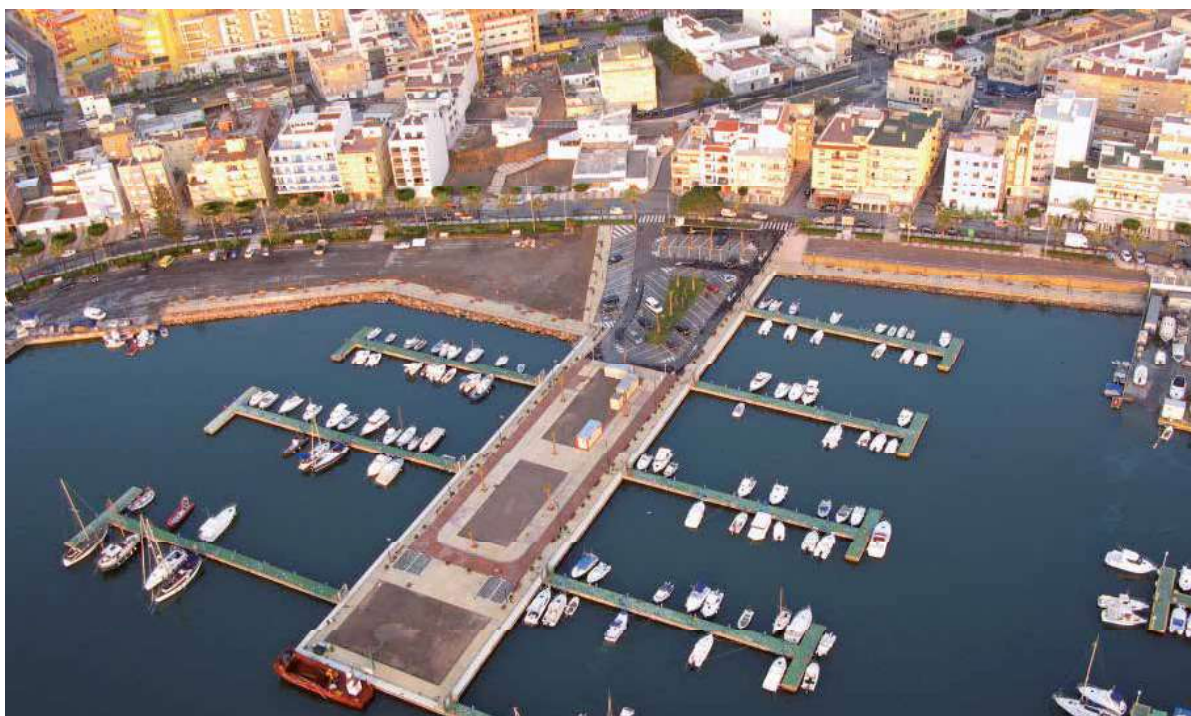
Pantalanes gestionados por la AgPPA

La estancia de embarcaciones en régimen de tránsito en el puerto de Roquetas resulta muy reducida como consecuencia tanto de la proximidad del Puerto Deportivo de Aguadulce como de la gran demanda de puestos de atraque de base, así como las limitaciones de calado.