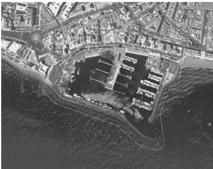
Zona de servicio del Puerto de Roquetas de Mar

Faro.- Situado a unos 150 m hacia el sudoeste del recinto portuario, constituye un edificio restaurado y remodelado por la autoridad portuaria, una vez desmantelado y fuera de servicio el faro, y destinado a uso lúdico-cultural en virtud del convenio suscrito con el Ayuntamiento de Roquetas de Mar en mayo de 1999.