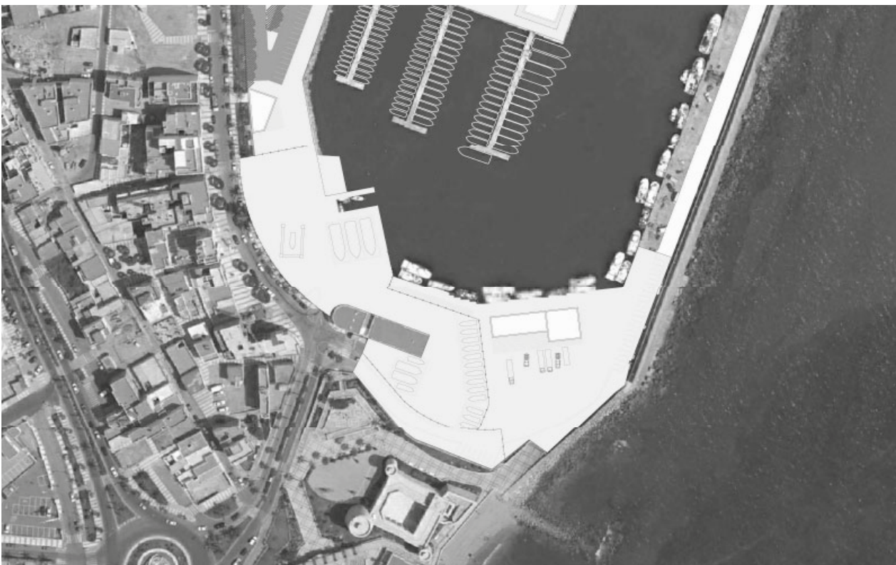
Área técnica y profesional. [Propuesta de imagen final]

- Reurbanización de la zona de ribera sudoeste para albergar un área técnica de mayor superficie y con mejores condiciones operativas, complementando las funciones de carácter profesional que se concentran en el extremo sureste de la dársena interior.