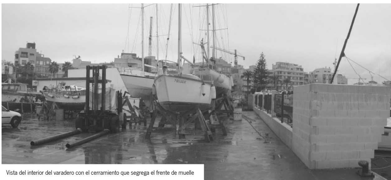
Vista del interior del varadero con el cerramiento que segrega el frente de muelle