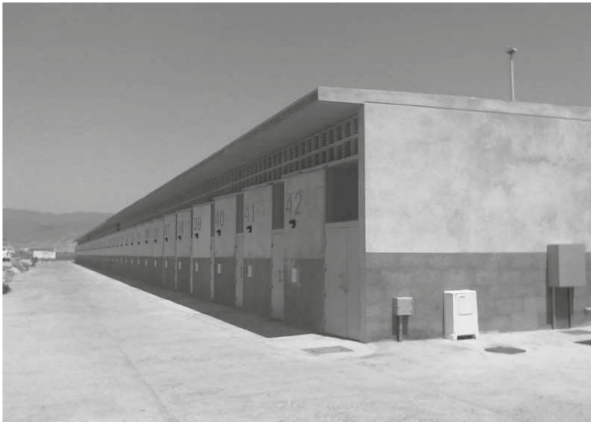
Nuevos cuartos de armadores

Por la tipología de su flota, el puerto de Roquetas no se ve afectado por paradas biológicas, salvo en el caso de las embarcaciones de cerco, pero su actividad se ha visto fuertemente afectada por la desaparición de las capturas de atún desde 2001 y la presencia de algas en ciertas épocas del año que hacen migrar los bancos de peces con la consiguiente reducción de las capturas.