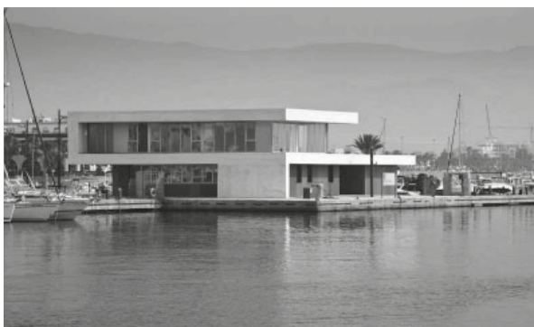
Vistas del edificio administrativo y de servicios de reciente construcción

Se ha finalizado recientemente la ejecución de edificio administrativo y de servicios en el pantalán central, y está prevista la construcción de edificios de actividades complementarias a la actividad náutico-recreativa tanto en la ribera como en el pantalán central.