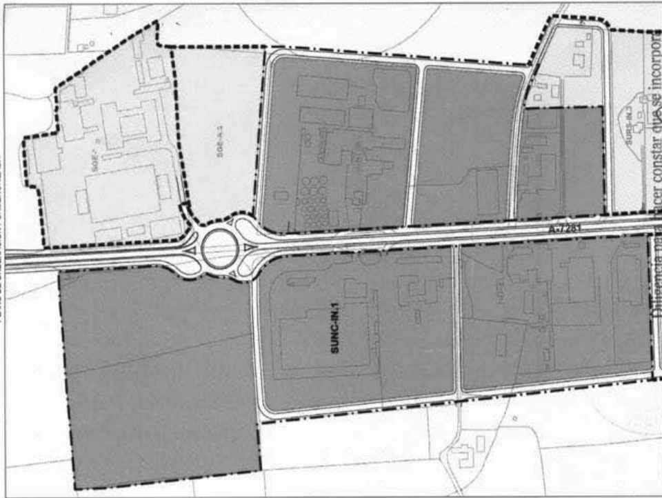
PLANO DE ORDENACIÓN PORMENORIZADA

La diligencia para hacer constar que se incorpora el condicionante acordado por la CPOTU de 13 JUN. 2013