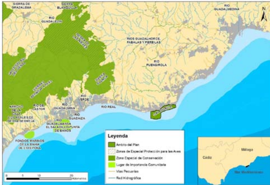
Figura 3. Conectividad