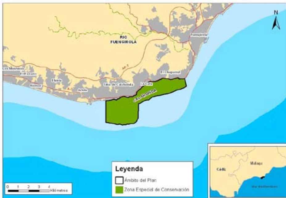
Figura 1. Localización de la ZEC Calahonda

Es un espacio marítimo terrestre, situado sobre la plataforma continental, que incluye una pequeña franja terrestre situada por encima de la línea de costa constituida por playas arenosas y por afloramientos rocosos. La batimetría máxima del espacio se sitúa sobre los 30 metros.