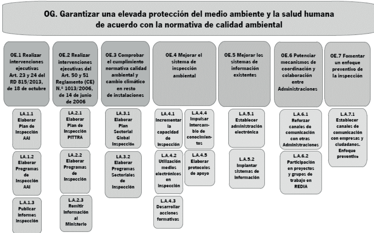
Figura 1. Árbol de objetivos Plan PIDIA 2020-2025

Estas líneas de actuación se desarrollan por medio de actuaciones concretas, medidas e instrumentos en este Programa Integral, de acuerdo con los recursos y medios disponibles.