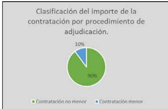
Gráfico nº 1

En el gráfico nº 1 se refleja la distribución del importe de la actividad contractual clasificada en función del procedimiento de adjudicación: