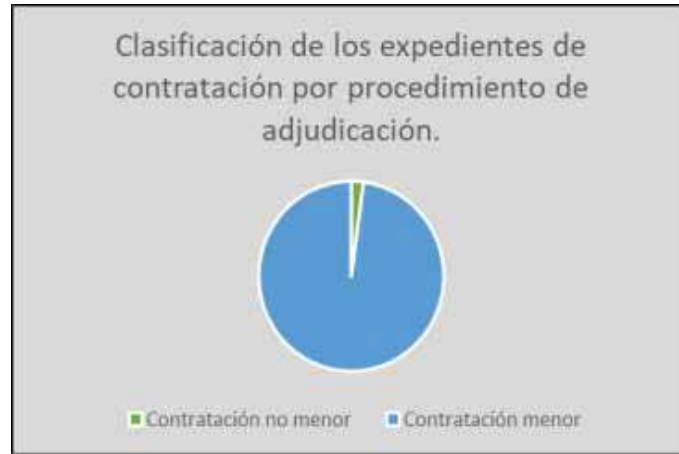
Gráfico nº 3