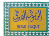
Ejemplos de la señalización de calles y monumentos