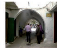
7. Señalización de calles