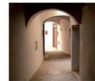
2. Adarve Tnana