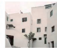
5. Plaza del Pan