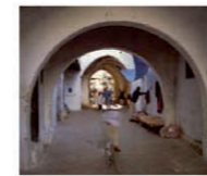
6. Plaza del Pan