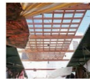
4. Gran Plaza