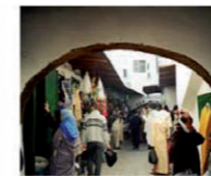
3. Calle M'kadem