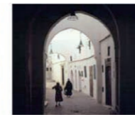
2. Adarve Zauia Tijania