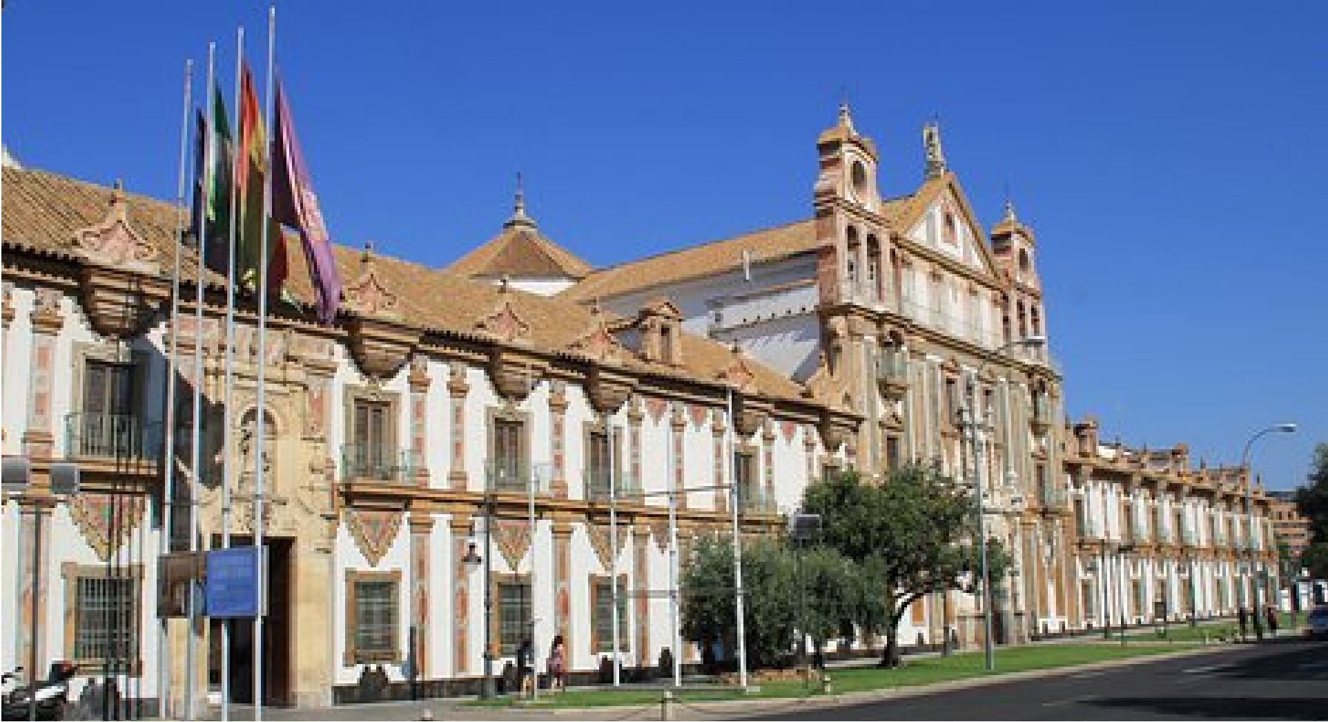
Fachada del Palacio de la Merced, sede de la Diputación Provincial de Córdoba.

Para el refrendo de este definitivo texto, la Asamblea de Parlamentarios se reúne en el Palacio de la Merced de Córdoba el 28 de febrero. Tanto la elección de la fecha como la del lugar tenían evidentes significaciones simbólicas: el 28 de febrero fue la fecha del referéndum que quedaría como oficial de celebración de nuestra Autonomía, y en la ciudad de Córdoba se había aprobado en 1933 el Anteproyecto de Bases para el Estatuto de Autonomía . Durante los dos días de sesiones, como se refleja en nuestro “Documento del mes”, se introdujeron modificaciones al texto de Carmona.