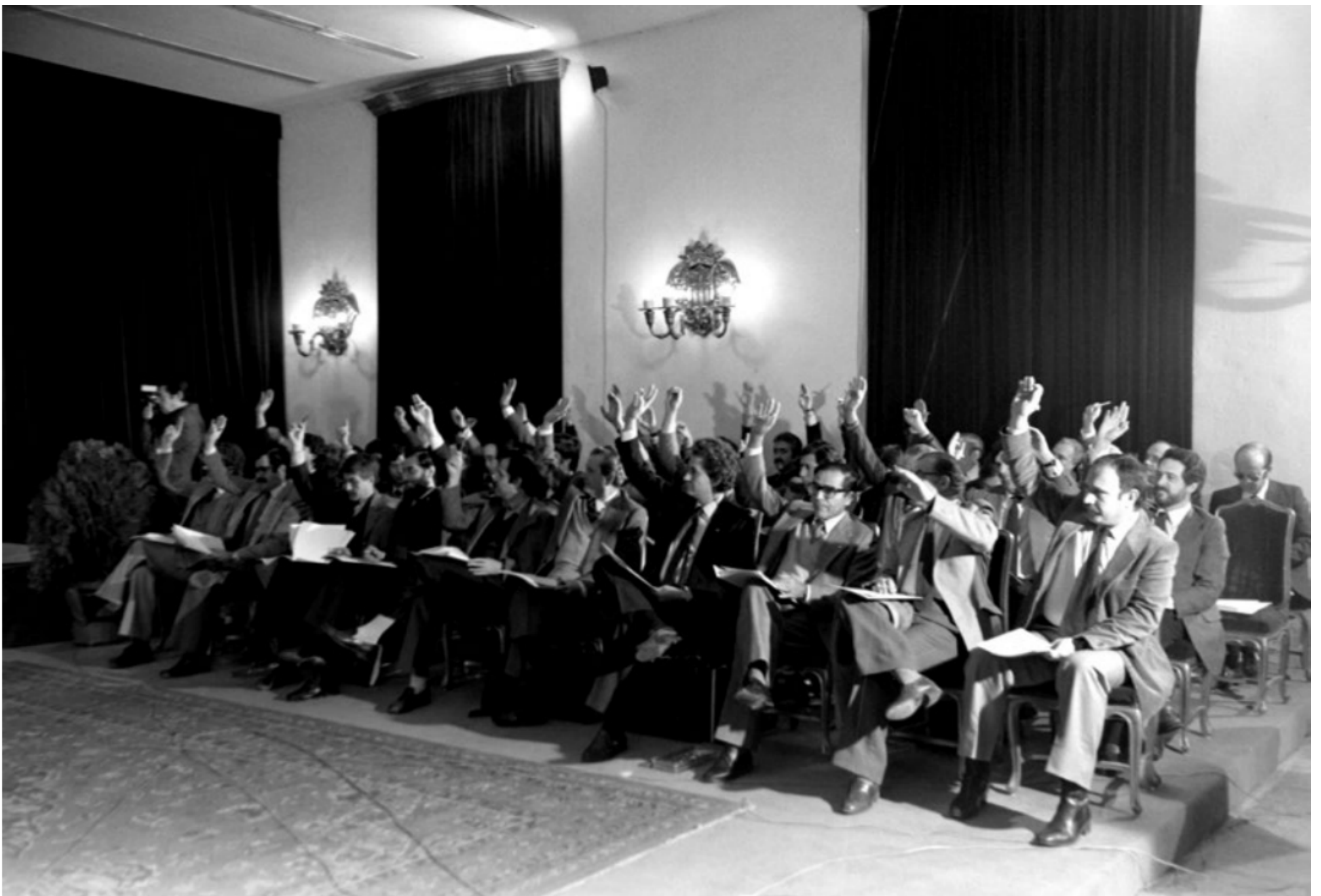
Asamblea de Parlamentarios reunidos en el salón de actos del Palacio de la Merced de Córdoba en 1981 para aprobar el proyecto de Estatuto de Autonomía.

Para el refrendo de este definitivo texto, la Asamblea de Parlamentarios se reúne en el Palacio de la Merced de Córdoba el 28 de febrero. Tanto la elección de la fecha como la del lugar tenían evidentes significaciones simbólicas: el 28 de febrero fue la fecha del referéndum que quedaría como oficial de celebración de nuestra Autonomía, y en la ciudad de Córdoba se había aprobado en 1933 el Anteproyecto de Bases para el Estatuto de Autonomía . Durante los dos días de sesiones, como se refleja en nuestro “Documento del mes”, se introdujeron modificaciones al texto de Carmona.