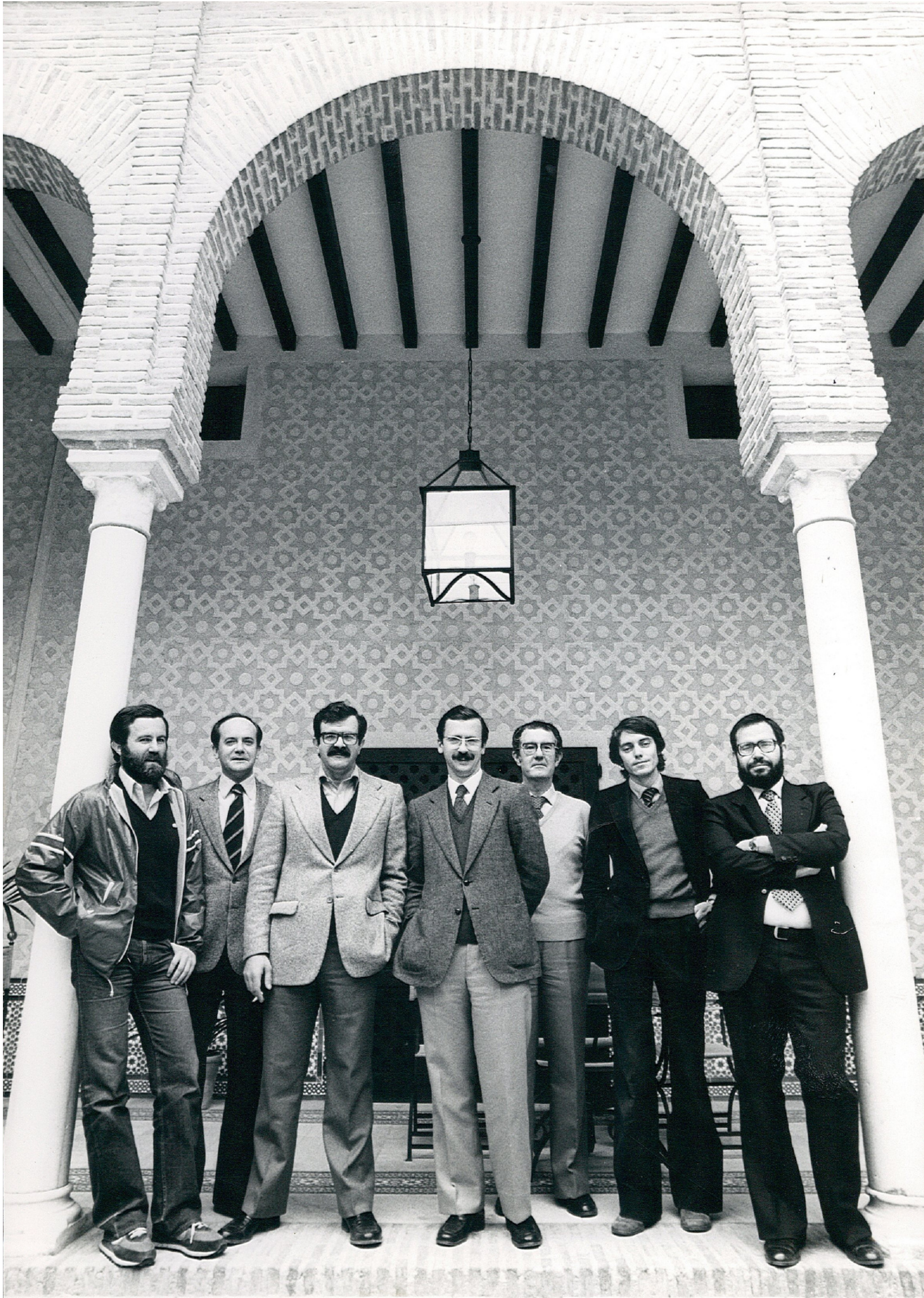
Los denominados "Padres del Estatuto" reunidos en el Parador de Carmona, 12.02.1980.