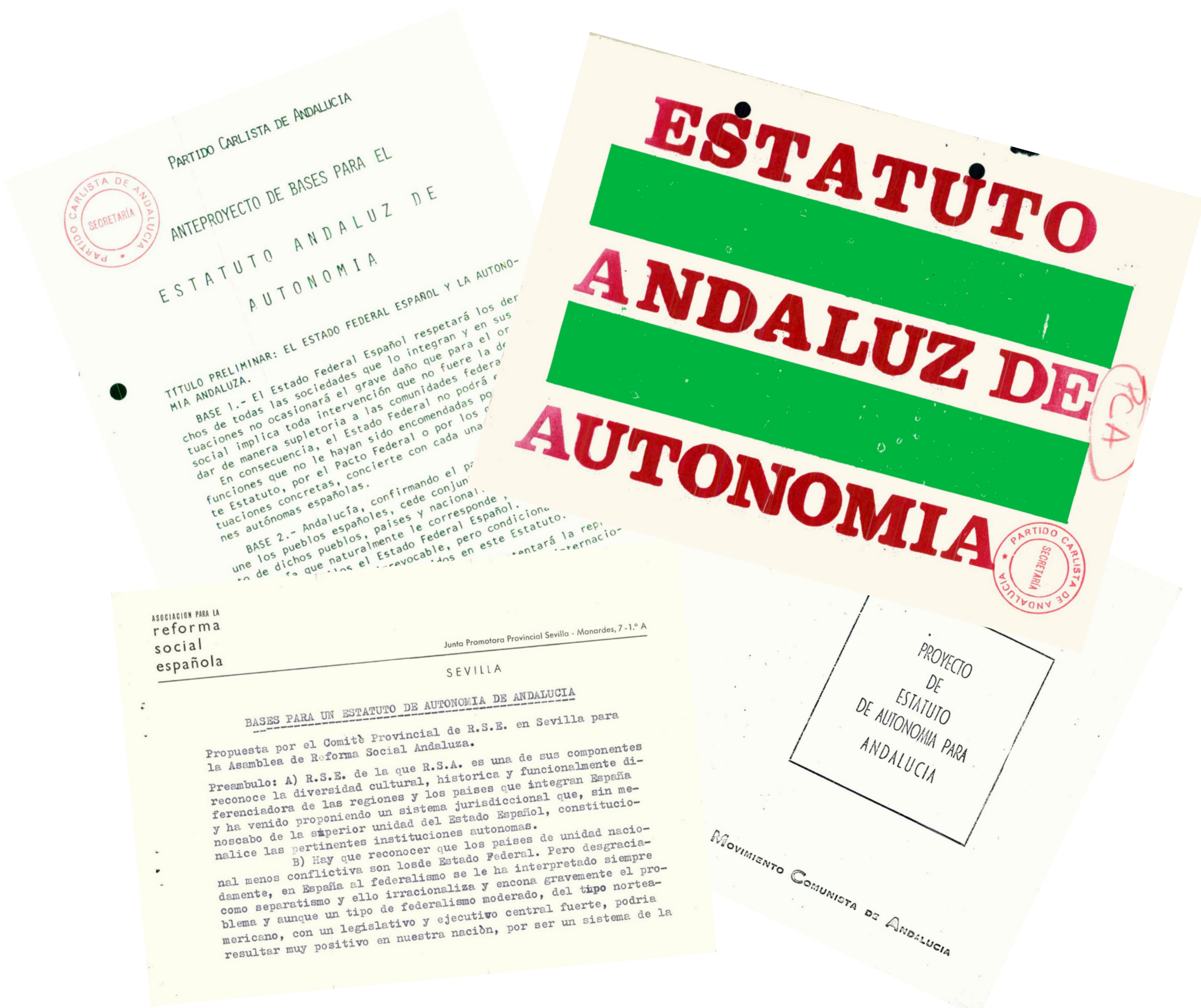
Diversos proyectos de estatuto de autonomía elaborados por distintas fuerzas políticas.

Los trabajos de la Ponencia no parten de cero: la secretaría general de la Junta de Andalucía les proporciona anteproyectos elaborados por diversas fuerzas políticas, tanto las principales que obtuvieron representación parlamentaria como otras minoritarias y extraparlamentarias, (Partido Comunista de España, Movimiento Comunista de Andalucía, Alianza Socialista de Andalucía, Partido de los Trabajadores de Andalucía, Partido Socialista Obrero Español, Partido del Trabajo de España, Reforma Social Española y el Partido Carlista de Andalucía). También se incluyeron entre este material de trabajo el proyecto de estatuto elaborado por un diputado a Cortes cuyo nombre no se recoge en el documento, así como el Proyecto de Estatuto aprobado por las Diputaciones Provinciales Andaluzas el 26 de febrero de 1932, según lo dispuesto en el artículo 12 la Constitución republicana de 1931, para someterlo a las deliberaciones de la Asamblea Regional a celebrar en Córdoba en marzo de ese año, aunque finalmente se celebraría en enero de 1933, en el magnífico salón de Actos del Círculo de la Amistad cordobés.