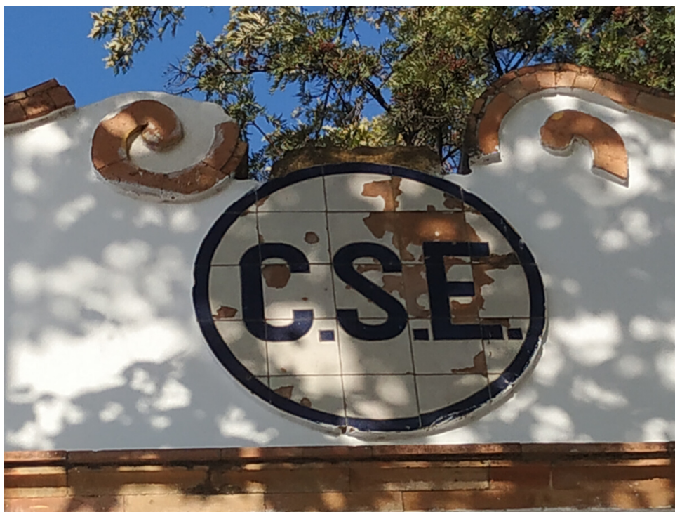
Logotipo sobre azulejos de la Compañía Sevillana de Electricidad en la calle