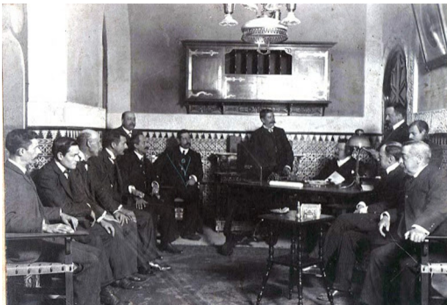
Sesión del Consejo de Administración de la Compañía Sevillana de Electricidad, circa 1910.

La Compañía Sevillana de Electricidad (C.S.E.) fue una de las primeras, fundada en 1894 con capital alemán (A.E.G y el Deustch Bank) y, con el transcurso del tiempo, dominaría el mercado de la electricidad en el sur peninsular.