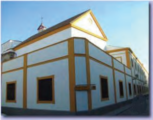
Antiguo convento de Santiago de la Espada, de Sevilla

Difundir y dar a conocer al gran público el rico Patrimonio Documental custodiado en el Archivo General de Andalucía es el objetivo marcado con el ciclo "El Documento del mes". Por ello, seleccionamos mensualmente de entre nuestros fondos una pieza destacada por su relevancia histórica y cultural, para sacarla a la luz y difundirla de manera comentada, intentando hacerla accesible a todos los ciudadanos.