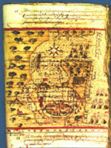
1586. Ataque de Francis Drake a Cartagena de Indias.

Así se define Miguel de Cervantes en el Memorial de 21 de mayo de 1590, solicitando a Felipe II uno de los cargos vacantes en Indias. Sevilla era el centro de operaciones administrativas y económicas con América, competencia de La Casa de la Contratación y el Consulado de Cargadores a Indias, que controlaban todo el tráfico de hombres, mercancías y divisas entre España y el Nuevo Mundo. La solicitud no fue aceptada, a pesar de los méritos alegados: su participación en Lepanto, donde le dieron muchas heridas, de las cuales perdió una mano de un arcabuzazo, o su cautiverio en Argel.