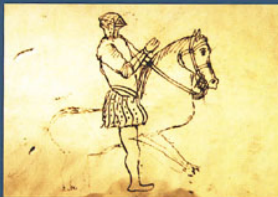
1600. Boceto de jinete con armadura.

Con motivo de la conmemoración del IV Centenario de la publicación de El Quijote , la Consejería de Cultura y el Archivo Histórico Provincial de Sevilla han querido rendir un homenaje a su autor, Miguel de Cervantes, y poner de manifiesto su estrecha relación con la ciudad de Sevilla.