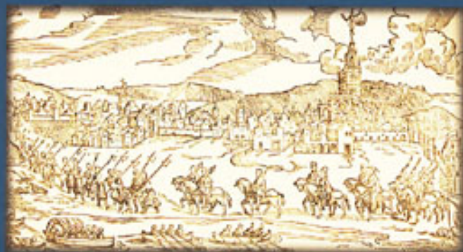
1570. Recibimiento que hizo la ciudad de Sevilla a Felipe II.

La historia de Sevilla en el siglo XVI trasciende el ámbito local y la sitúa en un contexto universal, siendo un centro económico de primer orden que contribuyó como soporte financiero a la política imperial de Carlos I y Felipe II. La ciudad se encuentra circundada por la muralla almohade, que ahora cumple una finalidad, más que defensiva, de control de entrada y salida de personas y mercancías a través de puertas y postigos. En su espacio urbano, aún de apariencia medieval, florecía ya una ciudad moderna, de febril actividad económica, espectacular crecimiento demográfico y soberbios edificios renacentistas, públicos y privados.