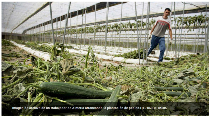
Imagen de archivo de un trabajador de Almería arrancando la plantación de pepino EFE / CARLOS BARBA.