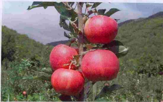
El actual ritmo de venta hace prever que antes de terminar julio no quedará fruta en las cámaras catalanas.

Se estima que en la demarcación de Lleida quedan unas 8.748 toneladas de manzana, lo