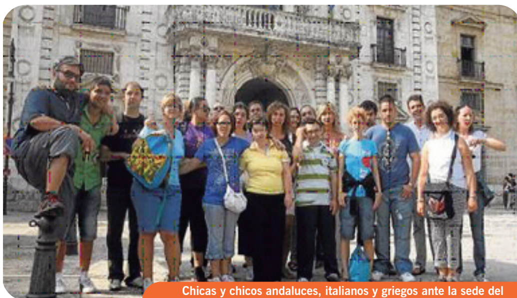
Chicas y chicos andaluces, italianos y griegos ante la sede del Rectorado de la Universidad de Sevilla durante su visita turística.

Cofinanciado por la Consejería para la Igualdad y Bienestar Social y el programa europeo Juventud en Acción, en el que colaboran las asociaciones Paz y bien y Danza Mobile, en Andalucía, IRPEA y Nova Realtà en la región del Veneto. El proyecto tiene una vigencia de dos años, y el grupo andaluz ya había visitado Padua y el pasado mes de septiembre fueron recibidos en Sevilla las chicas y chicos italianos y griegos que se albergaron en las instalaciones de Inturjoven en Sevilla.