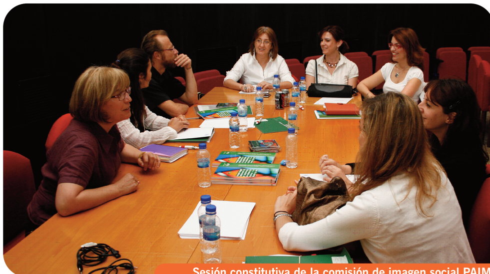
Sesión constitutiva de la comisión de imagen social PAIMDA

Cuando la ciudadanía escucha hablar de la necesidad de mejorar la situación social de las mujeres con discapacidad, su idea apenas escapa de cuestiones como la salud, el empleo, y quizás, la accesibilidad. Por supuesto, en ningún caso las identifican como mujeres, sino que la discapacidad provoca un efecto halo que hace que la sociedad no piense en que, como mujeres, también enfrentan una realidad discriminatoria.