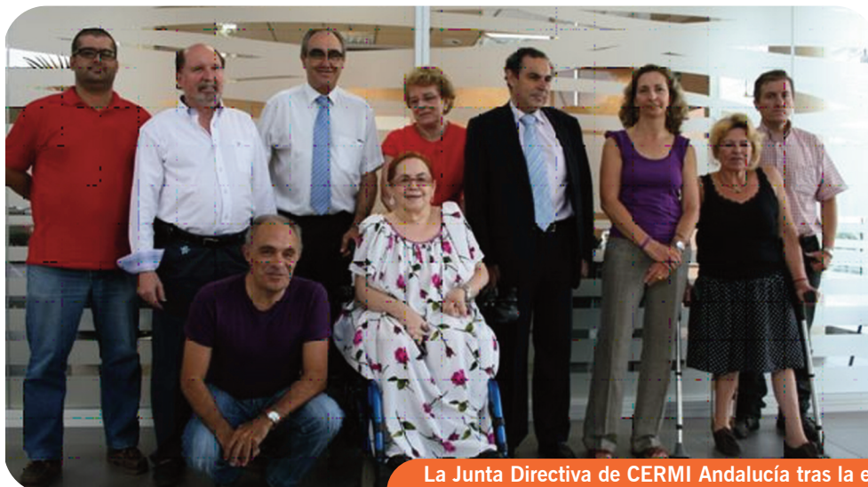
La Junta Directiva de CERMI Andalucía tras la elección de su nuevo presidente.