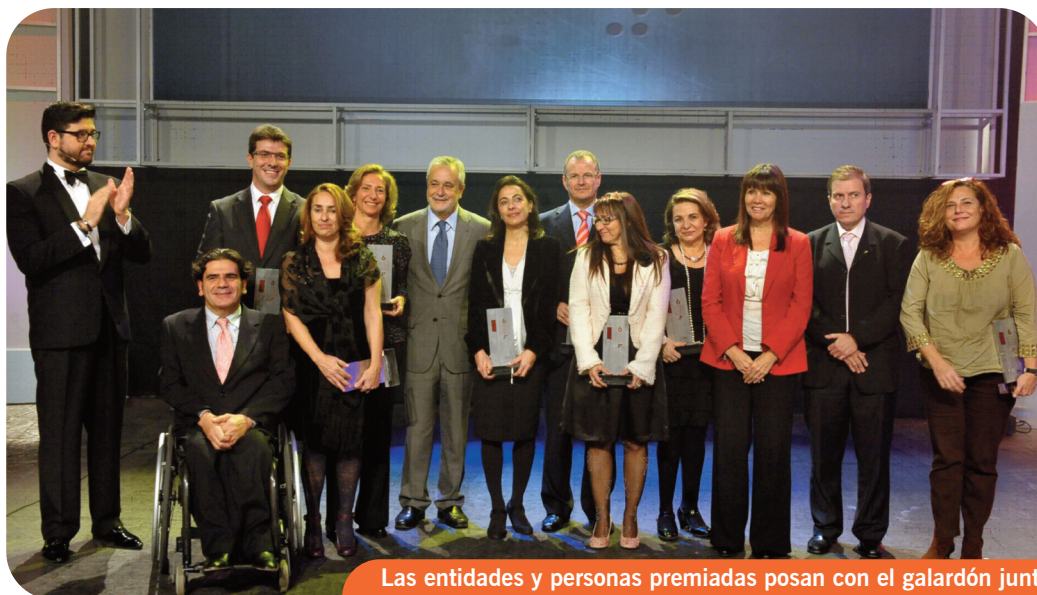
Las entidades y personas premiadas posan con el galardón junto a José Antonio Griñán, Micaela Navarro y Gonzalo Rivas.

La gala tuvo como sede el Teatro Central de Sevilla. Un acto en el que se premiaron, en ocho modalidades, actuaciones que suponen una referencia de buena práctica y modelo de atención en ámbitos como el de inserción laboral, promoción de la accesibilidad universal, apoyo social, igualdad de oportunidades, investigación, atención al alumnado universitario, medios de comunicación y promoción de la autonomía personal. Un acto que celebra el día internacional de las personas con discapacidad y que muestra a la sociedad en su conjunto el buen hacer de entidades, organizaciones sociales y empresas que trabajan por la inclusión de las personas con discapacidad.