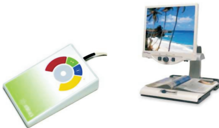
Algunos de los dispositivos del Catálogo de Productos de apoyo TIC.

En la pasada convocatoria, más de 1.300 personas adquirieron dispositivos tecnológicos adaptados a sus necesidades. La actual orden pretende garantizar el acceso a la Sociedad de la Información el Conocimiento en igualdad de condiciones y permite el disfrute de los beneficios que las nuevas tecnologías aportan para mejorar su calidad de vida.