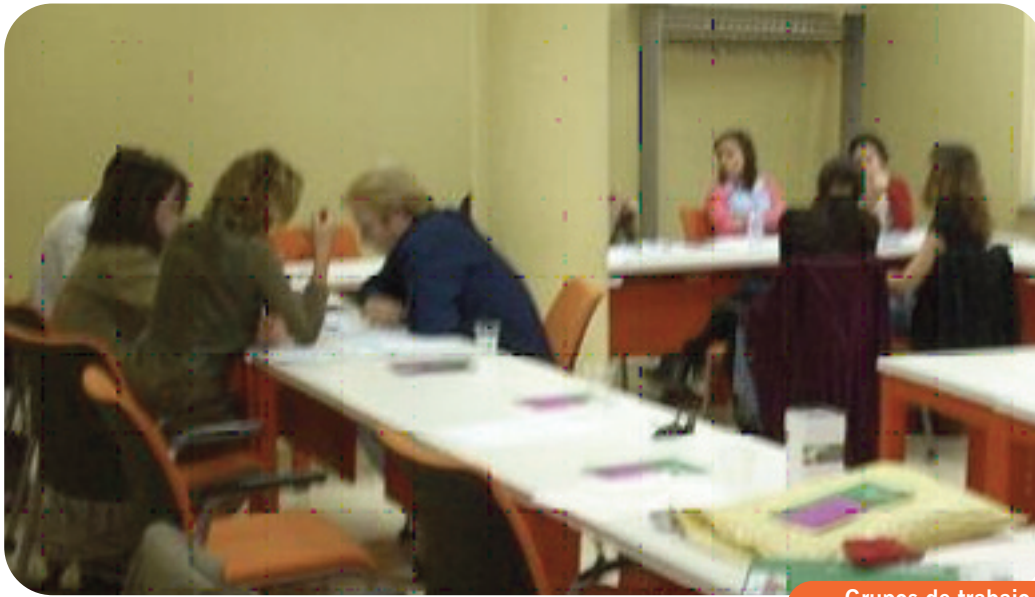
Grupos de trabajo

Entre los meses de junio y octubre se han celebrado en Sevilla 5 sesiones de trabajo del seminario de “CAPACITACIÓN EN PLANIFICACIÓN ESTRATÉGICA CON PERSPECTIVA DE GÉNERO” que la Dirección General de Personas con discapacidad organizó en el contexto del I Plan de acción integral para las mujeres con discapacidad en Andalucía (PAIMDA), actividad que ha respondido a la necesidad detectada de seguir insistiendo en la integración del enfoque de género en las actuaciones que desarrollamos con las personas con discapacidad. La formación se ha dirigido a las/los profesionales y responsables de la planificación del I PAIMDA en las distintas Consejerías de la Junta de Andalucía así como a personal del movimiento asociativo de toda Andalucía. En total, han asistido 41 personas, de las que 4 eran hombres. La formación fue impartida por Likadi.