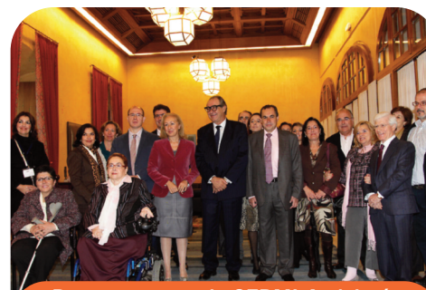
Representantes de CERMI-Andalucía junto a la Presidenta.

Con el mismo motivo, multitud de actos se celebraron en toda Andalucía. La programación conjunta de actividades se encuentra disponible en la web de la Consejería para la Igualdad y Bienestar Social: www.juntadeandalucia.es/igualdadybienestarsocial .