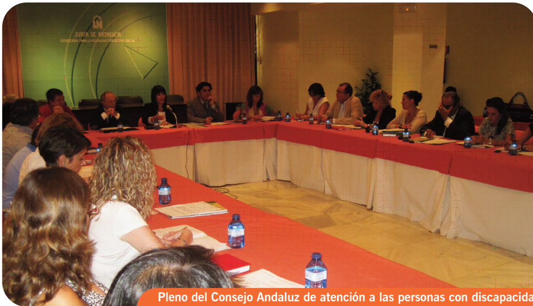
Pleno del Consejo Andaluz de atención a las personas con discapacidad presidido por la Consejera para la Igualdad y Bienestar Social.