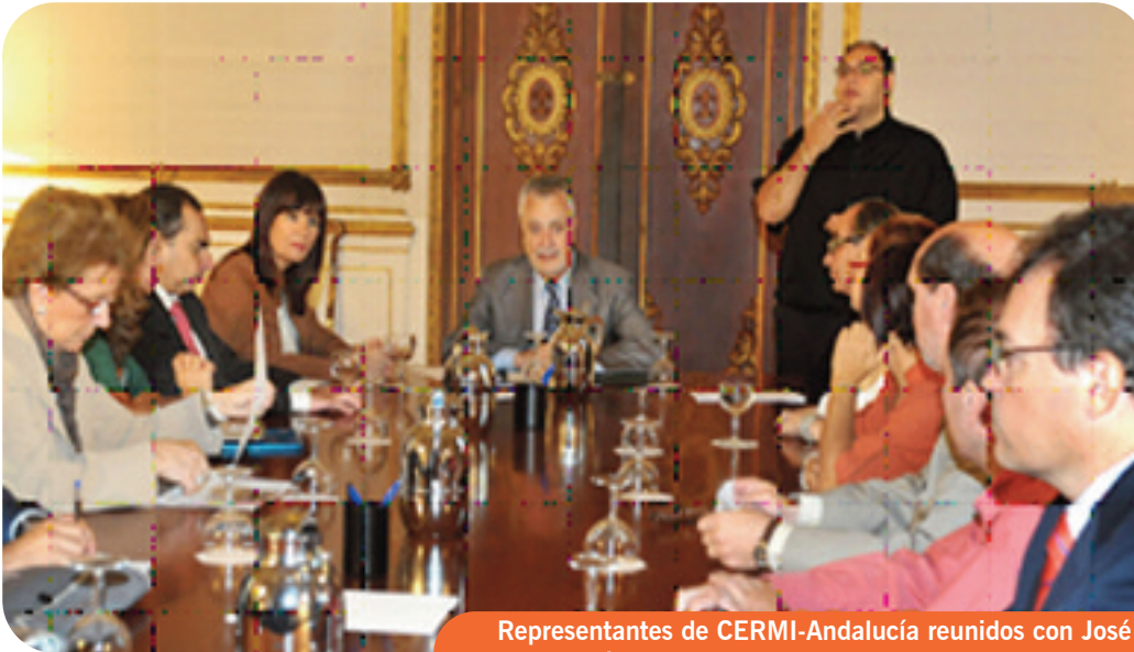
Representantes de CERMI-Andalucía reunidos con José Antonio Griñán y Micaela Navarro en la sede de la Presidencia