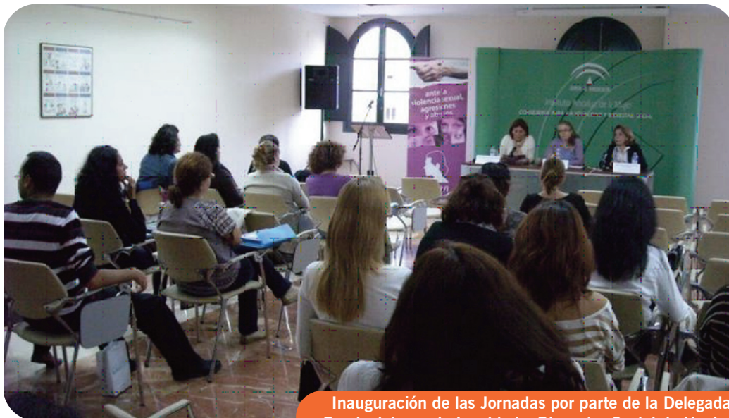
Inauguración de las Jornadas por parte de la Delegada Provincial para la Igualdad y Bienestar Social de Huelva.

En desarrollo del PAIMDA, entre los meses de abril y octubre la asociación AMUVI ha impartido cursos en esta materia en Jaén, Jerez y Huelva, que han contado con la colaboración de la Dirección General de Personas con discapacidad. Los perfiles profesionales han sido fuerzas y cuerpos de seguridad (guardia civil y policía local), personal de las residencias y centros de personas con discapacidad (dirección, educadores, auxiliares de enfermería), abogadas, trabajadoras sociales, psicólogas y educadoras de los centros municipales de información a la mujer, servicios sociales y casa de acogida.