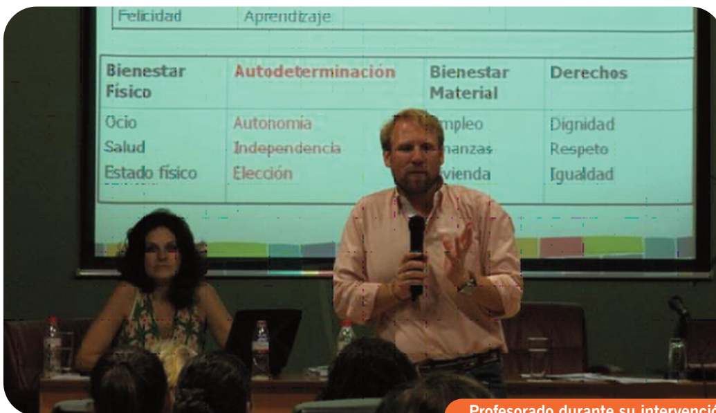
Profesorado durante su intervención