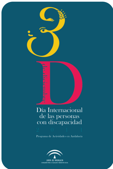
Cartel con motivo de Día 3 de diciembre

El pasado 2 de diciembre, con objeto de celebrar el Día Internacional de las Personas con Discapacidad, la presidenta del Parlamento de Andalucía, Fuensanta Coves Botella leyó en la sede parlamentaria el Manifiesto elaborado por CERMI-Andalucía