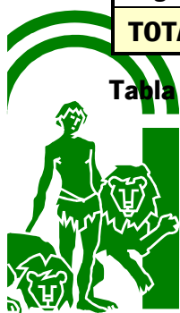
Tabla 4. Calificación sanitaria (tuberculosis bovina) de las explotaciones bovinas investigadas en 2005 e incluidas en programa de la provincia de Sevilla. Número de explotaciones, por comarca, de acuerdo a su estatuto sanitario.