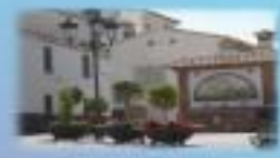
2. Plaza de la Constitución