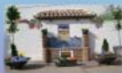
1. Fuente de la Cruz