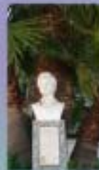
3. Plaza de Alfonso XIII