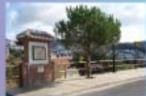
4. Centro Puntos de la Salud