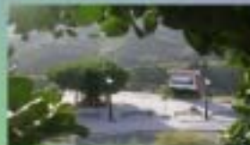
5. Monumento del Aljorro