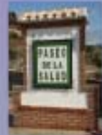
6. Paseo de la Salud