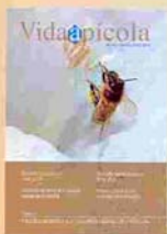
FOTO PORTADA Abeja en flor de estramonio.

DIRECTORA VIDA APÍCOLA Silvia Cañas Lloria. EDICIÓN René Palomo. EDITA