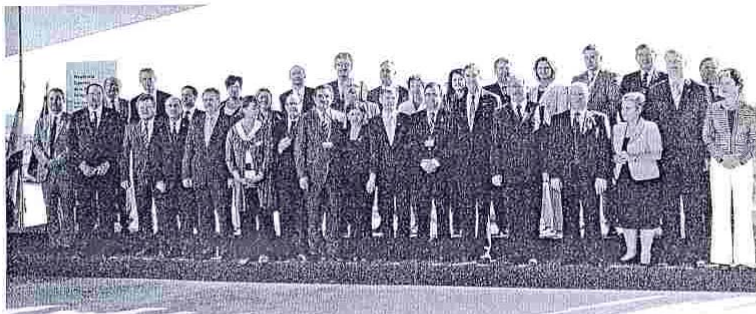
Los ministros de Agricultura de la Unión Europea se reúnen en Mérida durante un encuentro celebrado del 30 de mayo al 1 de junio.