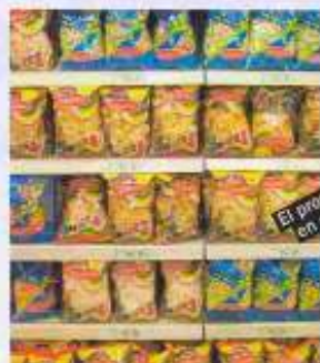
El producto en el lineal

Pepsico y la MDD controlan el lineal de snacks 32