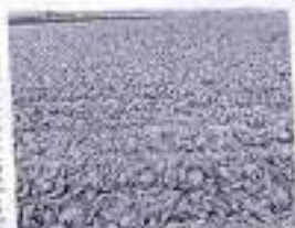
Los productores de lechuga iceberg en España han reducido un 27% el volumen disponible en el mercado nacional...