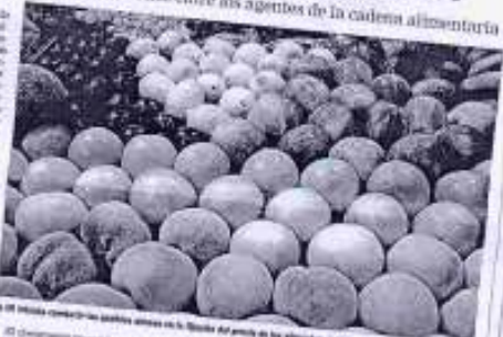
En el mercado comercial se venden frutas en la tienda del grupo de los agricultores.

4 VALENCIA FRUITS REUNIÓN Las organizaciones Agrícolas de la Unión. El pasado 15 de mayo se celebró el primer día de una reunión de trabajo para tratar los temas de interés común de los productores de frutas y verduras de la zona de Valencia y de los países de la Unión Europea. La reunión se celebró en el Hotel Valencia, con la participación de representantes de las organizaciones de productores de frutas y verduras de España y de los países de la Unión Europea. La reunión se celebró en el Hotel Valencia, con la participación de representantes de las organizaciones de productores de frutas y verduras de España y de los países de la Unión Europea.