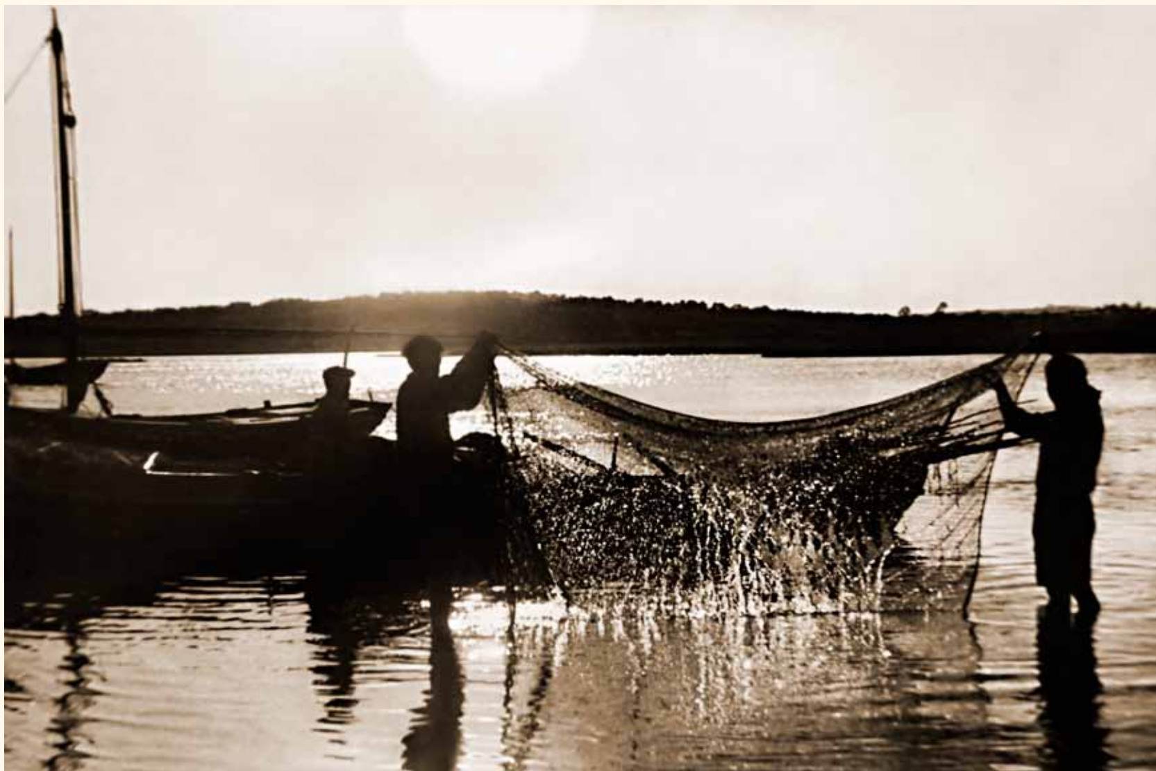
Lavando redes en la ribera