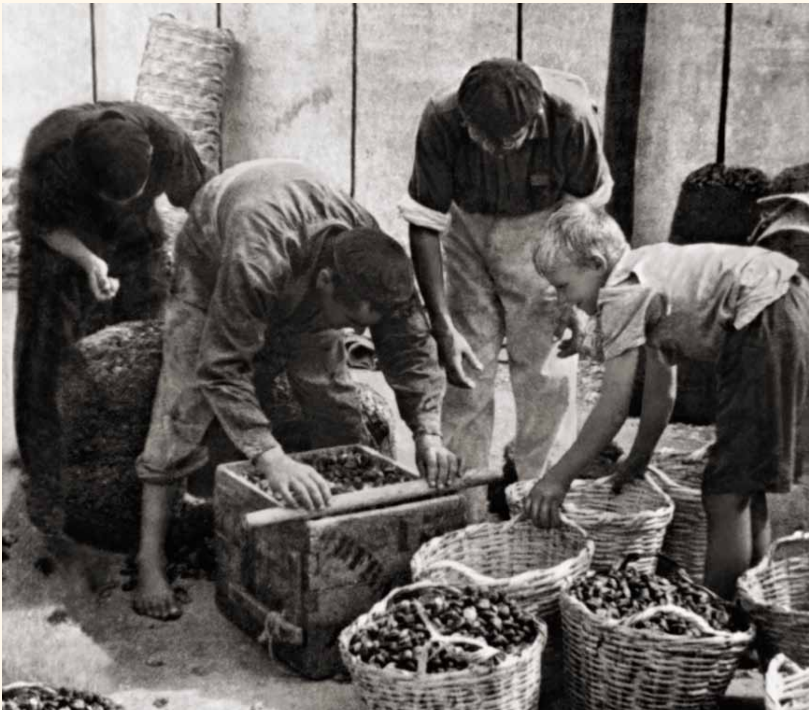
Preparación del marisco y colocación del mismo en cajas para su transporte, en el antiguo muelle pesquero Hacia 1955. Punta Umbría