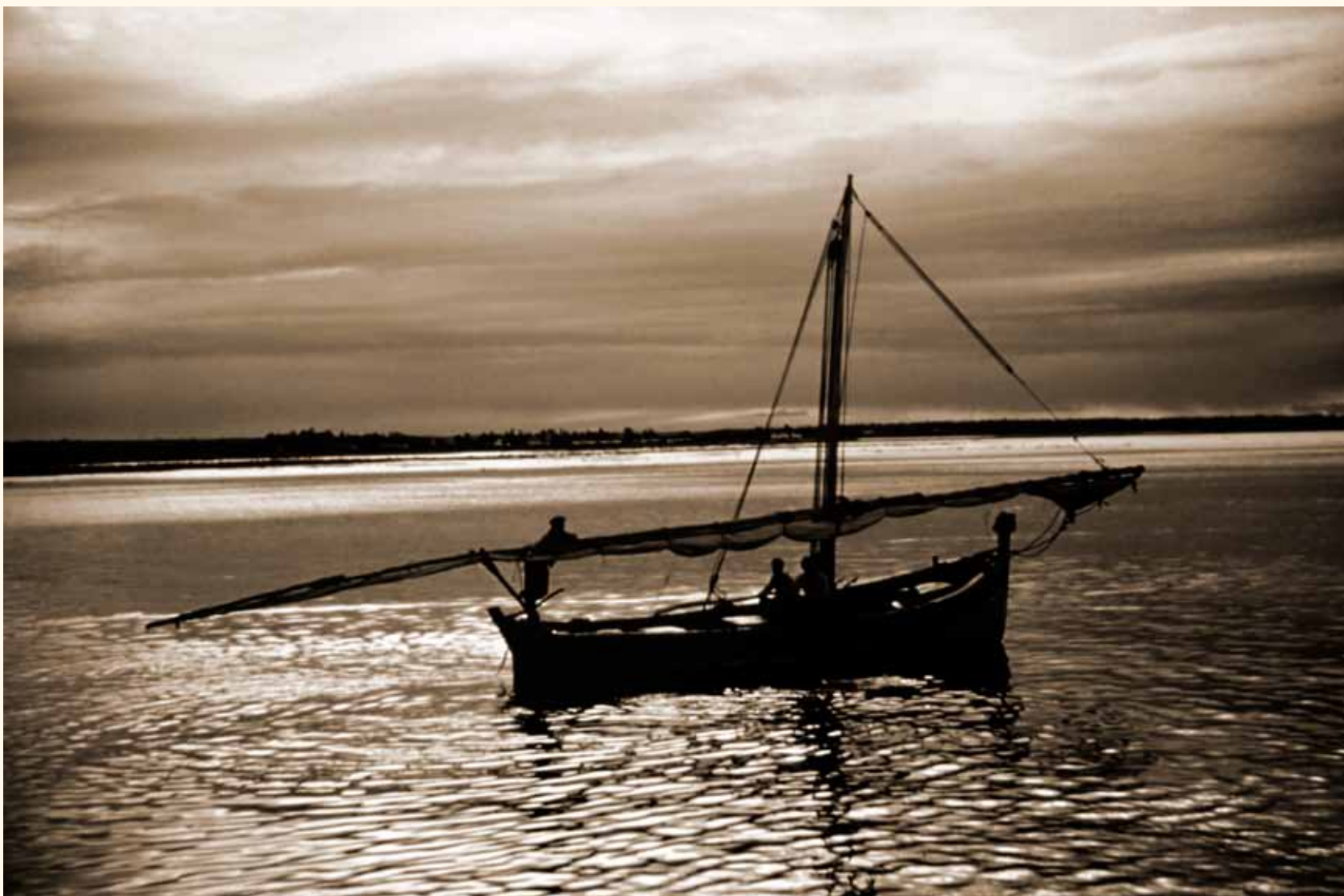
Bote de vela latina en la Ría de Punta Umbría