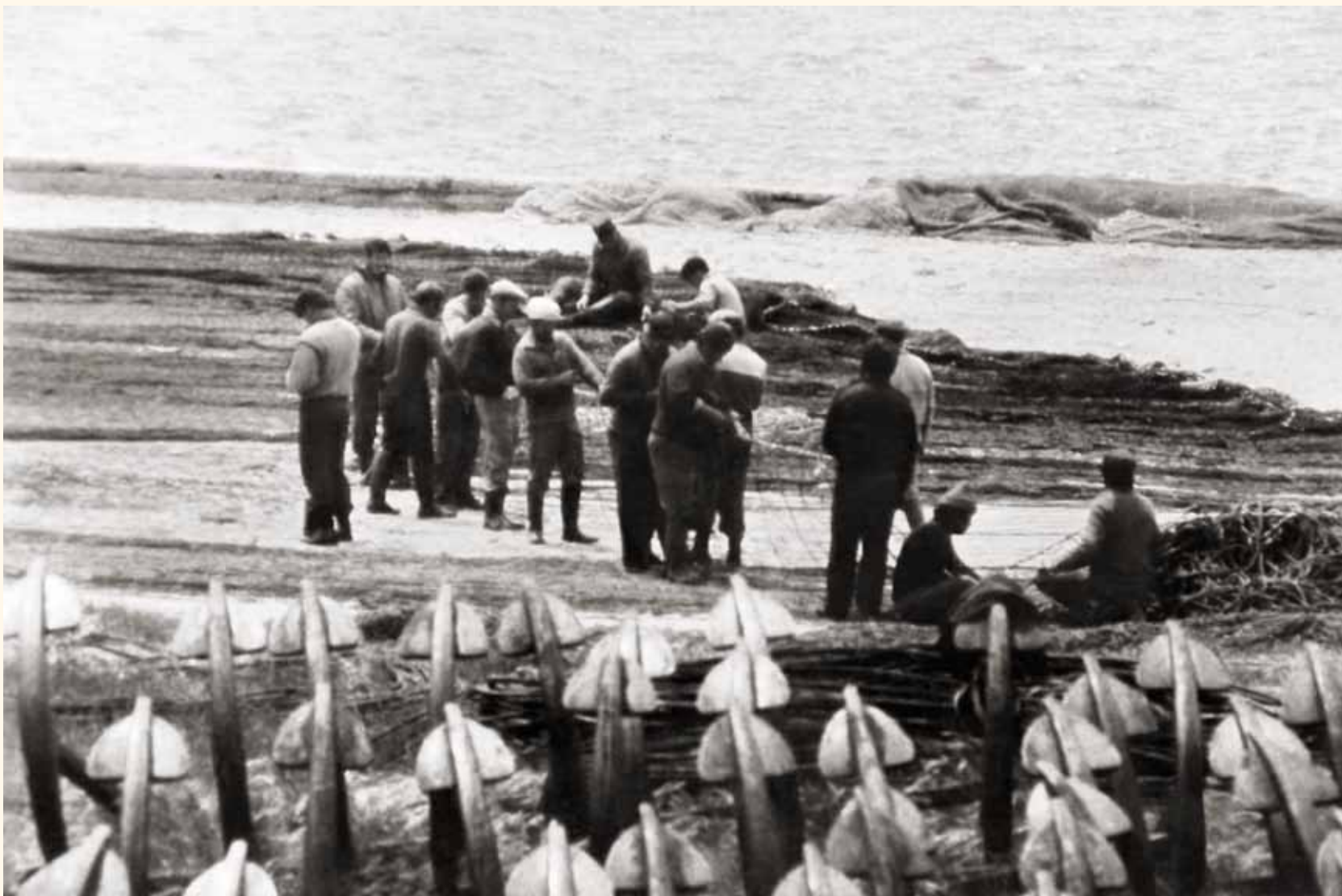
Grupo de marineros trabajando las redes en la zona conocida como “Las Calderas”, donde también se almacenaban las anclas de la almadraba fuera de temporada