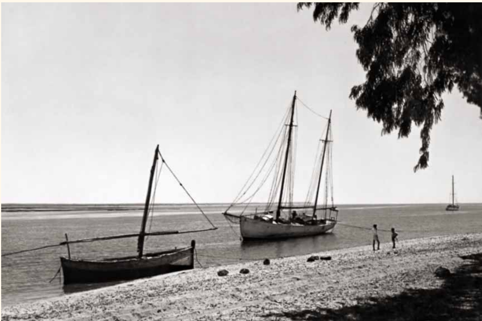
Barcos en la Ría de Punta Umbría, zona del actual Paseo Pérez de Guzmán