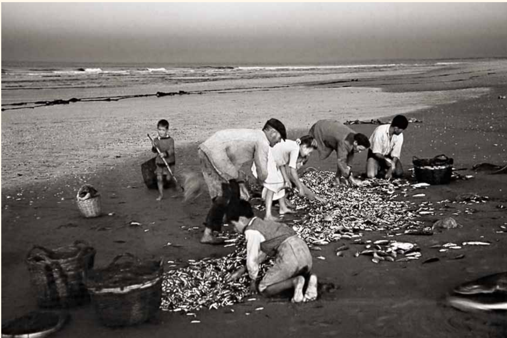
Pesca con jábega, selección de las capturas. Secuencia 4ª