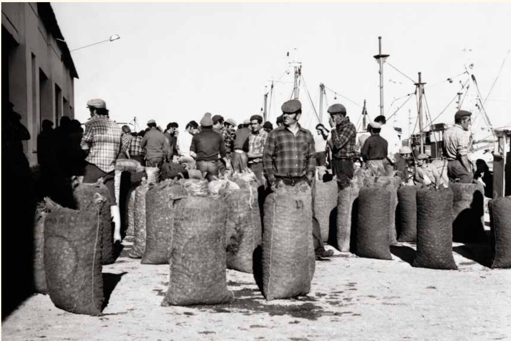
Los sacos de chirlas o almejones en las instalaciones de la lonja para la subasta