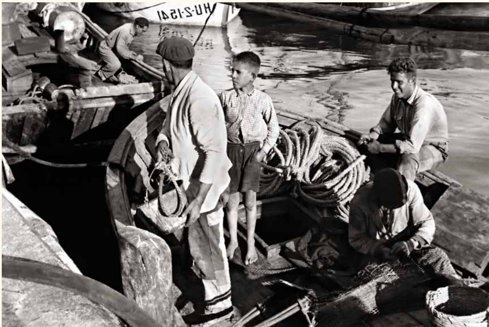
Marineros en el muelle pesquero de Isla Cristina