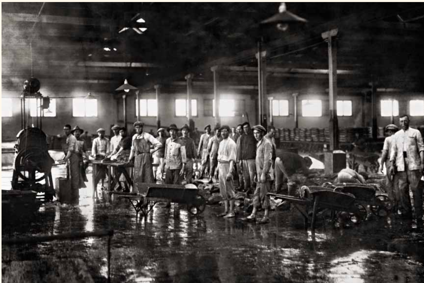
Chanca de la fábrica del Consorcio Nacional Almadrabeto