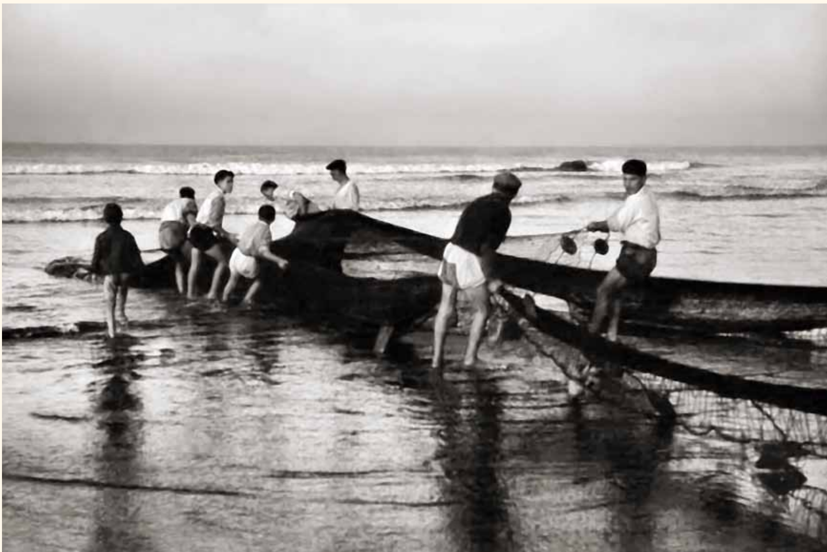
Pesca con jábega, marineros jalando el arte. Secuencia 2ª