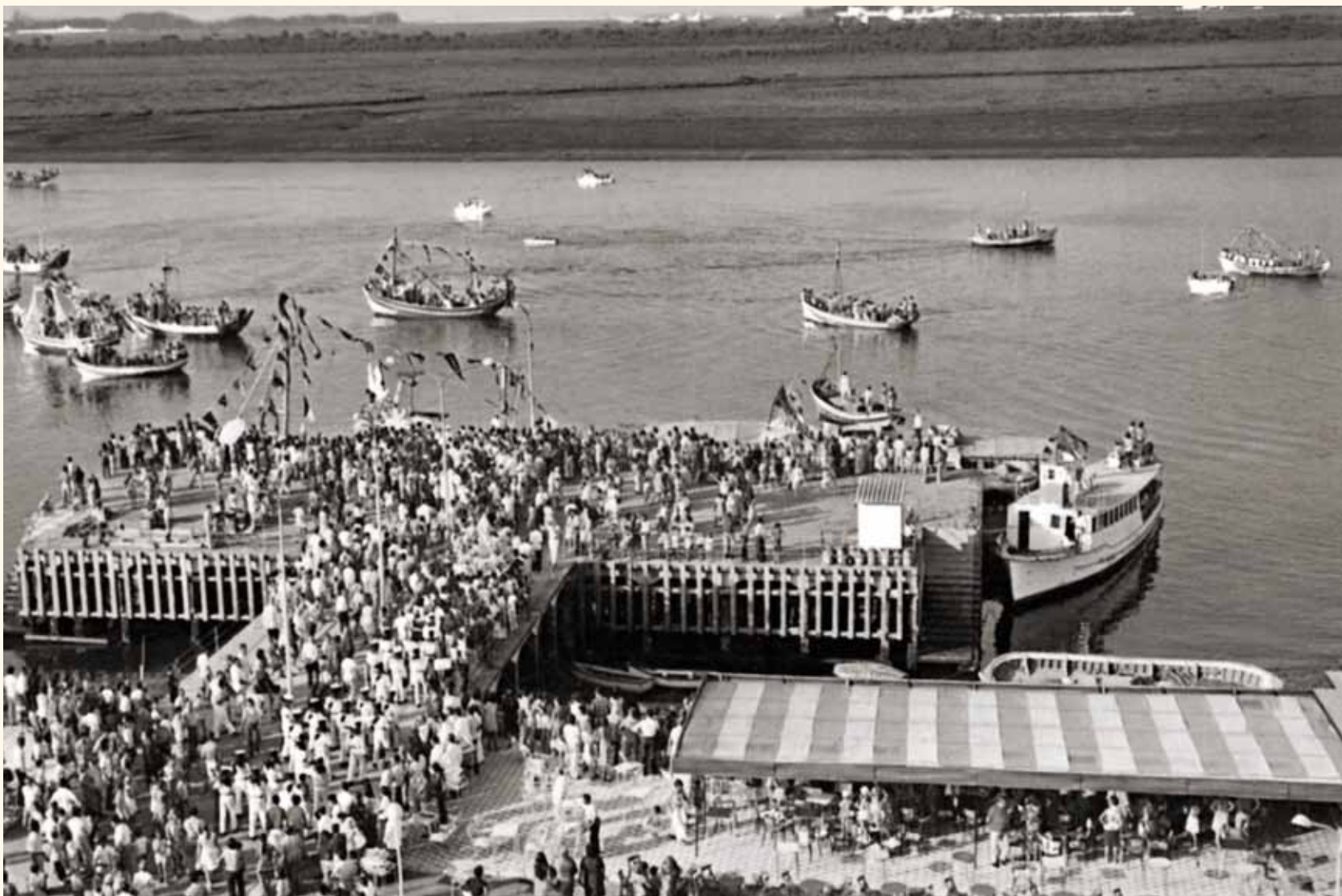
Muelle pesquero y plaza Pérez Pastor abarrotados de gente para ver la procesión de la Virgen del Carmen en el mes de Agosto. Al fondo la Isla de Saltés