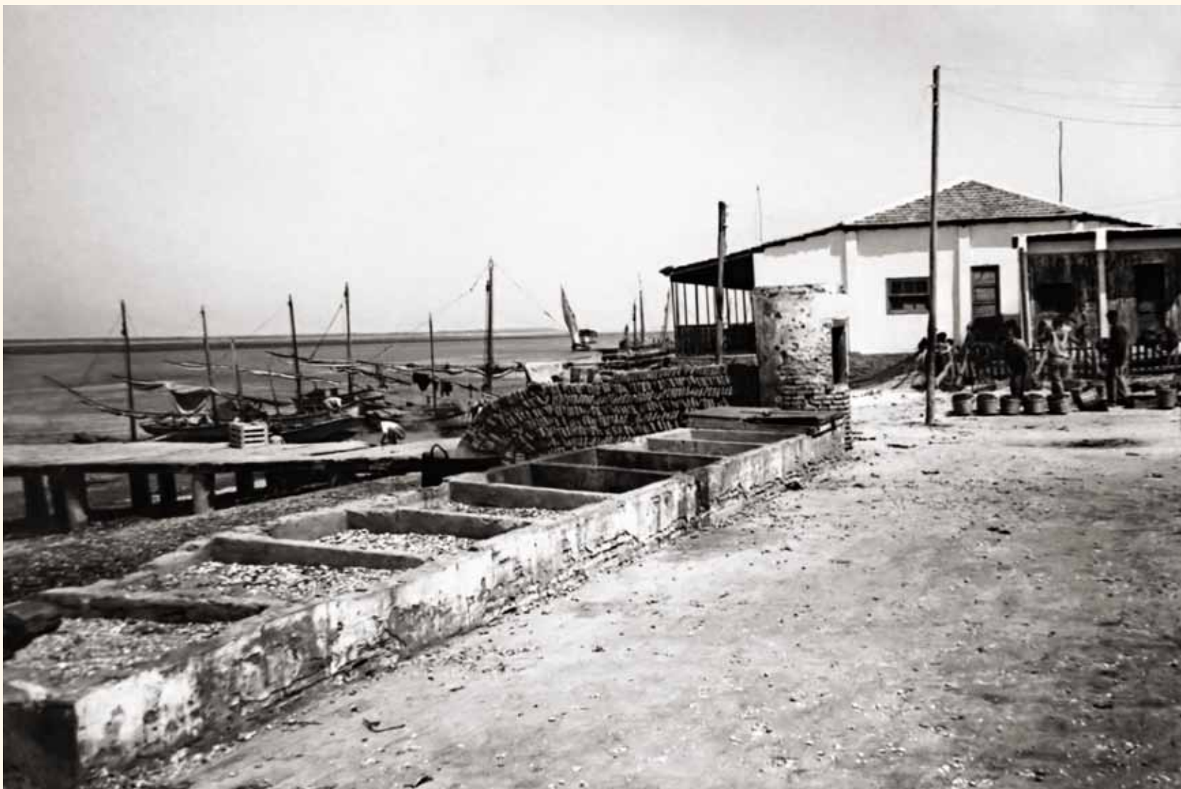
Antiguo muelle pesquero, lonja y explanada anexa. Al fondo “Bar Perico” Hacia 1950. Punta Umbría