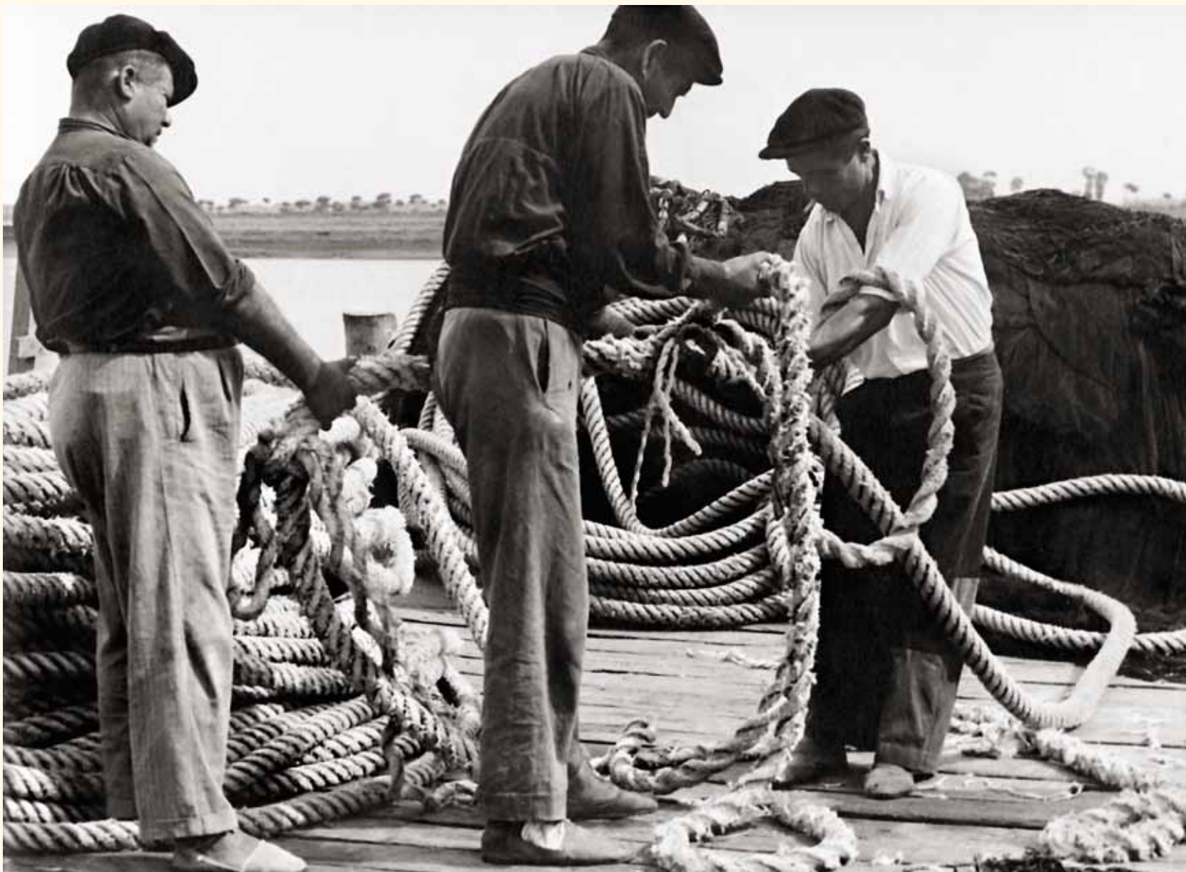
Marineros de Punta Umbría trabajando un cabo en el antiguo muelle pesquero