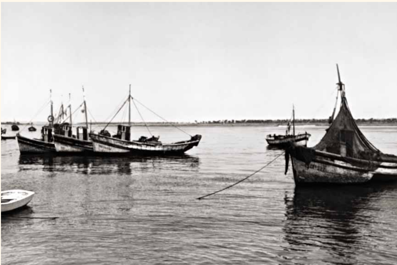
Barcos en la Ría de Punta Umbría, al fondo la Isla de Saltés Hacia 1960. Punta Umbría Tarjeta postal