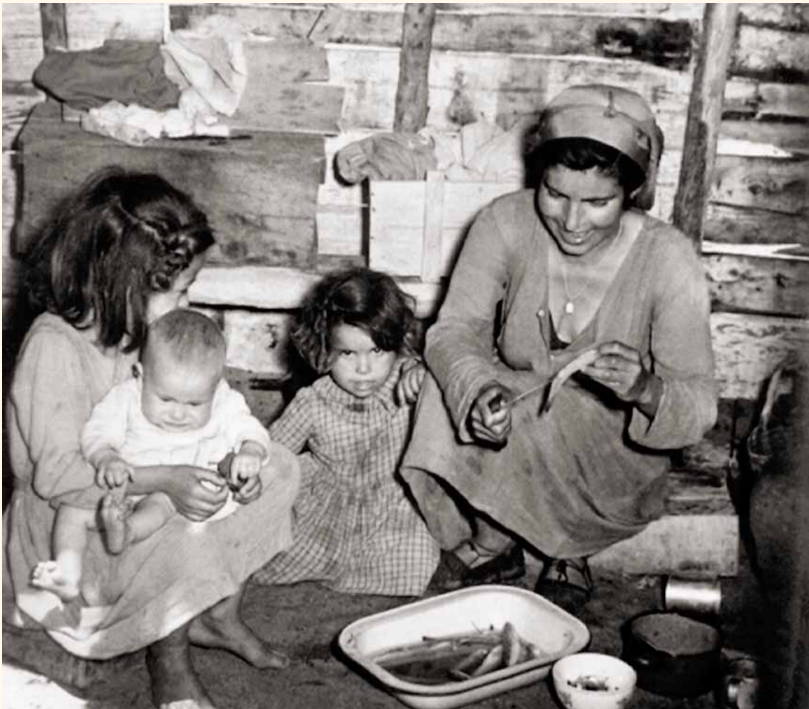
Familia en una de las antiguas “casetas” de Punta Umbría preparando el pescado