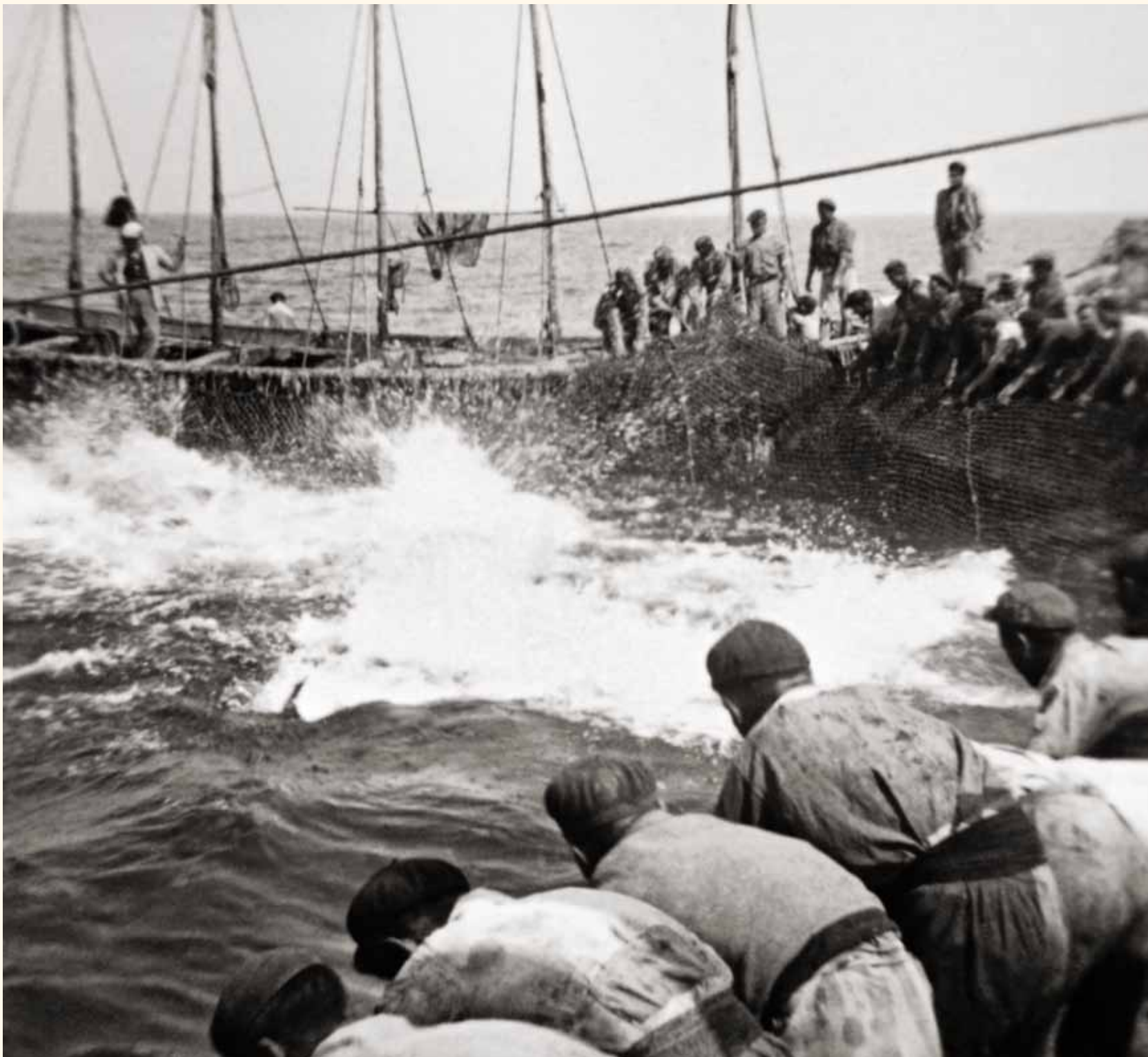
“Levantá” en la Almadraba de Nueva Umbría -“Jalando” la red - Año sin determinar. El Rompido - Cartaya