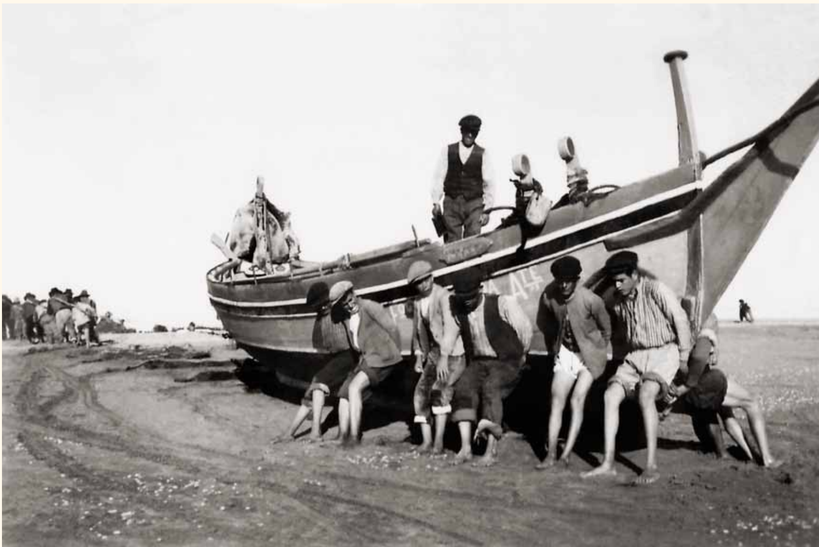
Un grupo de pescadores sacando una barca de jábega Año 1947. La Antilla - Lepe