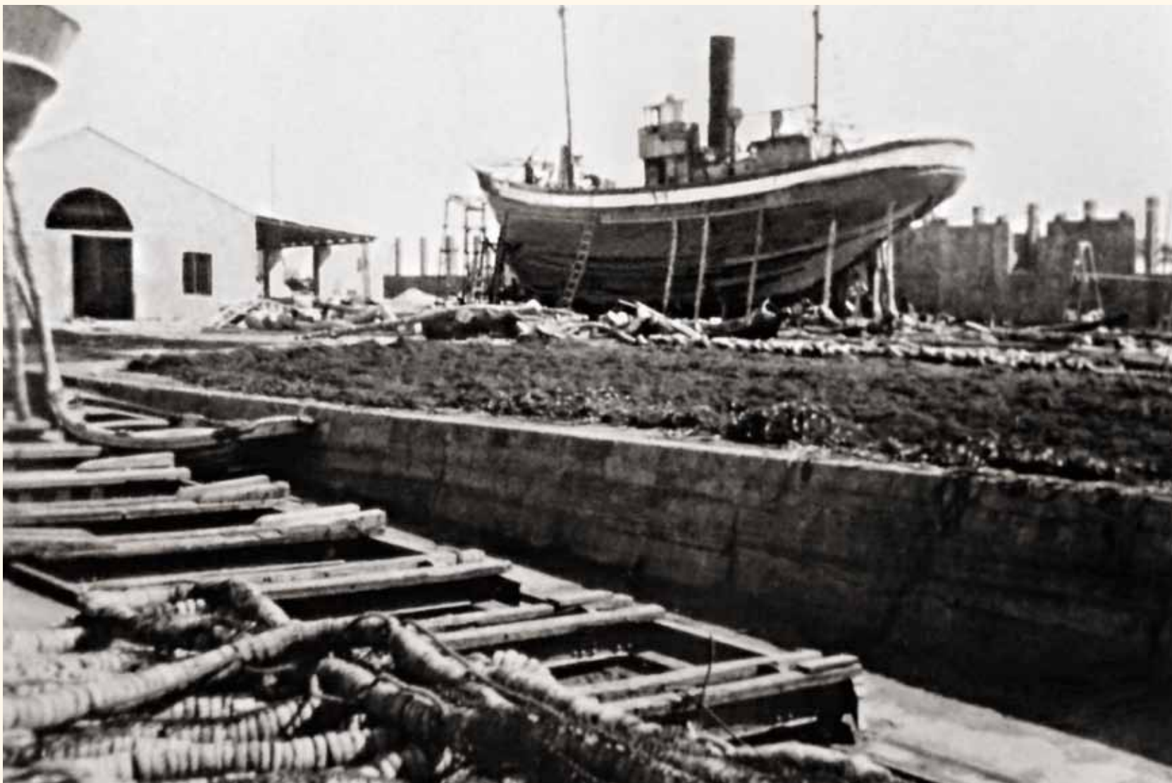
Vista de uno de los astilleros situados en la orilla norte de la Ría Carreras, con el carro en primer término