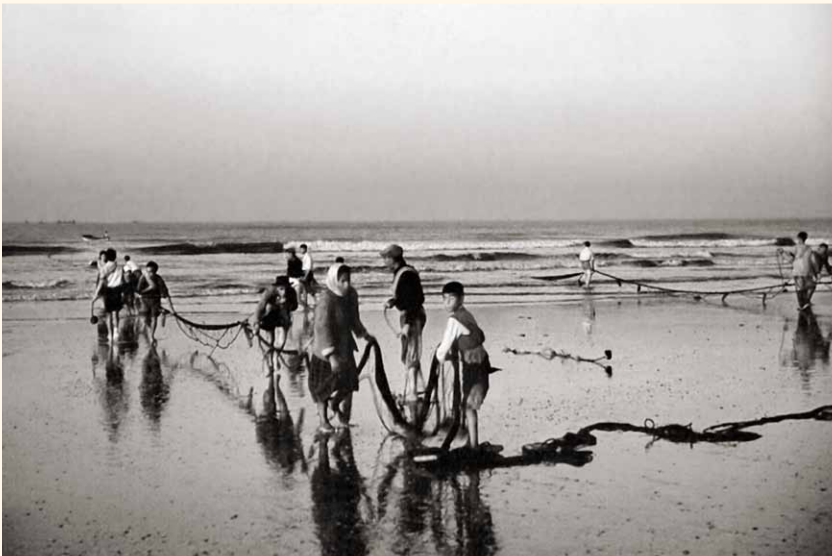
Pesca con jábega, marineros jalando el arte. Secuencia 3 a