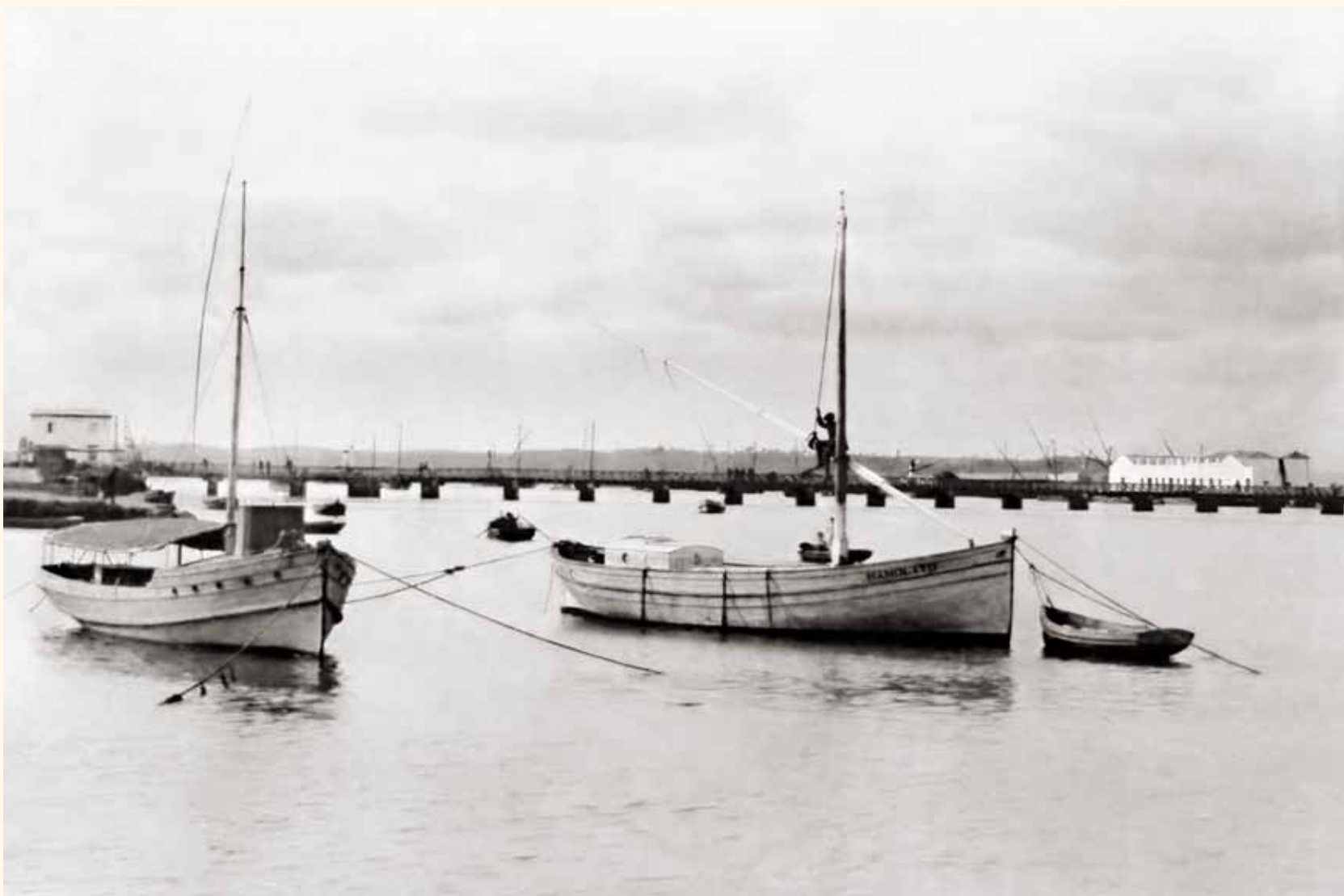
Imagen de la Ría Carreras, donde se observa el primer puente que conectó a Isla Cristina por tierra, situado junto a la calle Carreras y edificado en 1892