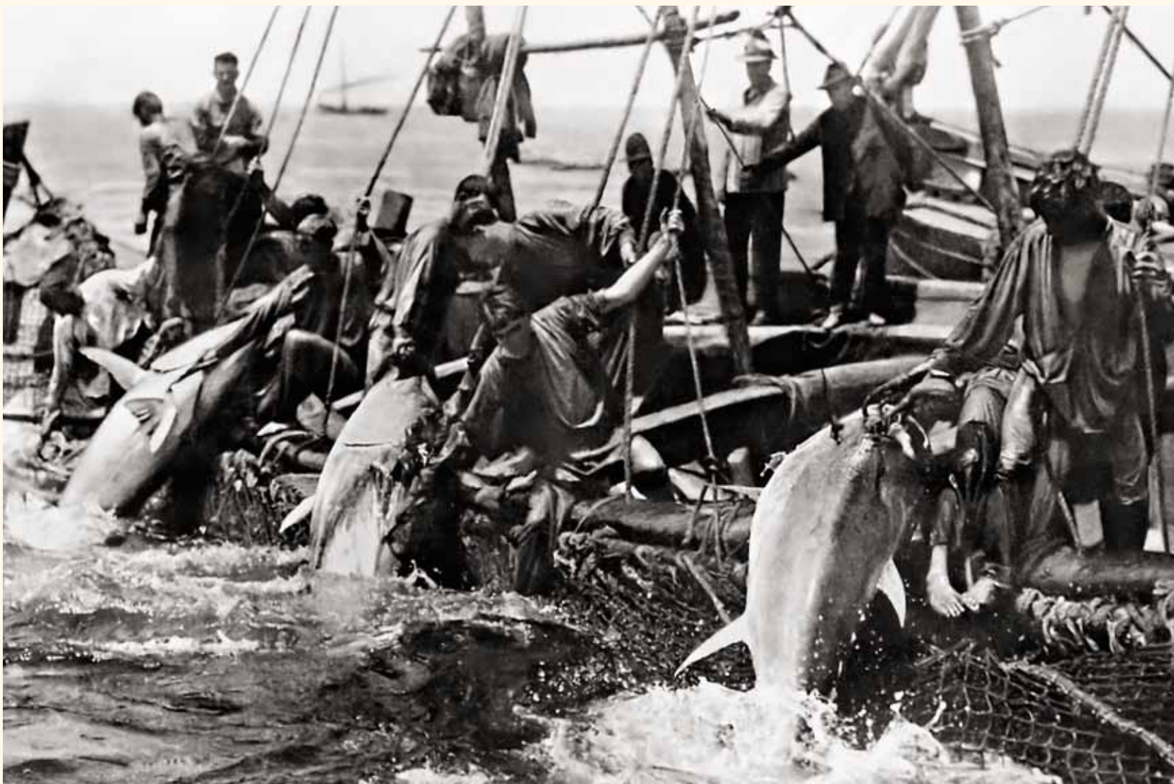
“Levantá” en la Almadraba de Nueva Umbría - “Copejando” el atún - Año sin determinar. El Rompido – Cartaya