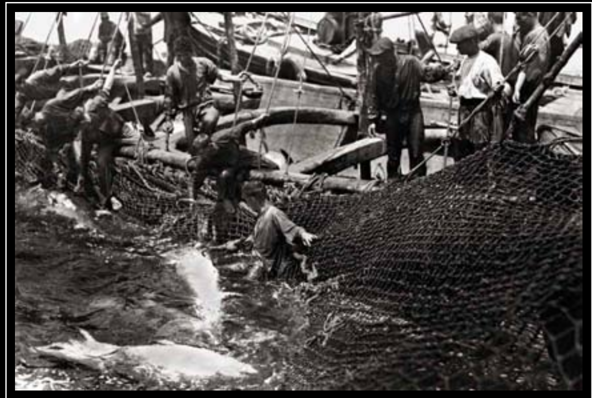
ISLA CRISTINA, del 20 al 26 de septiembre de 2010