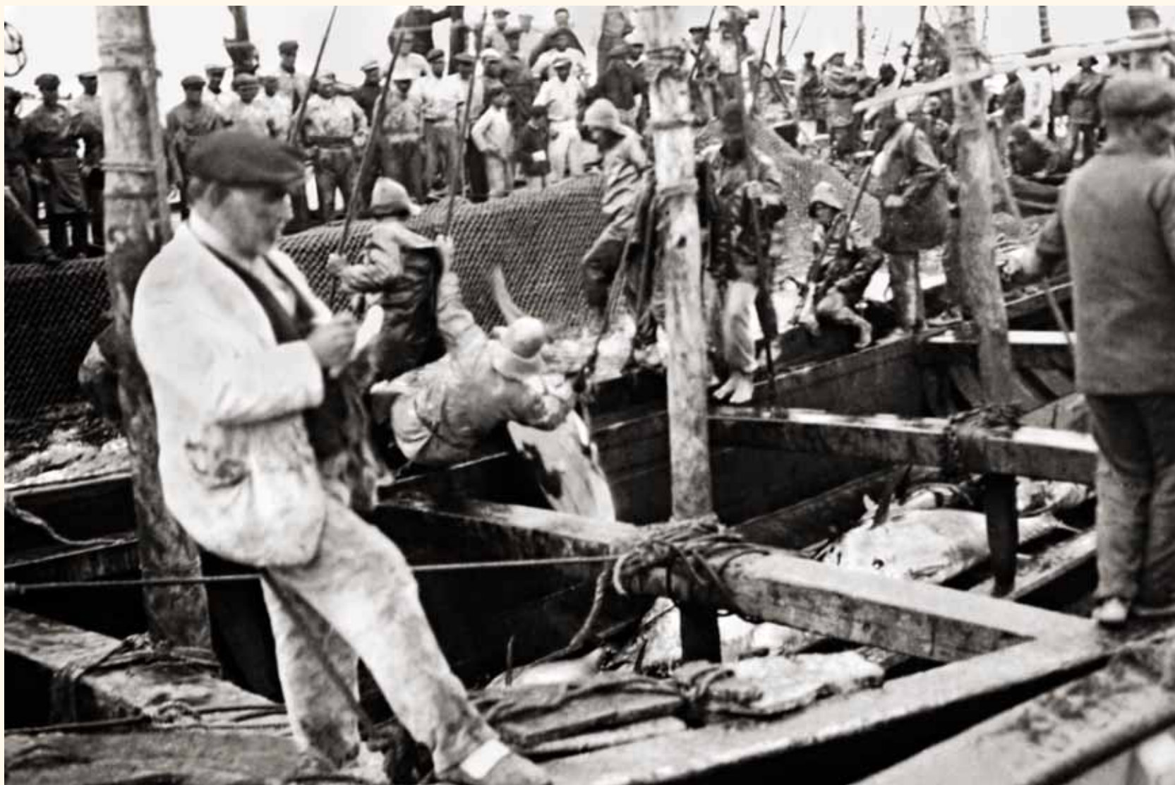
“Levantá” en la Almadraba de las Cabezas. Secuencia 1ª