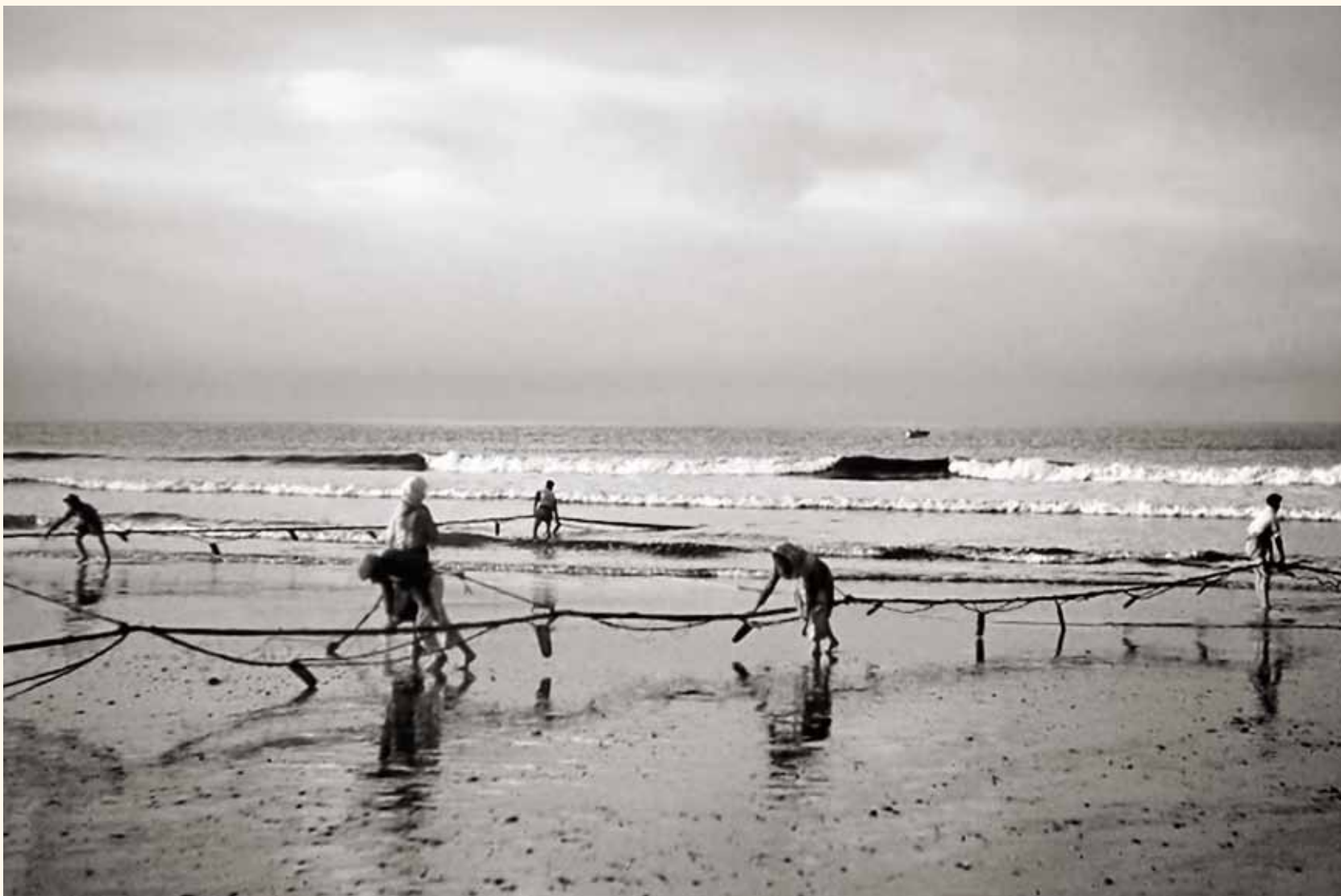
Pesca con jábega, marineros jalando el arte. Secuencia 1 a