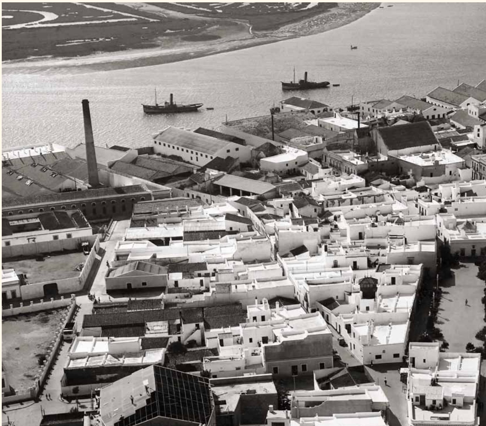
Imagen donde se aprecia; la chimenea de la Fábrica “Ribera” del Consorcio Nacional Almadrabeto, los barcos en la ría, y, junto a la plaza, uno de los típicos miradores de banderas