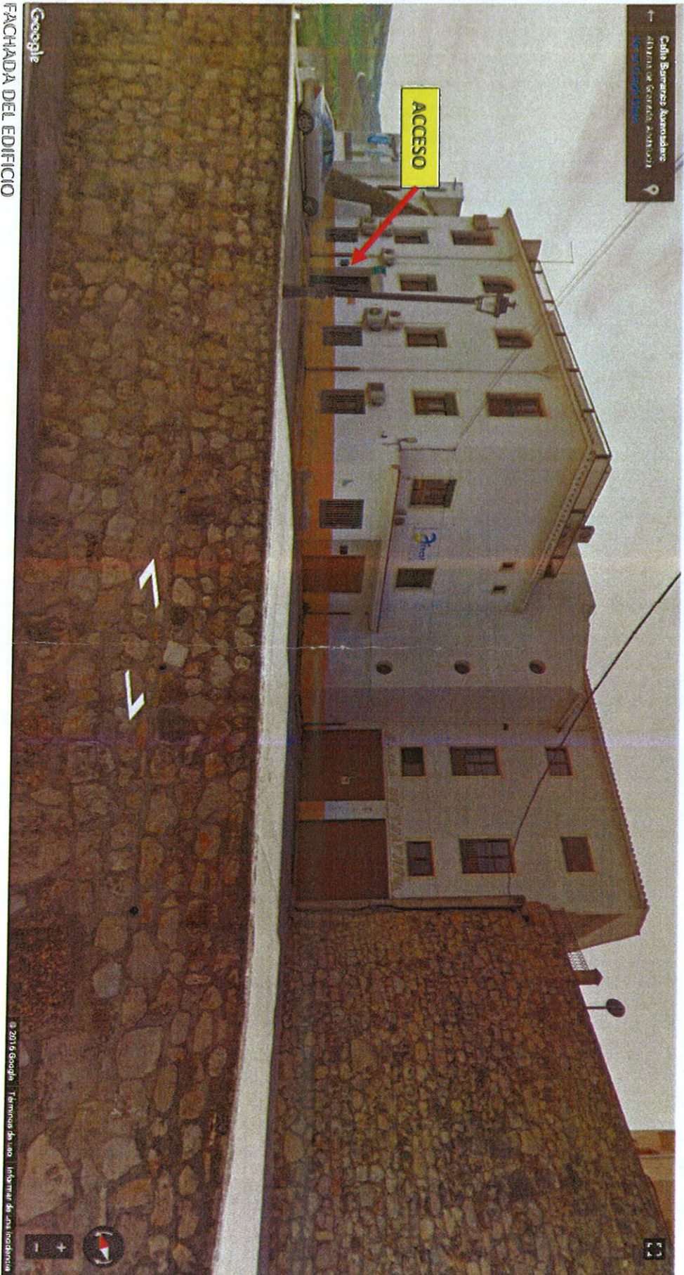
FACHADA DEL EDIFICIO