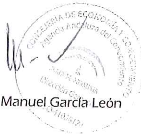
Fdo.: Manuel García León

Por la Agencia Andaluza del Conocimiento,