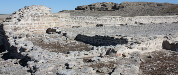
Vue de l'acropole depuis l'angle sud-occidental de la muraille tardo-islamique et le bas marché médiéval

siècle avant J.C., une autre série de nouvelles œuvres a été découverte, telle que la construction d'un grand mur, que l'on pense –dans l'attente de nouvelles fouilles– qu'il a appartenu à un possible temple de cette époque.