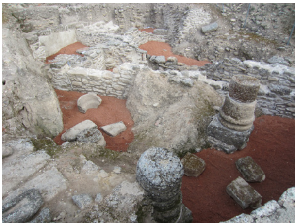
Restes des parements de ce qui a pu être la place d'Ategua

De même, deux pièces quasi complètes ont été découvertes, ainsi qu'une série de structures provenant de thermes. Seul l'un des espaces, équipé d'une baignoire carrée aux dimensions considérables, a pu être identifié comme un frigidarium. Le plan architectonique de l'ensemble des fouilles et leurs caractéristiques de construction, similaires à celles d'autres ensembles thermaux de la péninsule, permettent de leur attribuer une chronologie tardo-républicaine ou de la première phase impériale en ce qui concerne leur construction et leur usage.