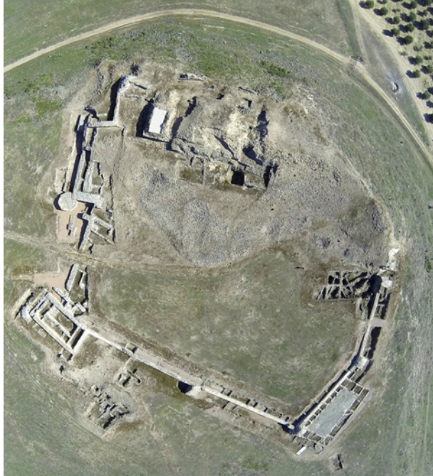
Vue aérienne de l'acropole, des thermes et des édifices romains, ainsi que de l'enceinte tardo-islamique et du bas marché médiéval

C'est la reddition et la capitulation d' Ategua , après un long et difficile assaut aux mains des troupes de Jules César, qui ont permis la chute de la Colonie Patricia Corduba , capitale de la Bétique, en l'an 45 avant J.C. Après cette victoire, Jules César a poursuivi son victorieux périple guerrier sur le sol hispanique, réussissant à vaincre les partisans des fils de Pompéi lors de la bataille de Munda et revenir ensuite triomphant à Rome.