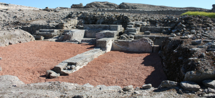
Vue partielle des thermes romains

des données épigraphiques et des événements historiques qui soulignent la vie de la ville à cette époque.