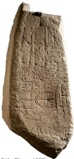
Stèle d'Ategua. VIII ème - VII ème siècles avant J.C.

dans l'absolu, car cette chronologie est confirmée dans d'autres oppida d'Andalousie Occidentale.