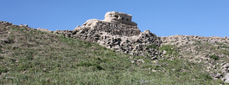
Segment oriental de la muraille tardo-islamique

Phase VII. Époque médiévale: Au Moyen-âge et au moins depuis le X ème siècle, Ategua est un petit hameau dépendant de la division territoriale de Qurtuba. Jusqu'à présent, aucune structure pouvant être associée à des moments haut-moyenâgeux n'a été découverte.