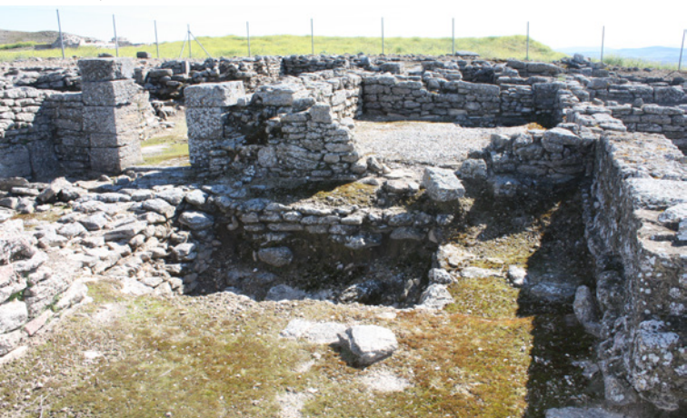
Vue partielle des maisons romaines

De cette période historique on connaît, outre le périmètre de la muraille qui a défendu la ville romaine et qui, très probablement, se superpose à une autre proche plus ancienne, quelques édifices,