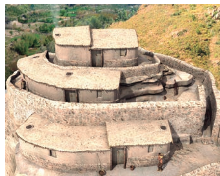
↓ Reconstrucción virtual de la acrópolis.

En la sepultura número 19 se enterró un varón de entre 20 y 25 años de edad que fue decapitado y su cabeza, junto a las tres primeras vértebras cervicales, fue colocada entre sus manos, este proceso se hizo post mortem , a las pocas horas de morir, pues no hay alteraciones anatómicas.