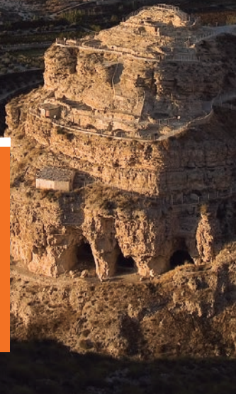
↑ Vista general del yacimiento.