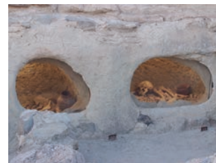
↑ Sepulturas 18 y 19 de la ladera.

para albergar el difunto. Esta covacha se cierra con una losa de piedra y la fosa se colmata con tierra y piedras.