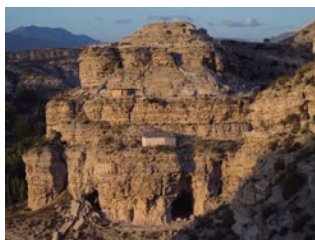
↑ Vista del cabezo con las tres terrazas naturales.

La parte más alta del cabezo la ocupa un recinto delimitado por un muro al que solamente se puede acceder por un pasillo en la parte sur. La existencia de una cisterna en esta zona, nos señala que el control del agua era ejercido por las familias de mayor rango que se situaron aquí. El mayor tamaño de las viviendas que hay dentro del recinto y la riqueza en los ajuares hallados en éstas confirman que estaba ocupado por la élite del poblado.