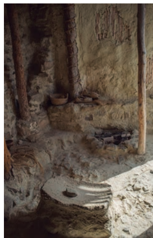
↑ Interior de la vivienda reconstruida.

En este sector hay muros de dos momentos diferentes. Las estructuras circulares pertenecen a un primer momento y las rectilíneas a viviendas de un segundo momento. La vivienda del extremo oeste conservaba varias vasijas de almacenamiento de grandes dimensiones. En la otra vivienda encontramos una sepultura infantil en urna de cerámica.