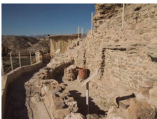
↑ Ámbitos domésticos en la Terraza Intermedia.

Se trata de un enterramiento de un hombre de alrededor 40 años y una mujer de unos 25 que probablemente fueron enterrados al mismo tiempo porque los dos esqueletos conservan su posición fetal original.