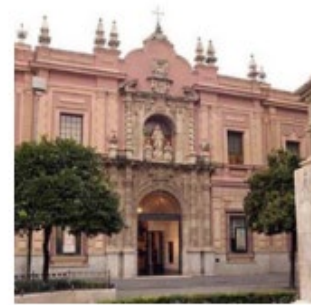
Museo Bellas Artes