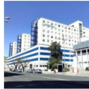
Hospital Puerta del Mar