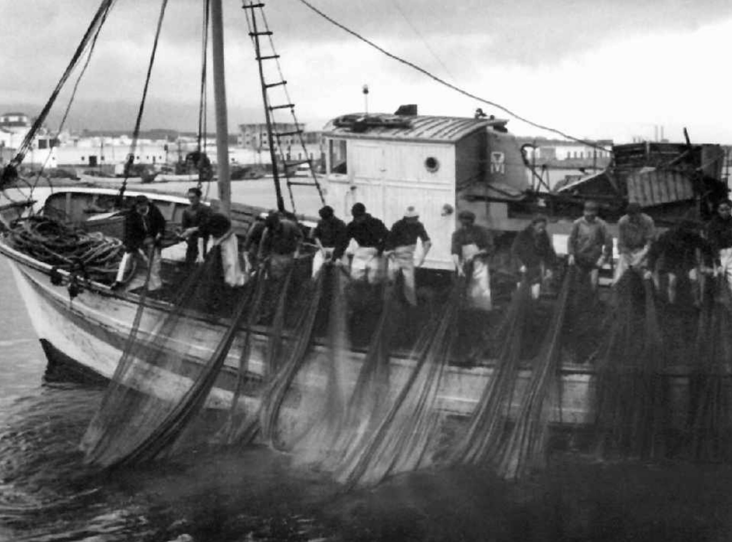
Lavando la red que los une. Adra. Hacia 1950