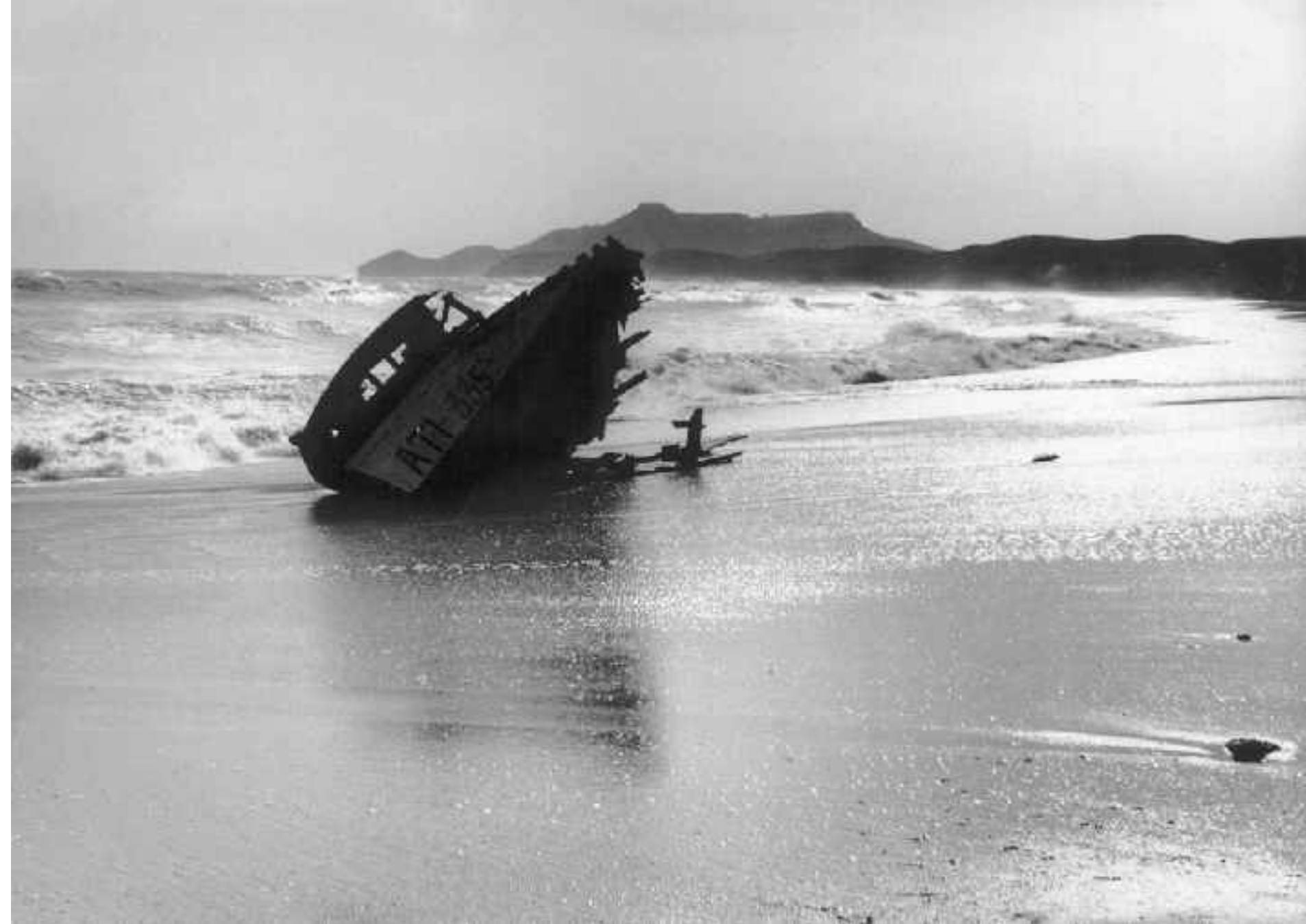
Proa varada del buque "San Francisco" en la playa que popularmente adoptaría su nombre. Carboneras. Hacia 1960-1962