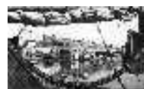
Postal del Puerto de Almería y barrio de Pescadería. Almería. Hacia 1945-1949. Página: 30, 31