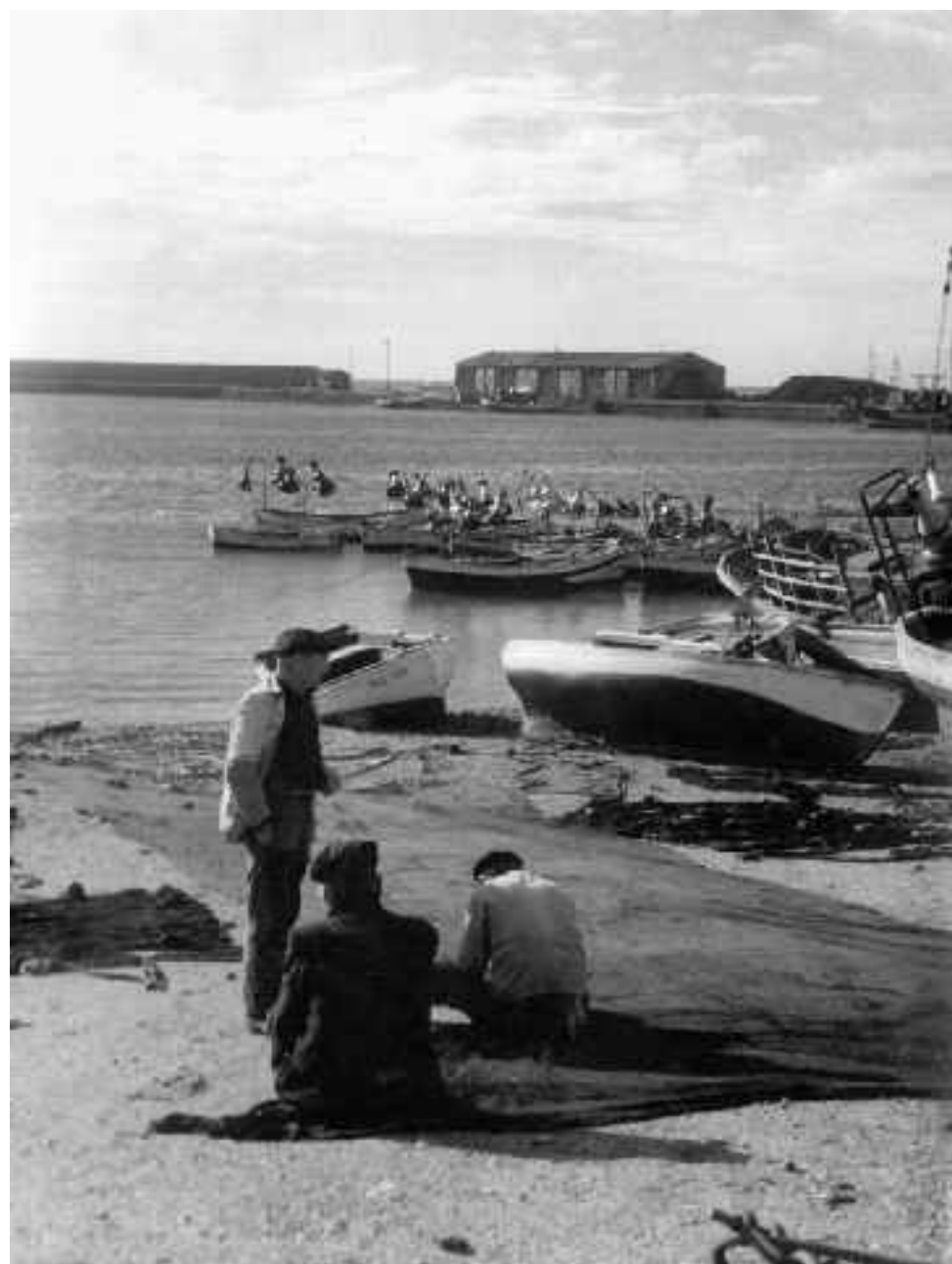
Viejos lobos de mar remendando recuerdos de historias pasadas. Adra. Hacia 1950.