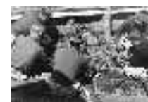
Pescadores seleccionando las primeras gambas rojas de Garrucha. Garrucha. Año 1950. Página: 46