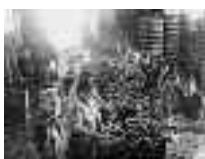
Grupo de mujeres manipulando la sardina para convertirla en arenque. Adra. Hacia 1960 Página: 14