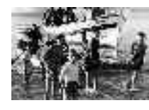
Pescadores desembarcando el pescado. Carboneras. Hacia 1950. Página: 40