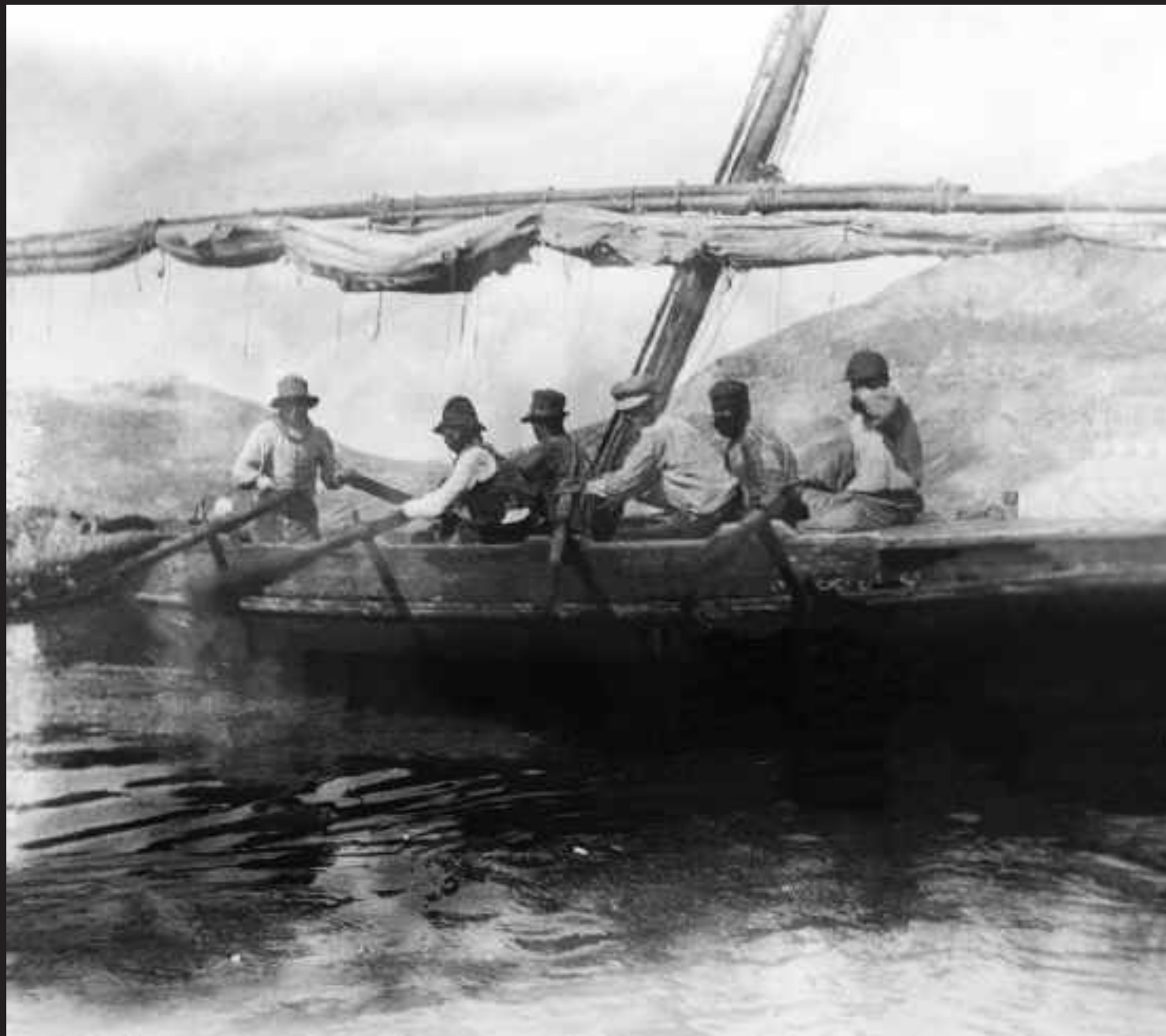
Pescadores sorprendidos bogando en un bote de jábega.