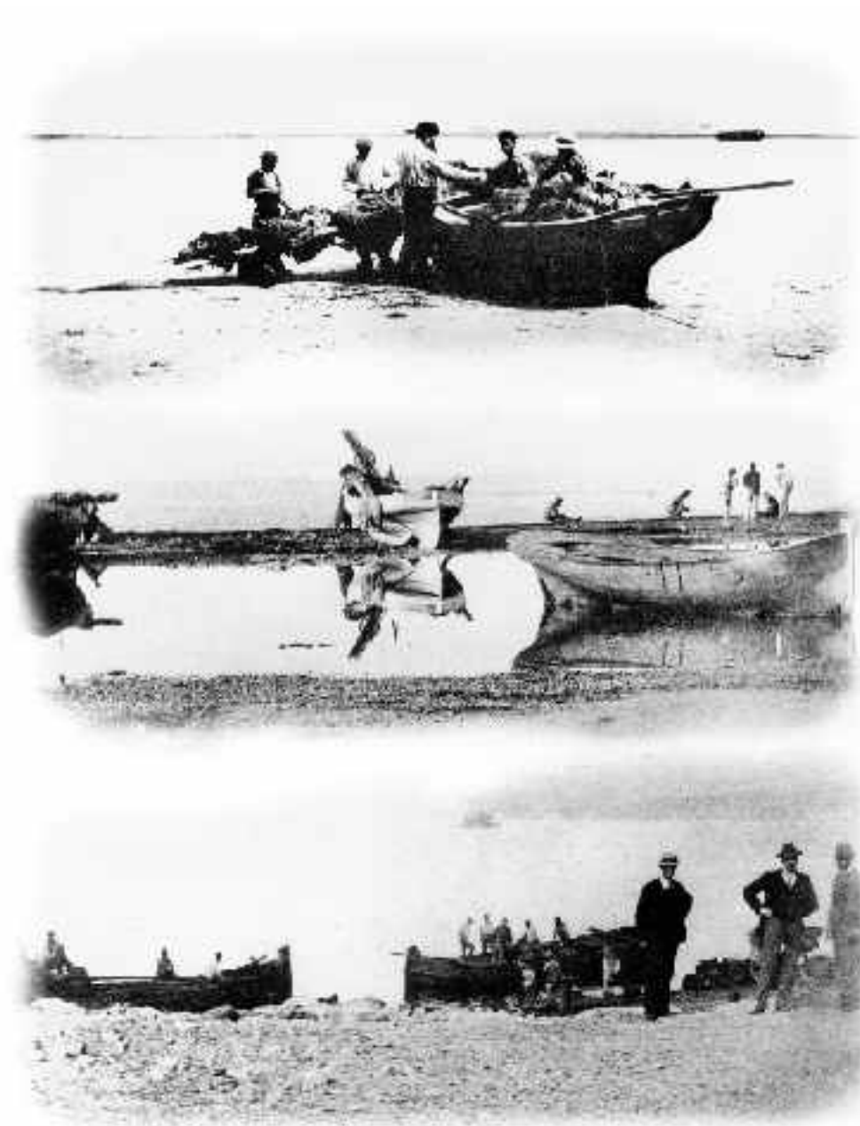
Postales marineras de adra. Adra. Año 1905