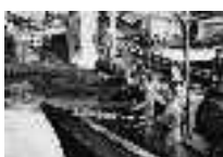
Metiendo el arte por la banda con sonrisas. Adra. Hacia 1950 Página: 20