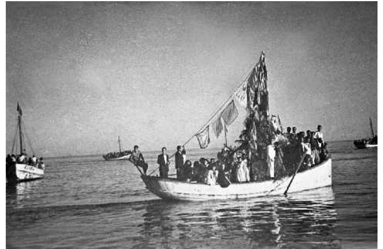
Procesión marítima de la Virgen del Carmen. Carboneras. Año 1951