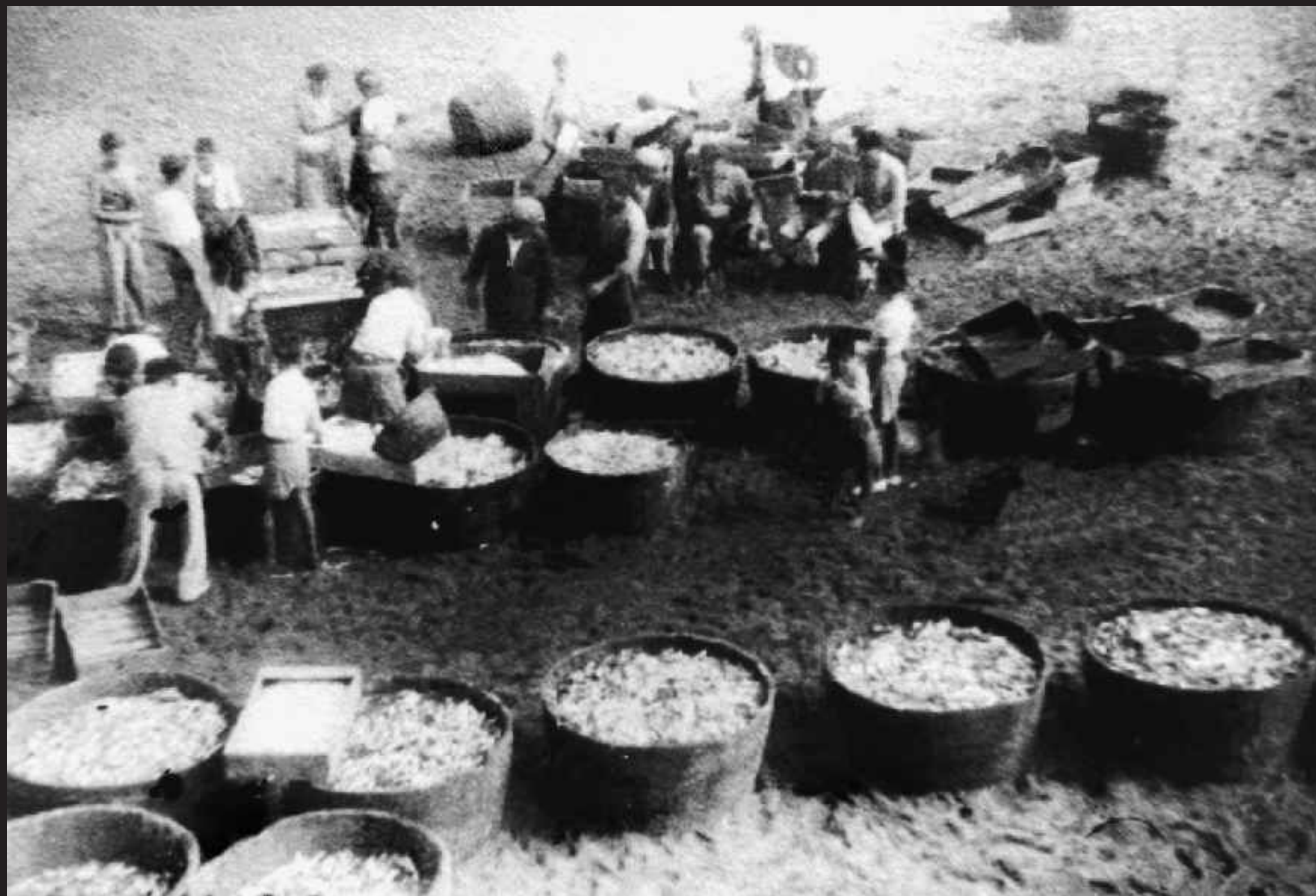
Subasta del pescado en la playa de Garrucha antes de la construcción de la Lonja. Garrucha. Hacia 1920-1930.