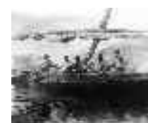
Pescadores sorprendidos bogando en un bote de jábega. Garrucha. Hacia 1880-1890. Página: 52