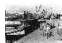
Niños jugando en el puerto de Garrucha, entre barcos y toneles del pescado. Garrucha. Año 1952. Página: 44, 45