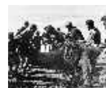
Aunando fuerzas para sacar la red. Carboneras. Hacia 1960 Página: 39