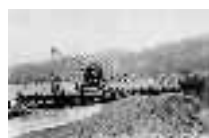
Inicios de la construcción del puerto. Adra. Principios del S.XX Página: 8, 9