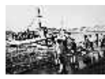
Niños esperando la "garfia". Carboneras. Hacia 1950. Página: 32, 33