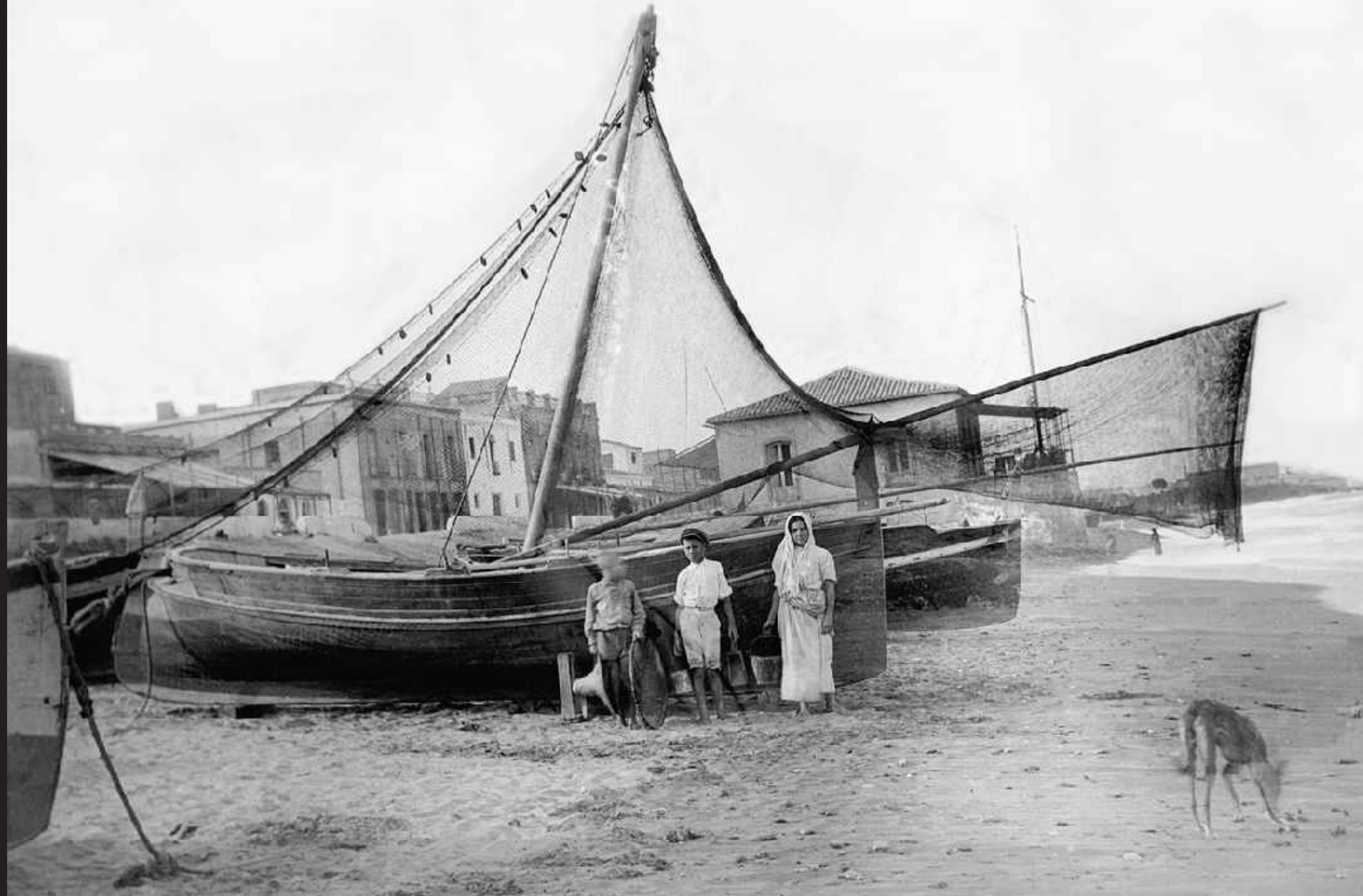
Niños pescadores posando en la playa de Garrucha. Garrucha. Año 1919.