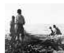
Preparando el arte al principio de la jornada. Carboneras. Hacia 1960 Página: 41