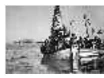
Fiestas de la Virgen del Carmen en las playas de Carboneras. Carboneras. Año 1951 Página: 34