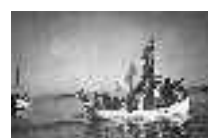
Procesión marítima de la Virgen del Carmen. Carboneras. Año 1951 Página: 35