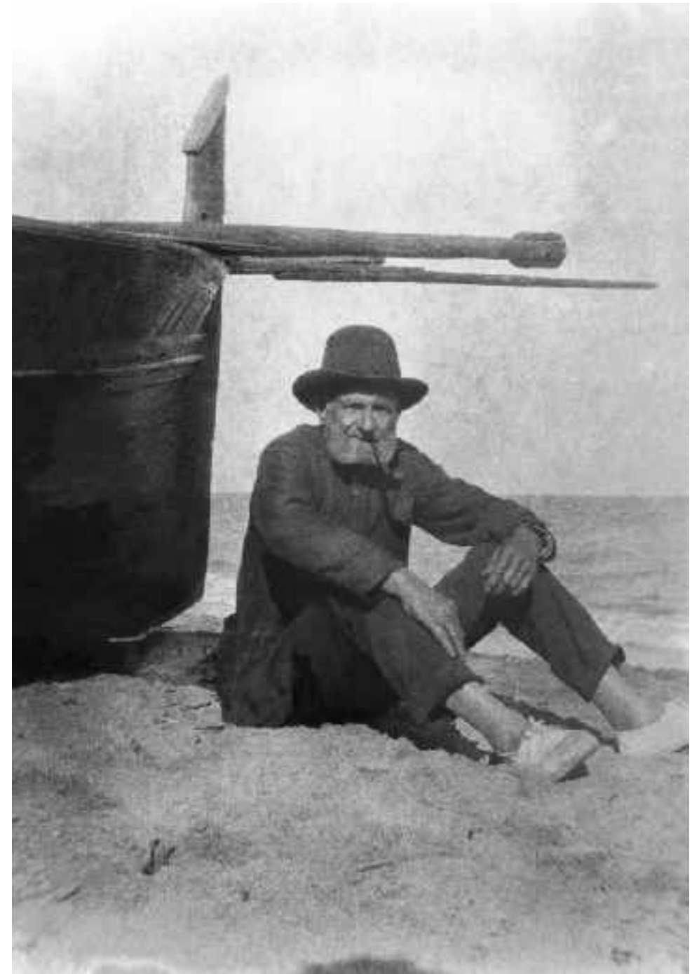
Viejo lobo de mar junto a su bote.