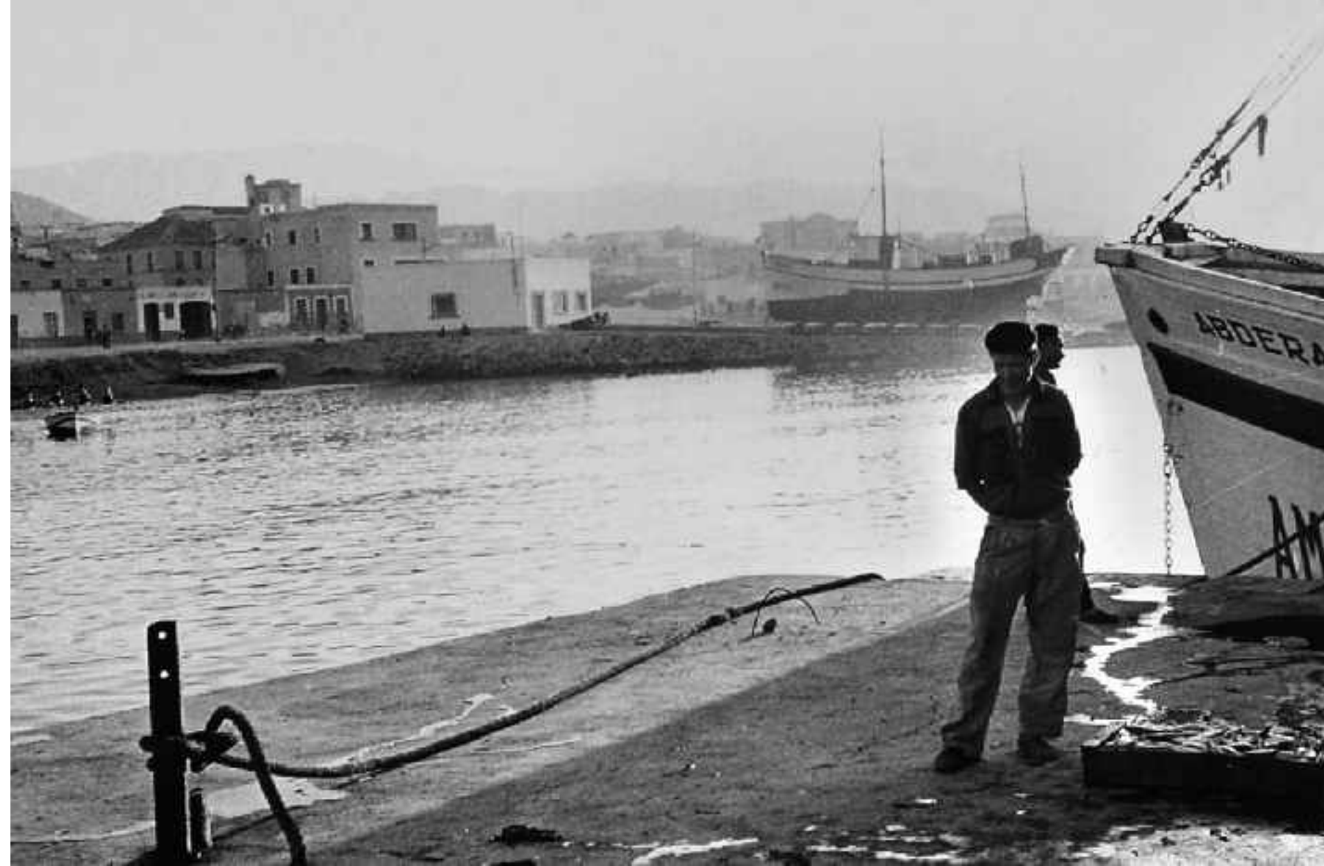
Pensativo en el muelle después de un día de trabajo. Adra. Hacia 1950