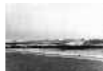
El buque "Perejilo" navegando en la mar embravecida. Carboneras. Hacia 1960-1962 Página: 36