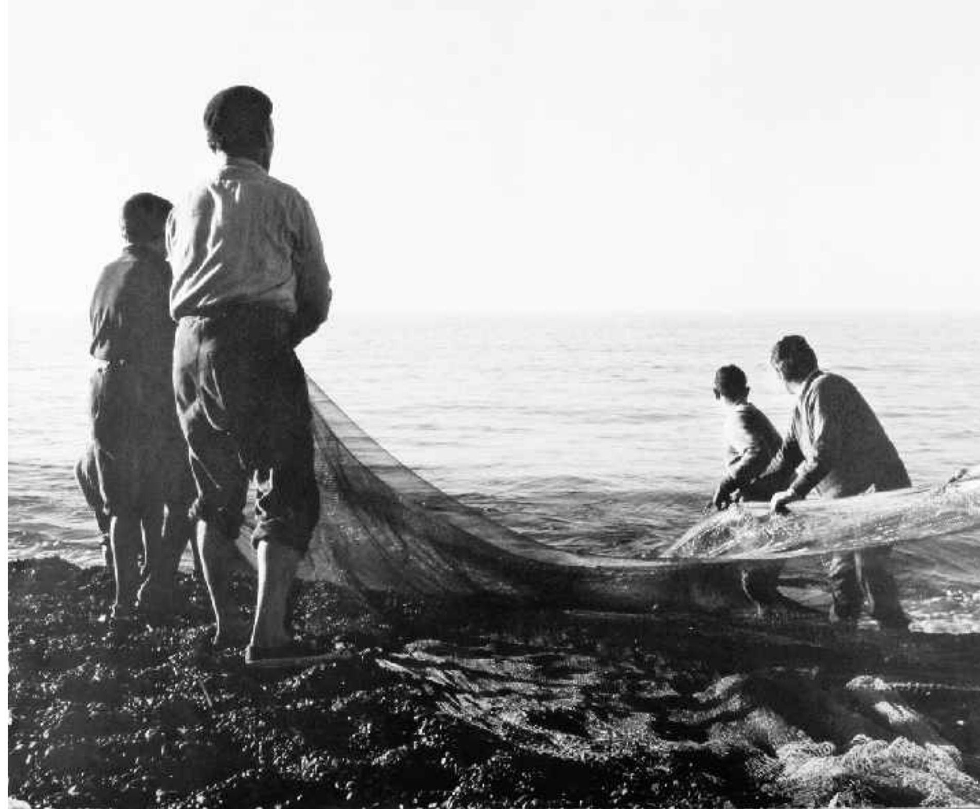
Preparando el arte al principio de la jornada. Carboneras. Hacia 1960