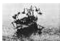
El "chinchorrero" se embarca mientras sus pantalones se secan. Adra. Hacia 1960 Página: 12