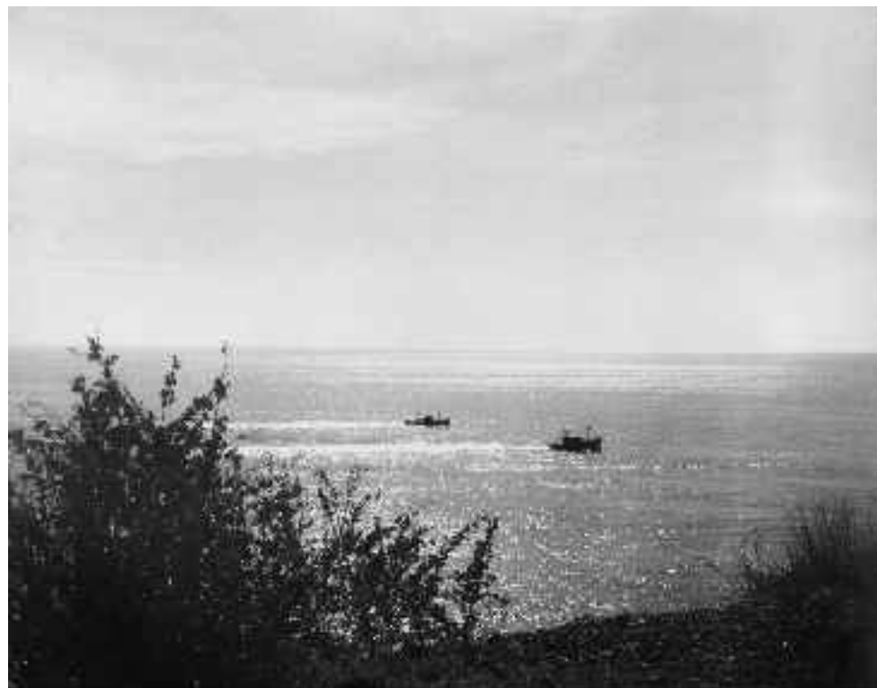
Dos pesqueros surcando la mar en compañía. Carboneras. Hacia 1960