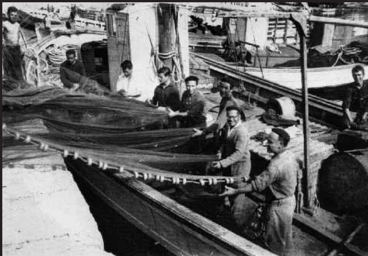
Metiendo el arte por la banda con sonrisas.

Adra. Hacia 1950