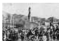
Descarga y venta en el puerto de Adra cuando no existía lonja. Adra. Hacia 1950 Página: 13