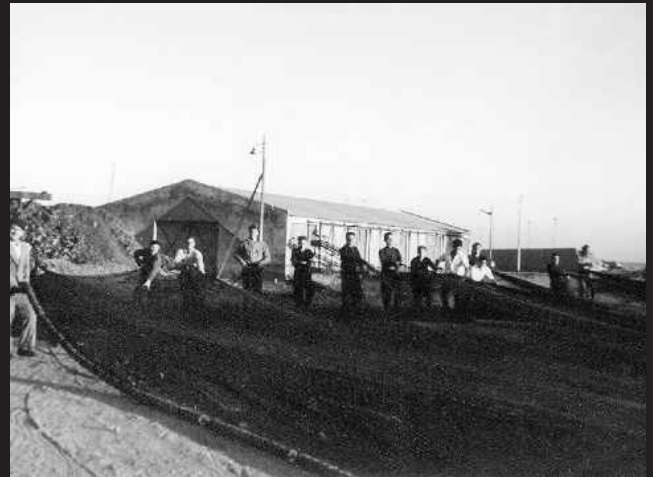
Pescadores extendiendo las redes de algodón para su secado y remienda.

Adra. Hacia 1950.