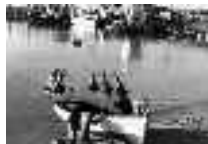
Echando una mano para pintar la patente. Adra. Hacia 1950 Página: 25