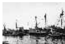
Flota atracada a la espera en el "El Chorrillo" Adra. Hacia 1960 Página: 10, 11