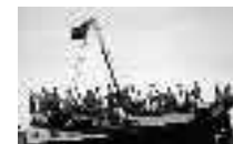
Botadura popular del buque "Los Cinco Hermanos". Carboneras. Año 1952. Página: 42, 43