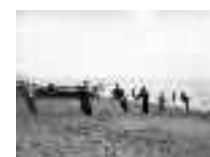
Sacando el arte al final de la jornada. Garrucha. Año 1917. Página: 48, 49