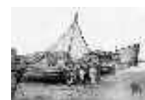
Niños pescadores posando en la playa de Garrucha. Garrucha. Año 1919. Página: 54, 55