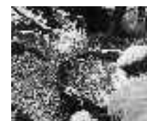
Llenando el cenacho de pescado. Carboneras. Hacia 1960 Col. Cofradía de Pescadores de Carboneras Página: 38