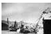
Los artes secándose en el palo, el mercante observa. Adra. Hacia 1950 Página: 24