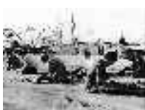
Tripulación haciendo "perjilos" para unir los paños. Adra. Hacia 1960 Página: 16