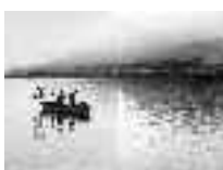
El Chinchorrero leva para salir, su trabajo es duro e imprescindible. Adra. Hacia 1950 Página: 15