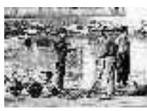
Preparación del trasmallo para salir a calar. Adra. Hacia 1950 Página: 22