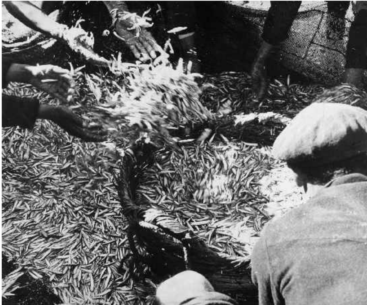
Llenando el cenacho de pescado. Carboneras. Hacia 1960