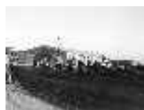
Pescadores extendiendo las redes de algodón para su secado y remienda. Adra. Hacia 1950. Página: 5