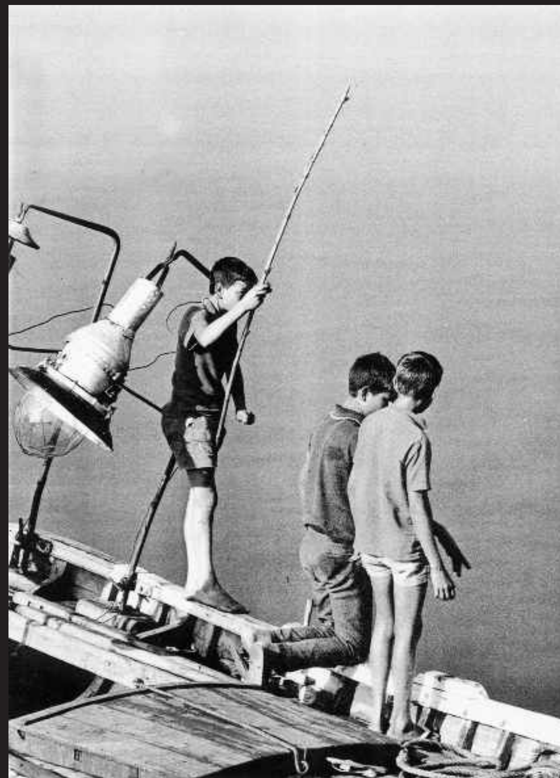
La vocación marinera y su pronto despertar.