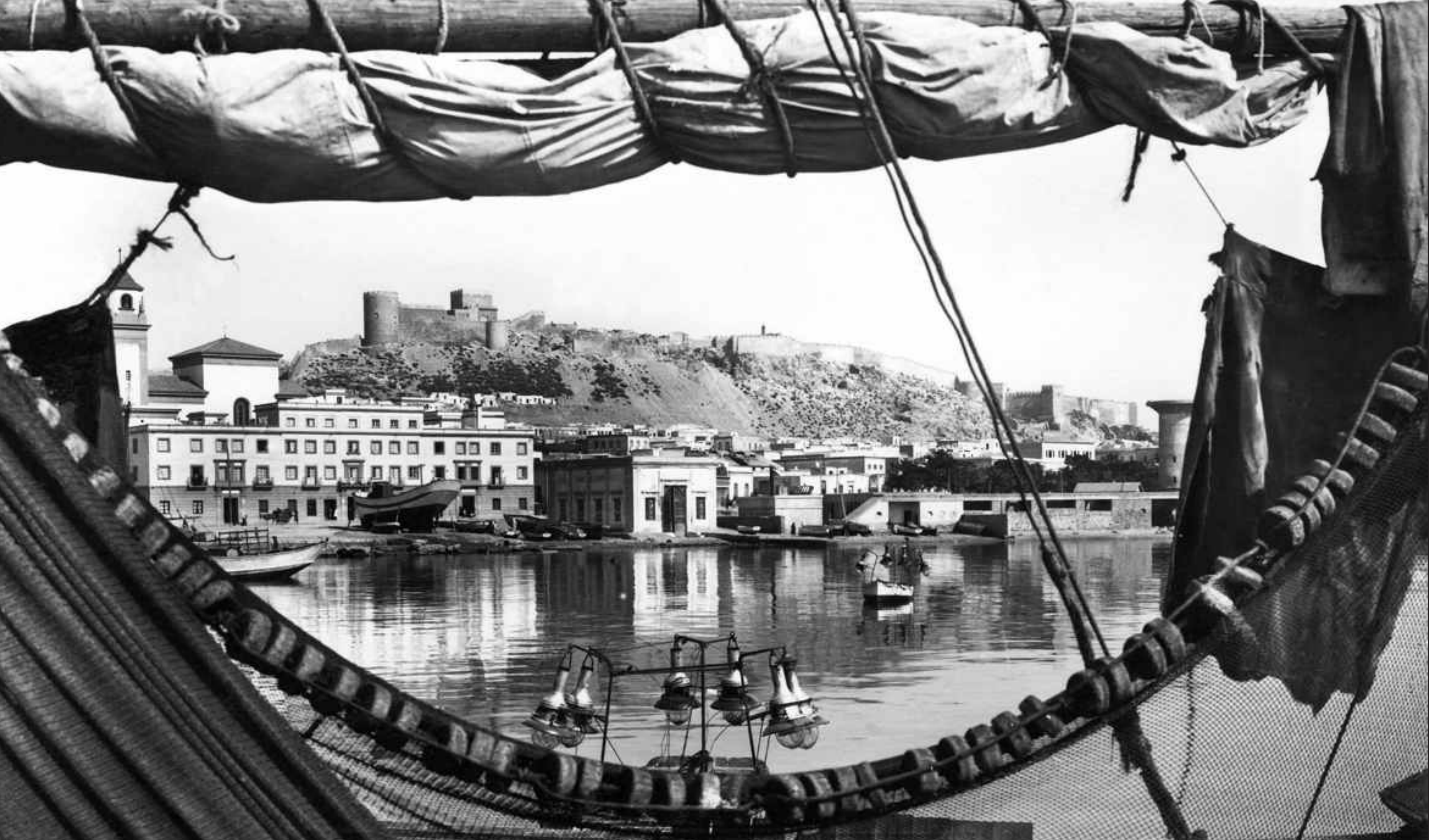
Postal del Puerto de Almería y barrio de Pescadería. Almería. Hacia 1945-1949.