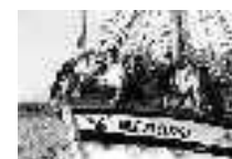
El "Nuevo Clavel" en la procesión de la Virgen del Carmen de Garrucha. Garrucha. Año 1955. Página: 47