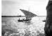
Embarcación de vela latina saliendo del puerto de Almería. Almería. Hacia 1900-1905. Página: 28, 29