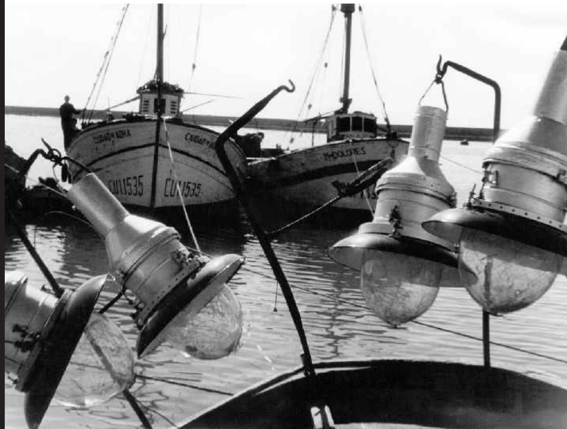
Lámparas de gasolina.

Adra. Hacia 1950 Col. José Antonio Carmona Rodríguez