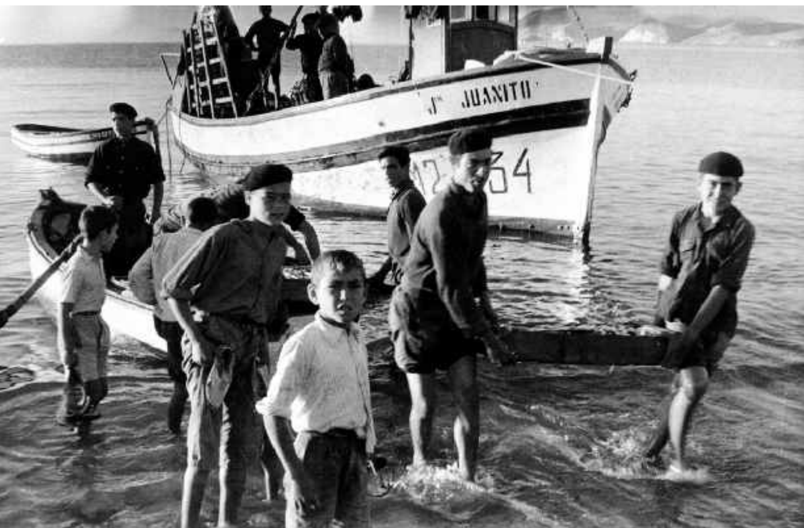
Pescadores desembarcando el pescado. Carboneras. Hacia 1950.