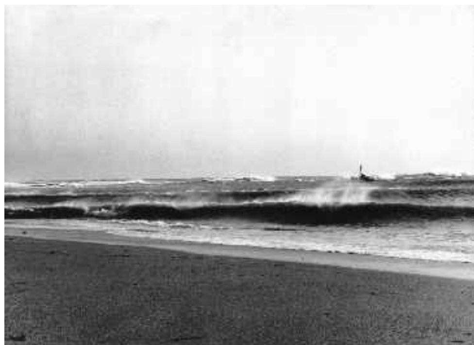
El buque "Perejilo" navegando en la mar embravecida. Carboneras. Hacia 1960-1962