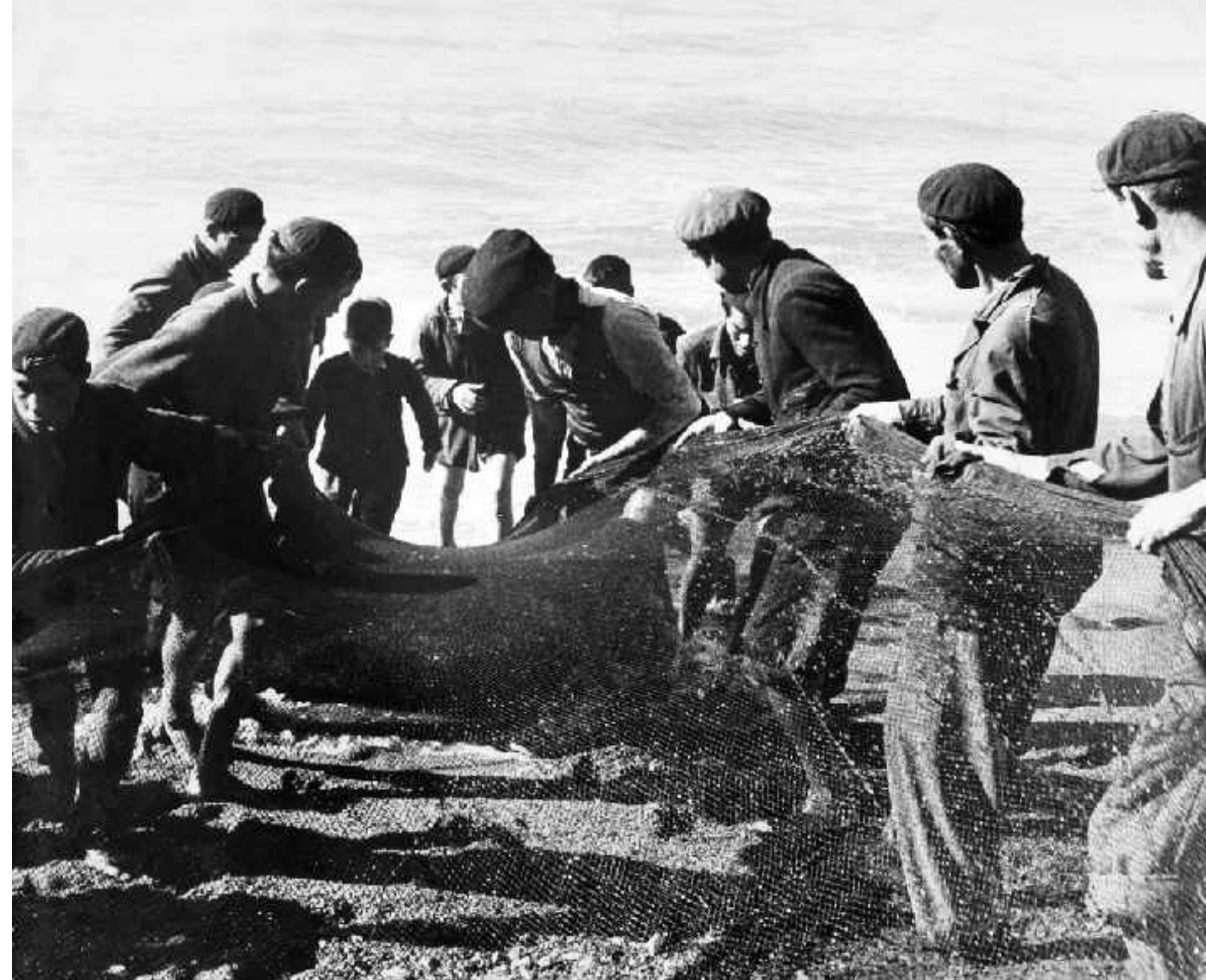
Aunando fuerzas para sacar la red. Carboneras. Hacia 1960