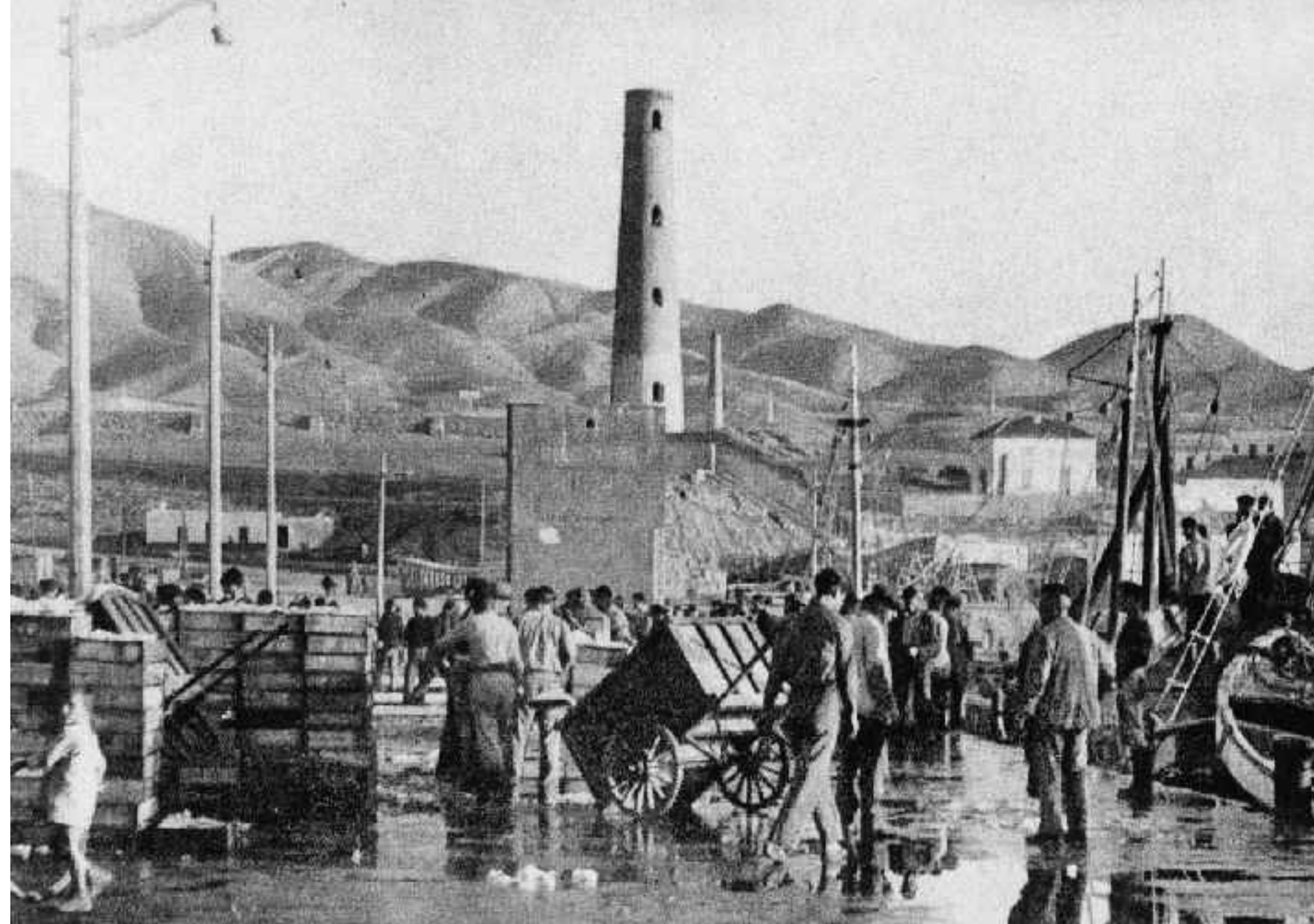
Descarga y venta en el puerto de Adra cuando no existía lonja. Adra. Hacia 1950