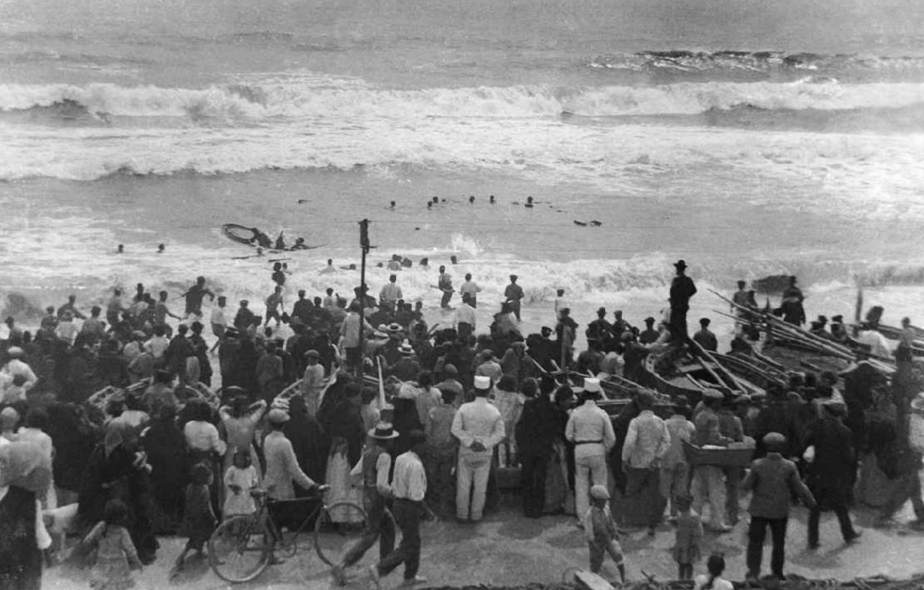
Rescate de naufragos en las playas de Garrucha. Garrucha. Año 1910.