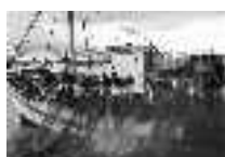
Lavando la red que los une. Adra. Hacia 1950 Página: 26, 27