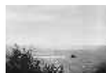
Dos pesqueros surcando la mar en compañía. Carboneras. Hacia 1960 Página: 36