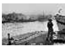
Pensativo en el muelle después de un día de trabajo. Adra. Hacia 1950 Página: 23