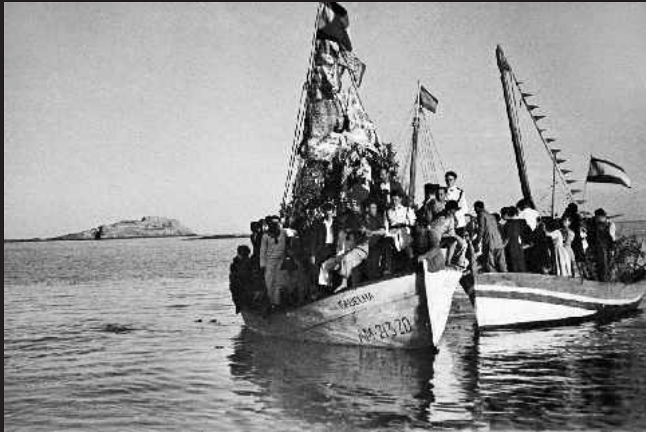
Fiestas de la Virgen del Carmen en las playas de Carboneras. Carboneras. Año 1951 Col. Manuel Rodríguez Fuentes