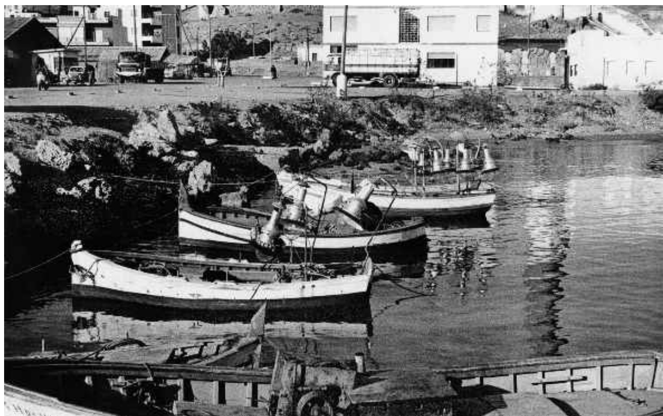
Los botes de luz esperan la noche para iluminar el mar.