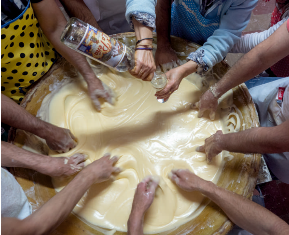
"DULCES PARA LA VIRGEN DE LA PEÑA"