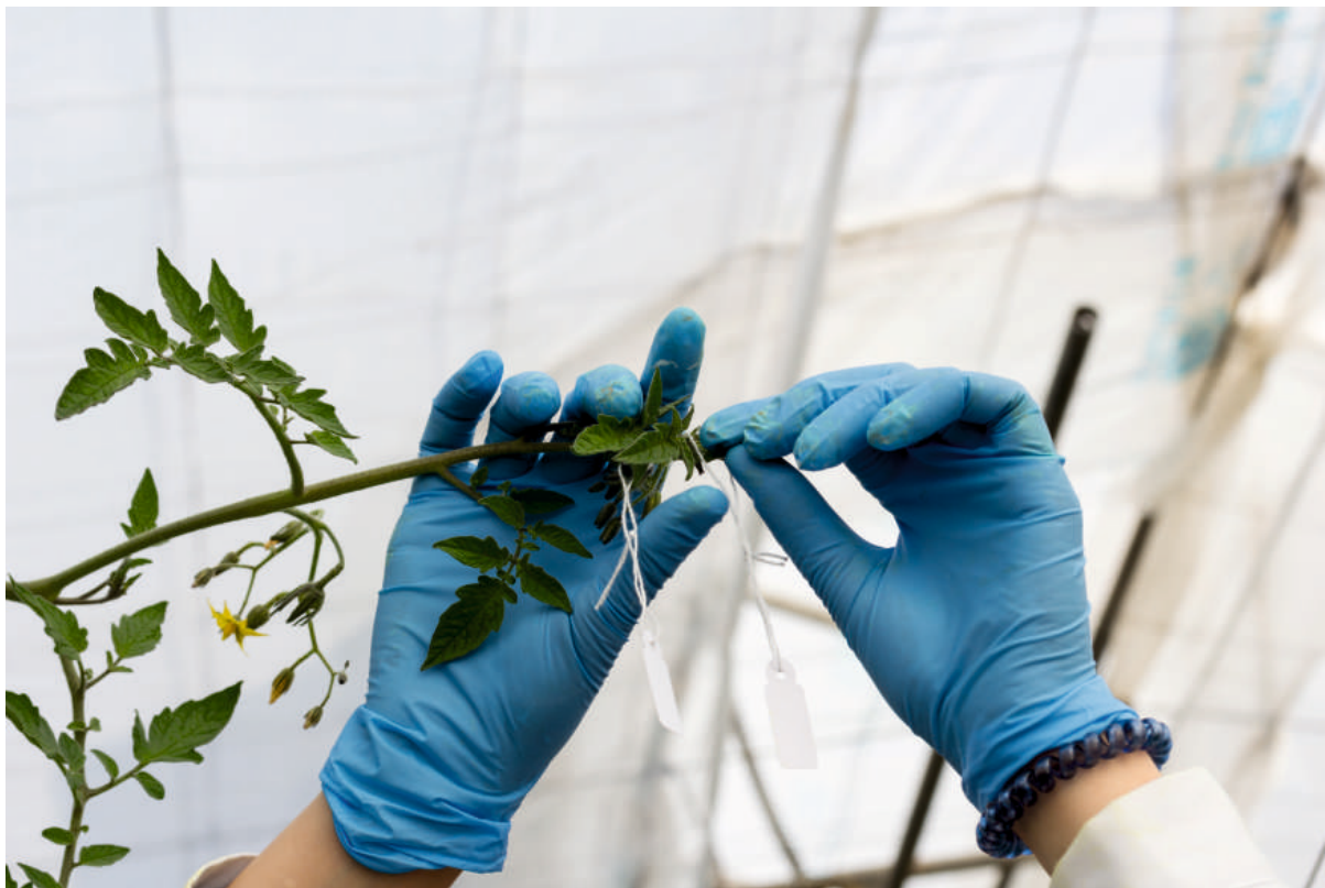
"ETIQUETANDO PLANTAS DE TOMATE"