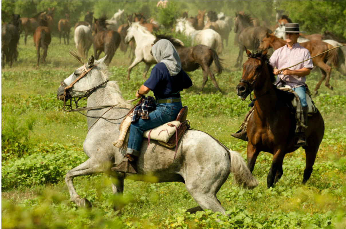
"SACA YEGUAS 2"