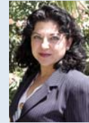
Esperanza Perea Acosta Directora General de Fomento del Empleo

En los últimos años Andalucía ha experimentado profundas transformaciones económicas y sociales. El nivel de renta de la ciudadanía ha aumentado considerablemente y también se ha elevado el nivel educativo. La estructura familiar se ha modificado: el tamaño de los hogares se reduce, a la vez que aumenta el número de familias monoparentales. Las responsabilidades familiares dejan de recaer exclusivamente sobre la mujer, quien trata de compatibilizar su actividad laboral fuera de casa con su vida familiar.