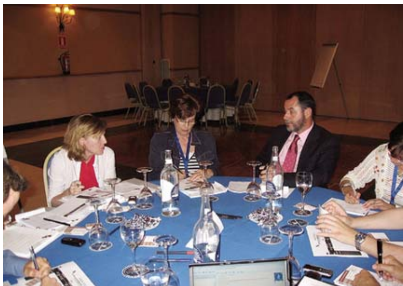
Taller de la Jornada “Las TIC en proyectos de empleo: experiencias de la IC Equal en Andalucía”.

Para más información, puede consultarse la sección de Jornadas y Seminarios del Portal EQUAL ( www.juntadeandalucia.es/empleo/equal ).