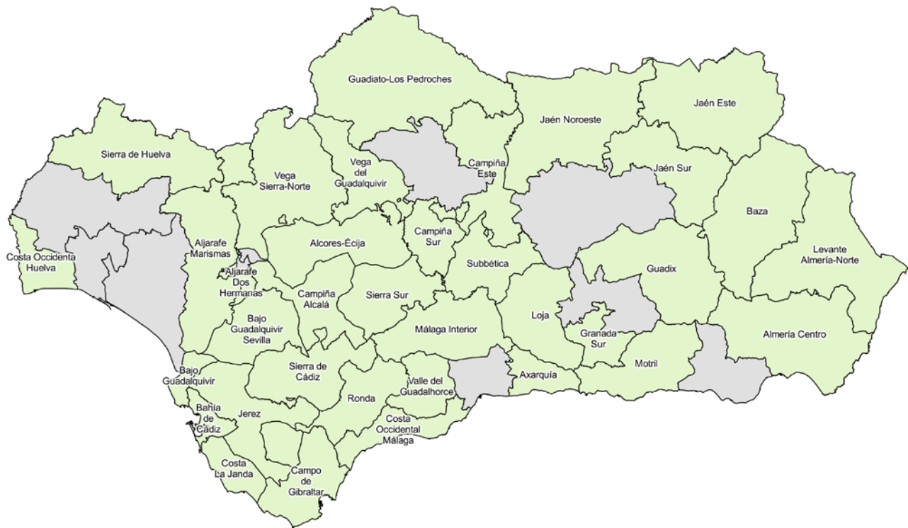
Mapa de Andalucía por ATE para el sector emergente Agricultura Tradicional. Fuente. Elaboración propia. Observatorio Argos.