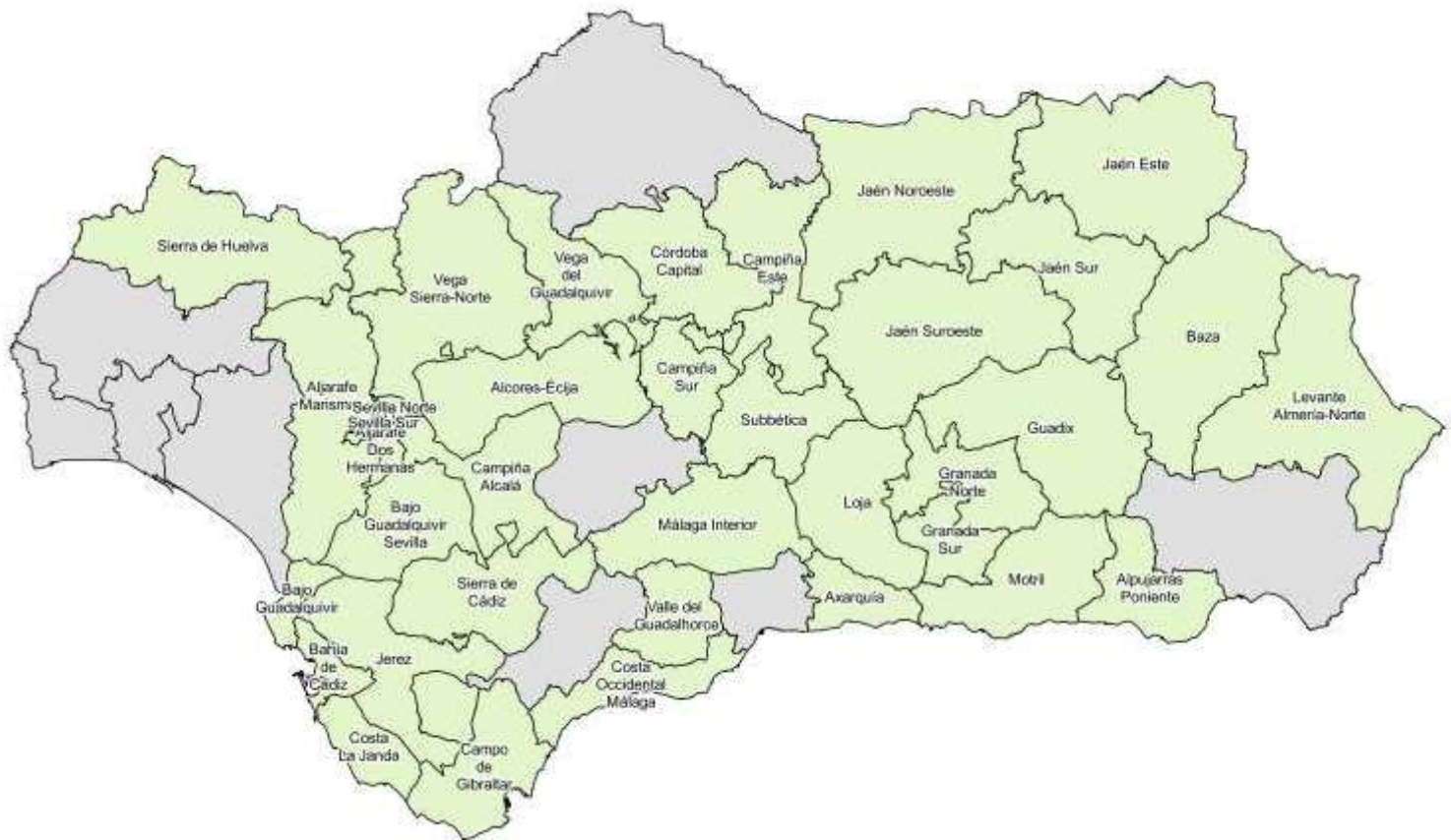
Mapa de Andalucía por ATE para el sector emergente Energías renovables.