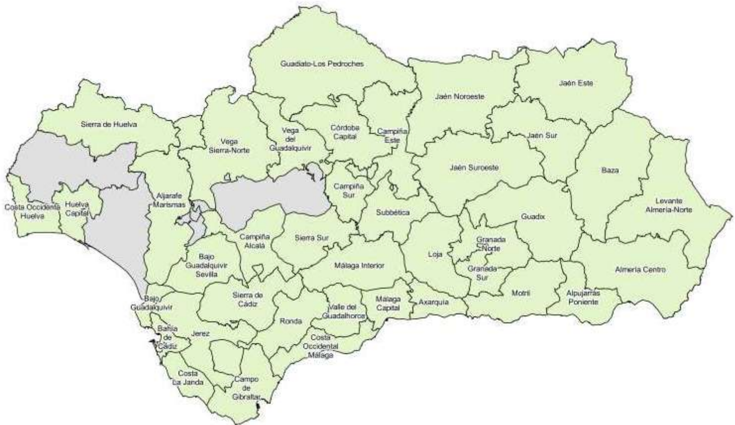
Mapa de Andalucía por ATE para el sector emergente Turismo rural.