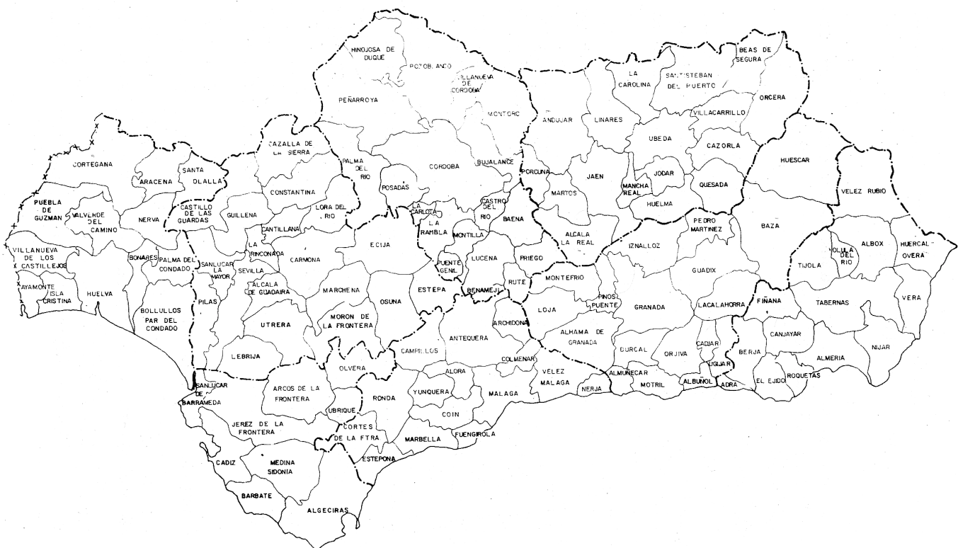
MAPA: DELIMITACION DE LOS AMBITOS FUNCIONALES.

El sistema de ciudades definido, los objetivos territoriales señalados y la red de carreteras definen un modelo basado en un sistema articulado. Los nodos de esta articulación son los 78 municipios seleccionados, como ya se ha señalado por su dinamismo o centralidad, y configuran la red de carreteras que permite la difusión necesaria para vincular las oportunidades territoriales y, por tanto, reducir las diferencias de accesibilidad de las distintas partes del territorio. Este modelo de accesibilidad se realiza bajo el criterio del máximo aprovechamiento de la infraestructura existente, seleccionando los tramos del Plan de carreteras que tienen interés territorial.