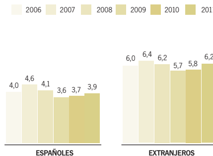
[ GRÁFICO ] Millones de pasajeros españoles y extranjeros en los aeropuertos andaluces. Años 2006 - 2011

Fuente: Aeropuertos Españoles y Navegación Aérea (AENA)