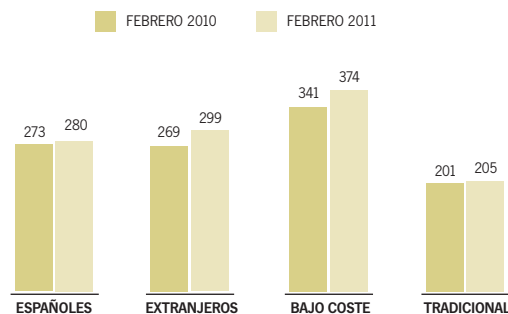
[ GRÁFICO ] Llegadas de pasajeros a los aeropuertos de Andalucía Miles. Febrero 2010 y 2011.