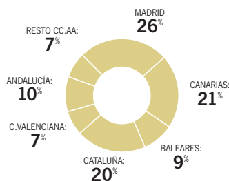
[ GRÁFICO ] Distribución porcentual de la llegada de pasajeros a los aeropuertos españoles. Primer Cuatrimestre 2012

Fuente: Aeropuertos Españoles y Navegación Aérea (AENA)