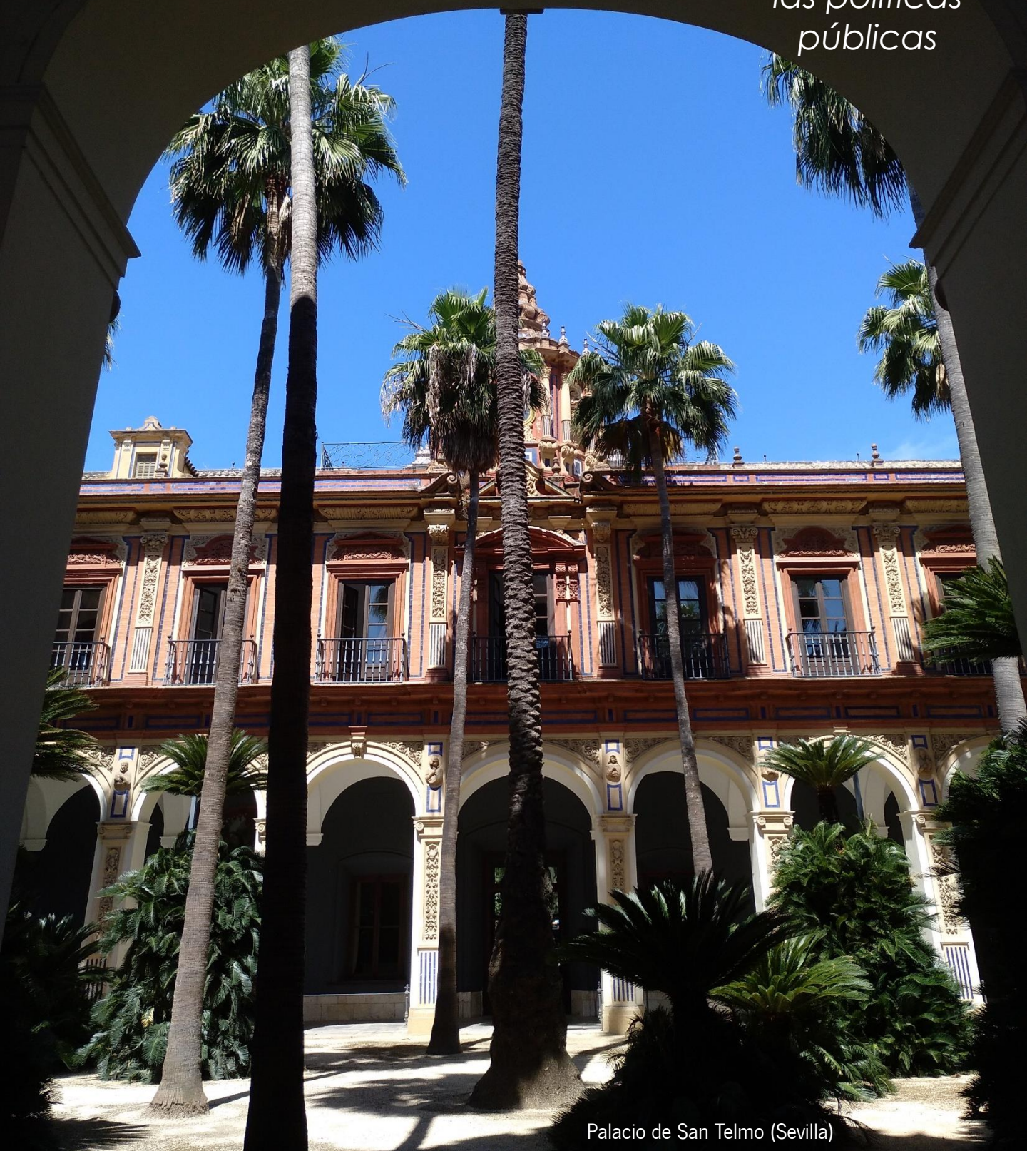
Palacio de San Telmo (Sevilla)

Evaluación para mejorar la planificación de las políticas públicas