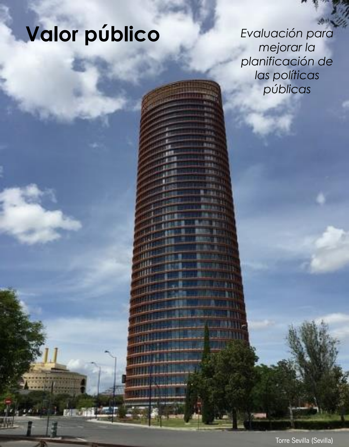
Torre Sevilla (Sevilla)

Evaluación para mejorar la planificación de las políticas públicas