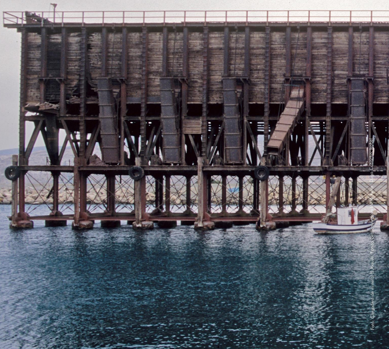
Foto: Cargadero de mineral El Alquíve.

Planificación para conectar las políticas públicas y las personas