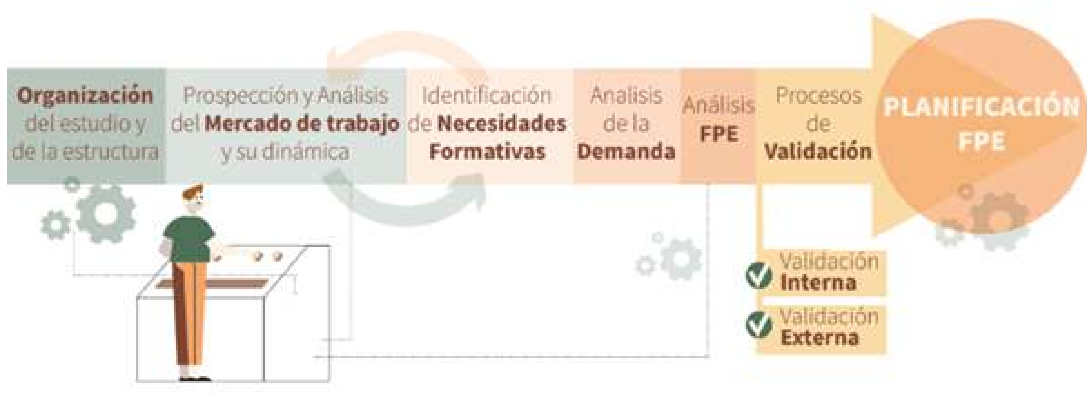
Figura 1: Secuencia Metodológica.

Por último, para la obtención de las especialidades prioritarias del conjunto andaluz, se aplicaron sendos criterios de acumulación y concurrencia de los resultados provinciales.