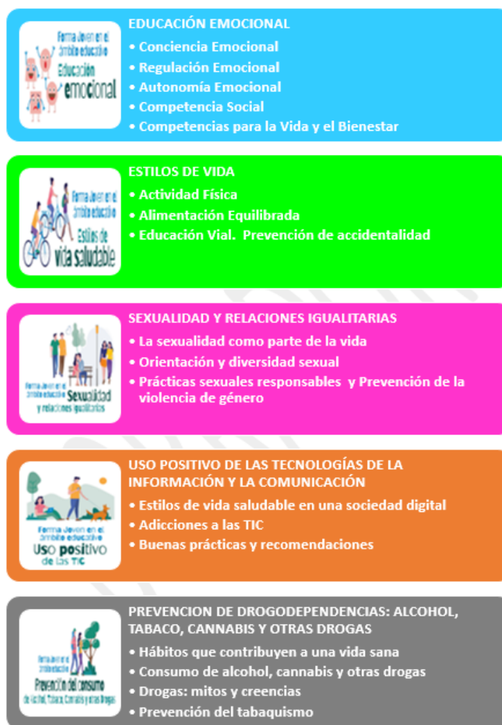
Ilustración 3. Líneas de intervención y bloques temáticos