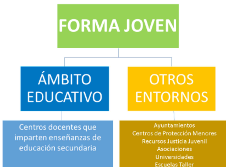
Ilustración 1. Ámbito de actuación de Forma Joven

En definitiva, el programa Forma Joven se desarrolla tanto en el ámbito educativo como en otros entornos, dado que la educación y los estilos de vida son los principales determinantes de salud, donde tiene una importancia central al adquisición de buenos hábitos y activos en salud en edades tempranas de la vida, como forma de mejorar la salud adulta y reducir las desigualdades en salud.