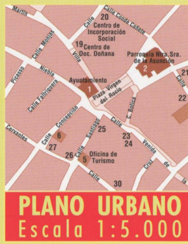
PLANO URBANO Escala 1:5.000