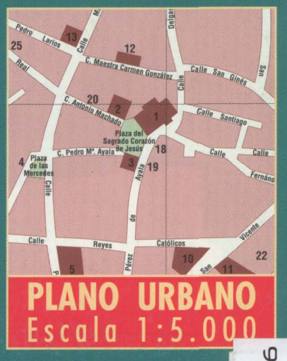
PLANO URBANO Escala 1:5.000