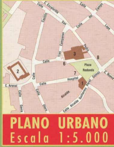
PLANO URBANO Escala 1:5.000