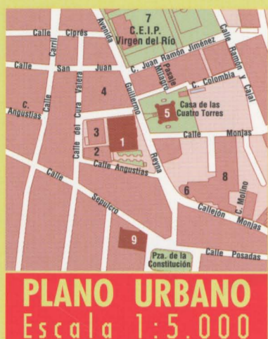
PLANO URBANO Escala 1:5.000