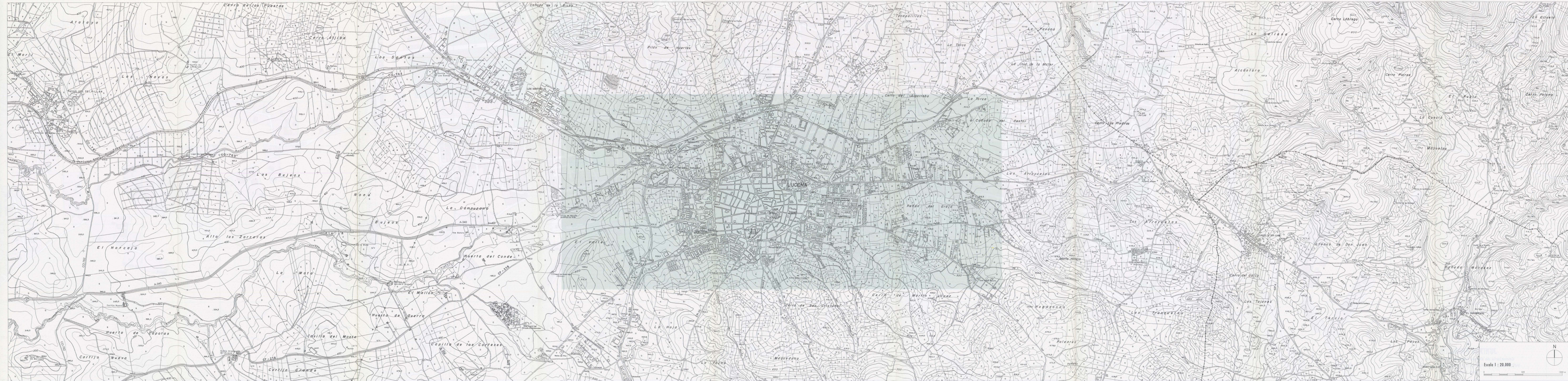
Escala 1 : 20.000