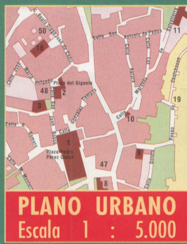
PLANO URBANO Escala 1 : 5.000