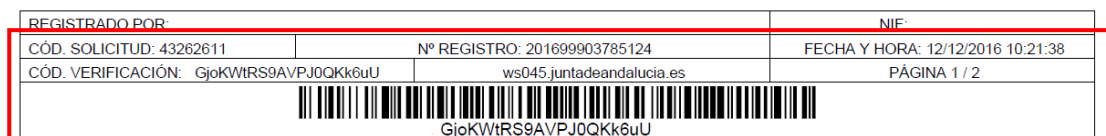
Figura 6.- Datos relativos a la presentación telemática

NOTA IMPORTANTE: Si usted no dispone código de solicitud, nº de registro, la fecha y la hora de la presentación telemática, su solicitud no ha sido presentada ante el Registro Telemático Único de la Junta de Andalucía, encontrándose en estado Borrador.