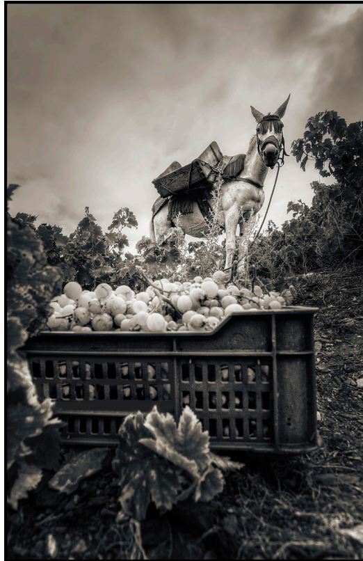
"VENDIMIA EN LA AXARQUÍA". ALMÁCHAR (MÁLAGA)