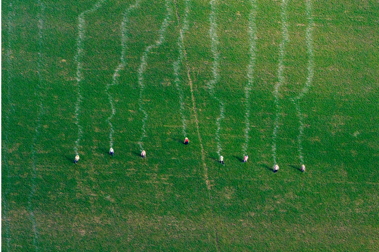
"AGRICULTORES EN ARROZAL". LA PUEBLA DEL RÍO (SEVILLA)