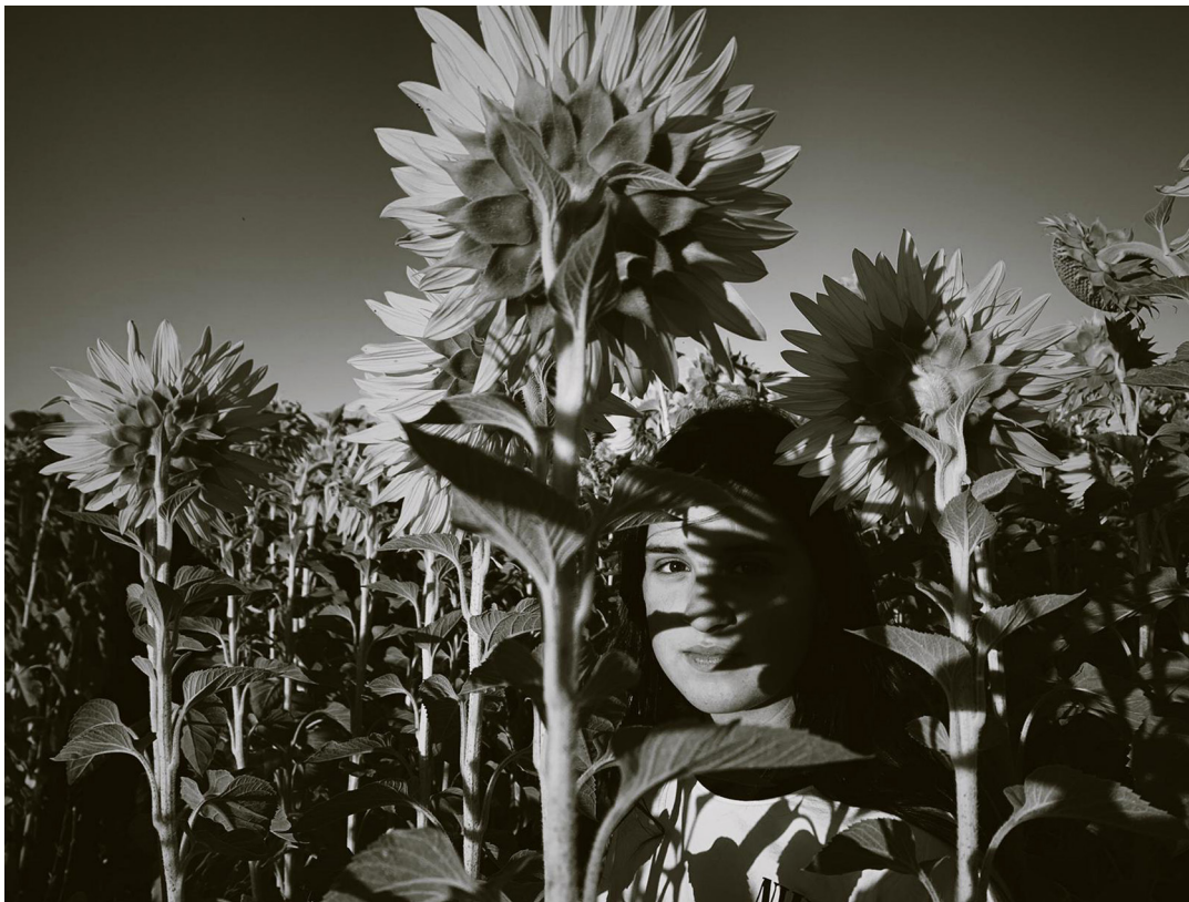
"LA COSECHA". TRIGUEROS (HUELVA)