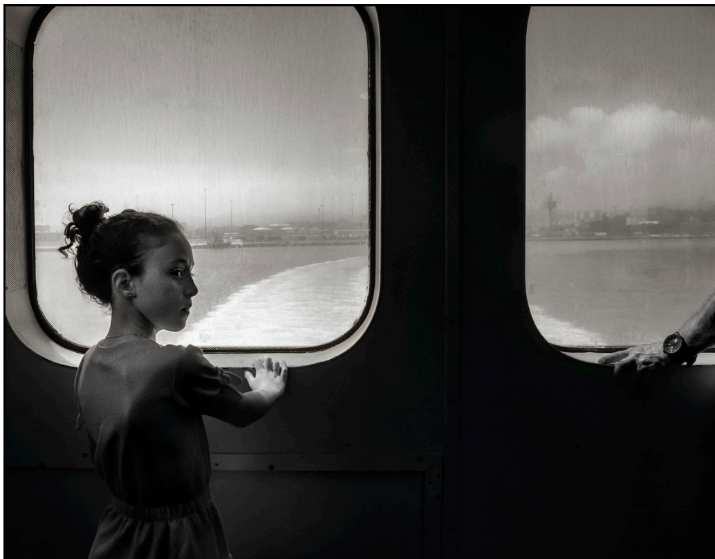
"EN EL PESQUERO". ALGECIRAS (CÁDIZ)