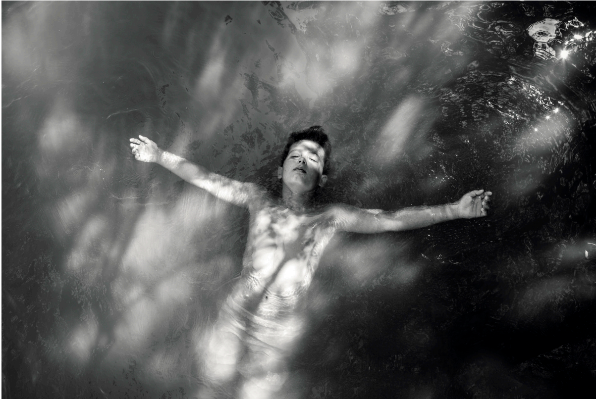
"RÍO HOZGARGANTA" . JIMENA DE LA FRONTERA (CÁDIZ)