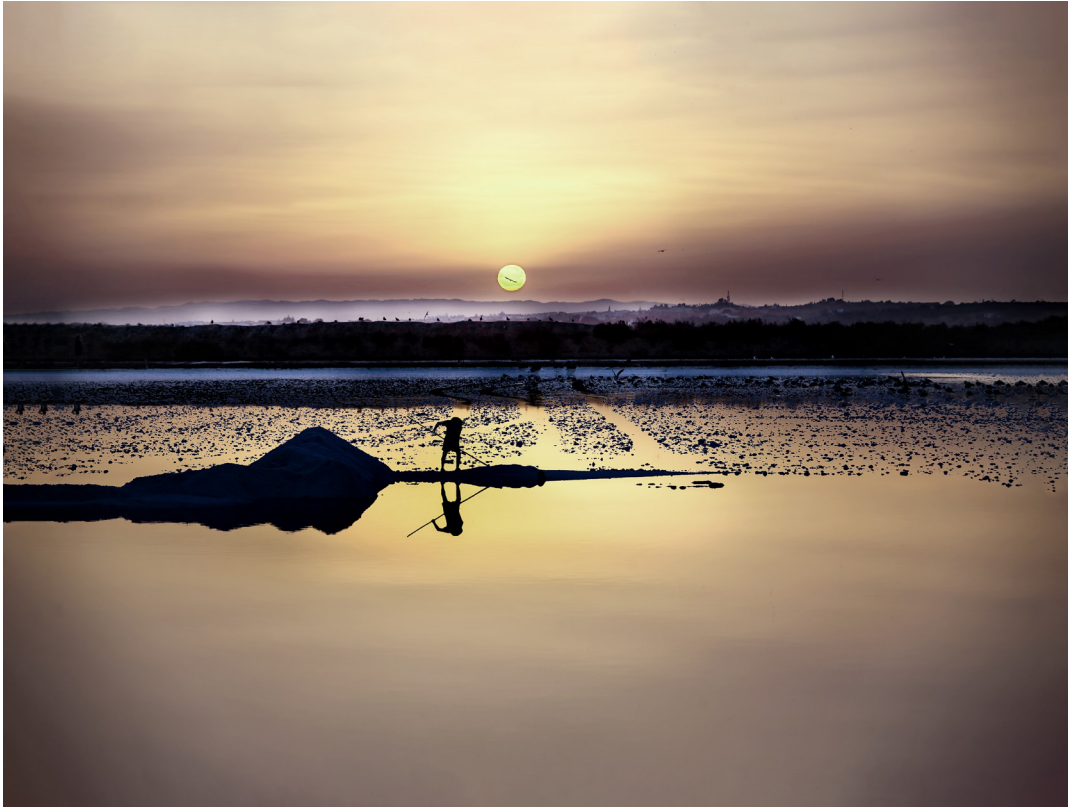
"LA SAL DEL MAR" . ISLA CRISTINA (HUELVA)