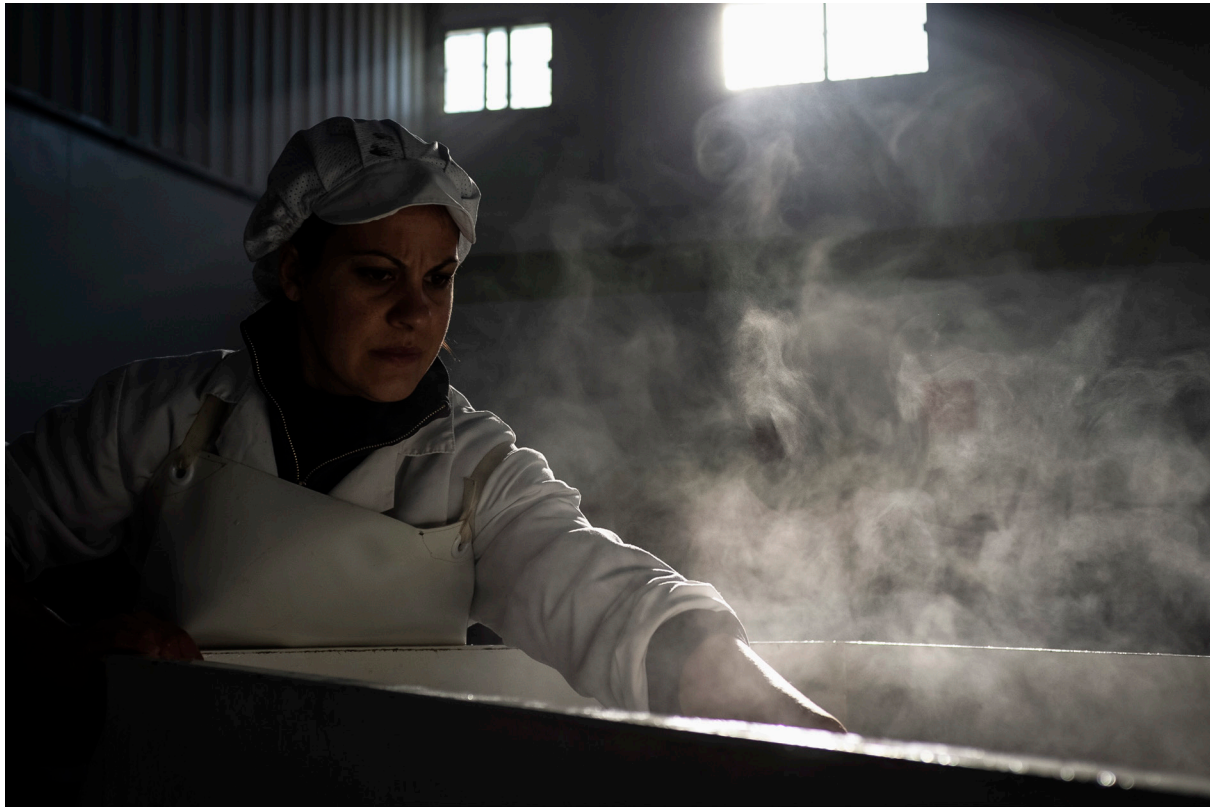
"MAESTRA QUESERA". EL VISO (CÓRDOBA)