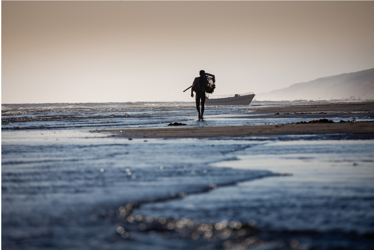
"ENTRE ARENA Y SAL 2". MAZAGÓN (HUELVA)