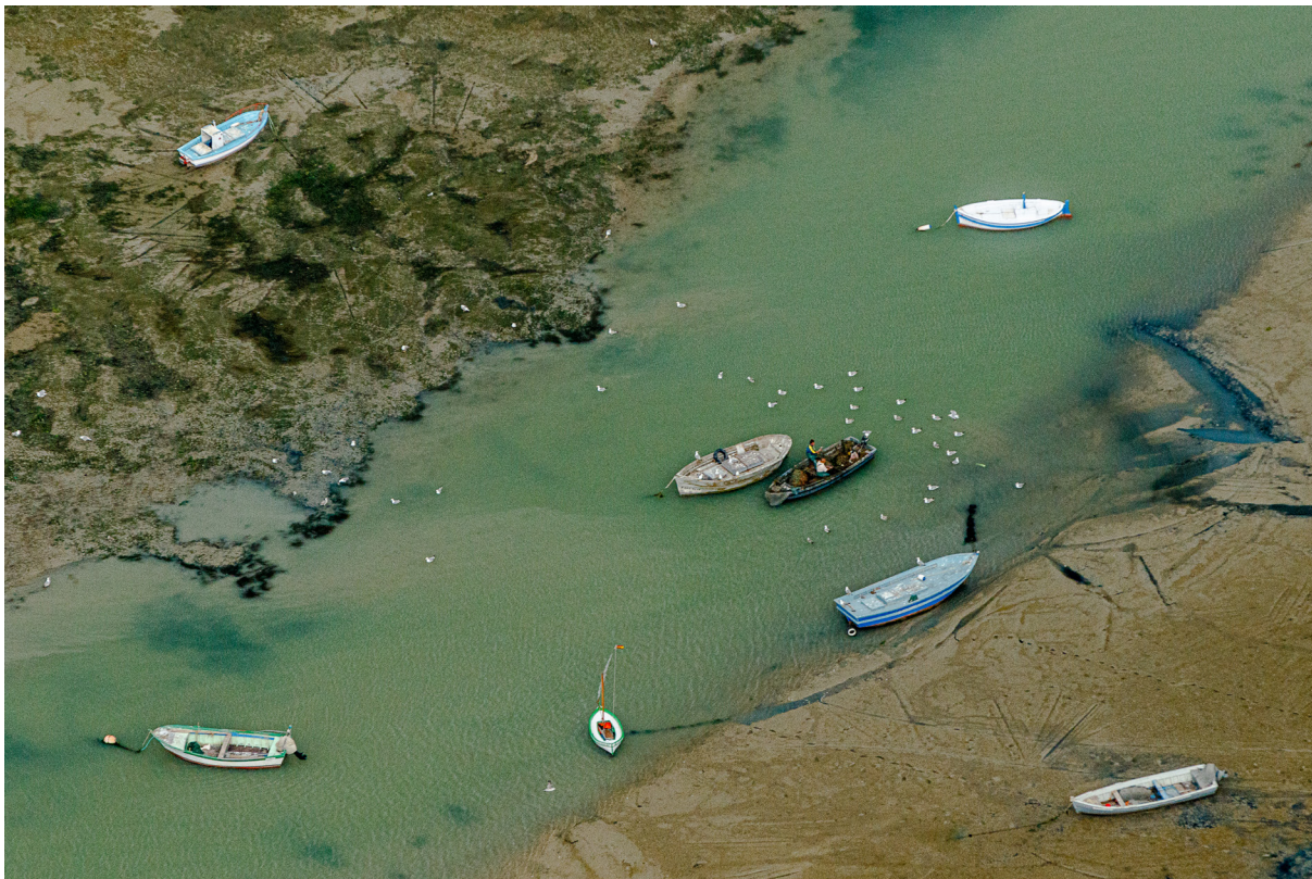
"UN DÍA CUALQUIERA". PUERTO REAL (CÁDIZ)