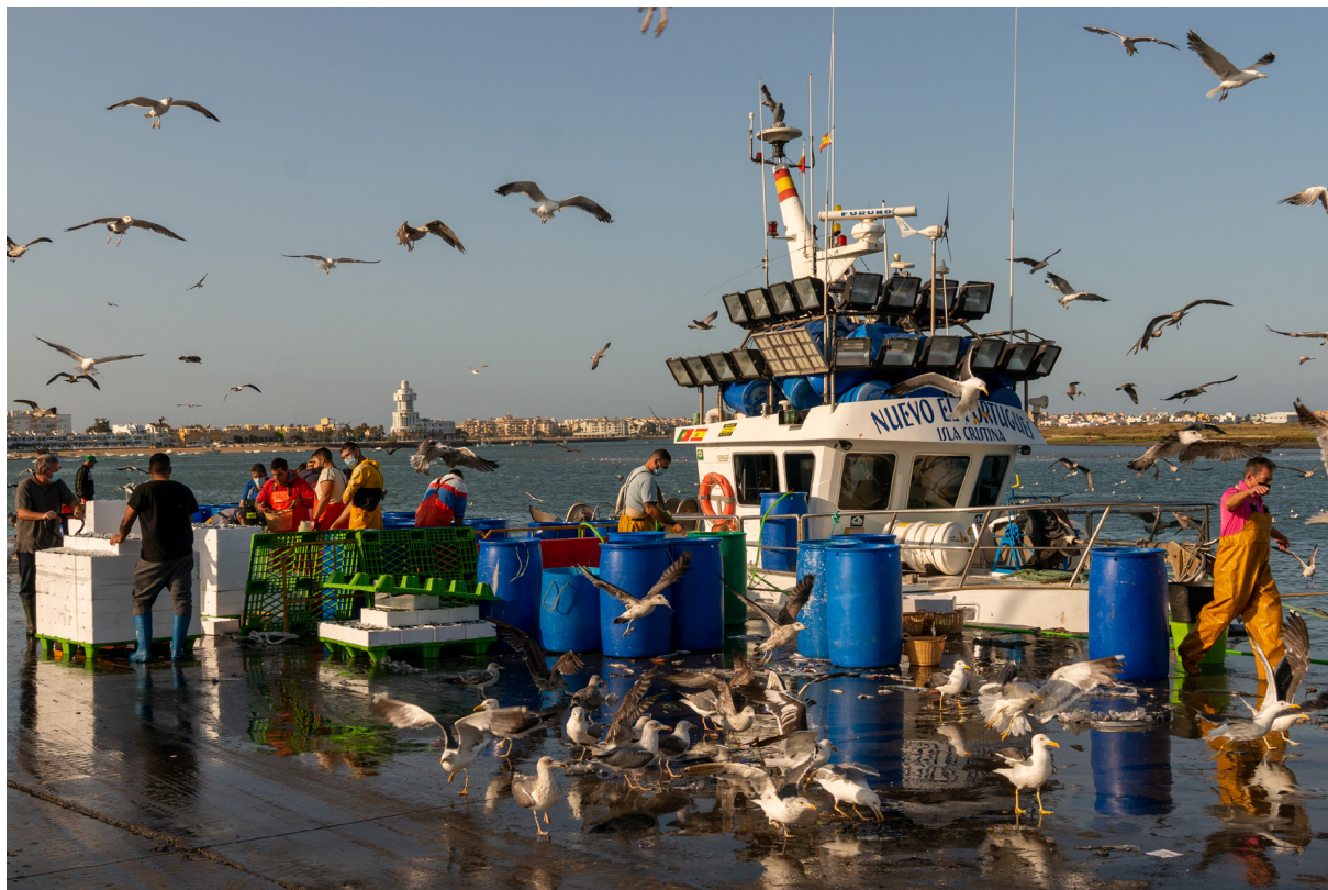
"RECUENTO". ISLA CRISTINA (HUELVA)