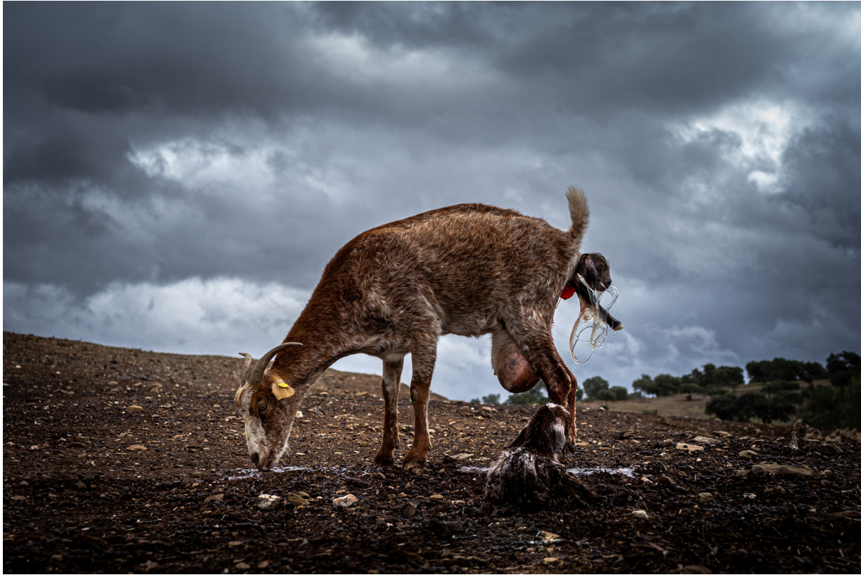
"RETO DEMOGRÁFICO". EL GRANADO (HUELVA)