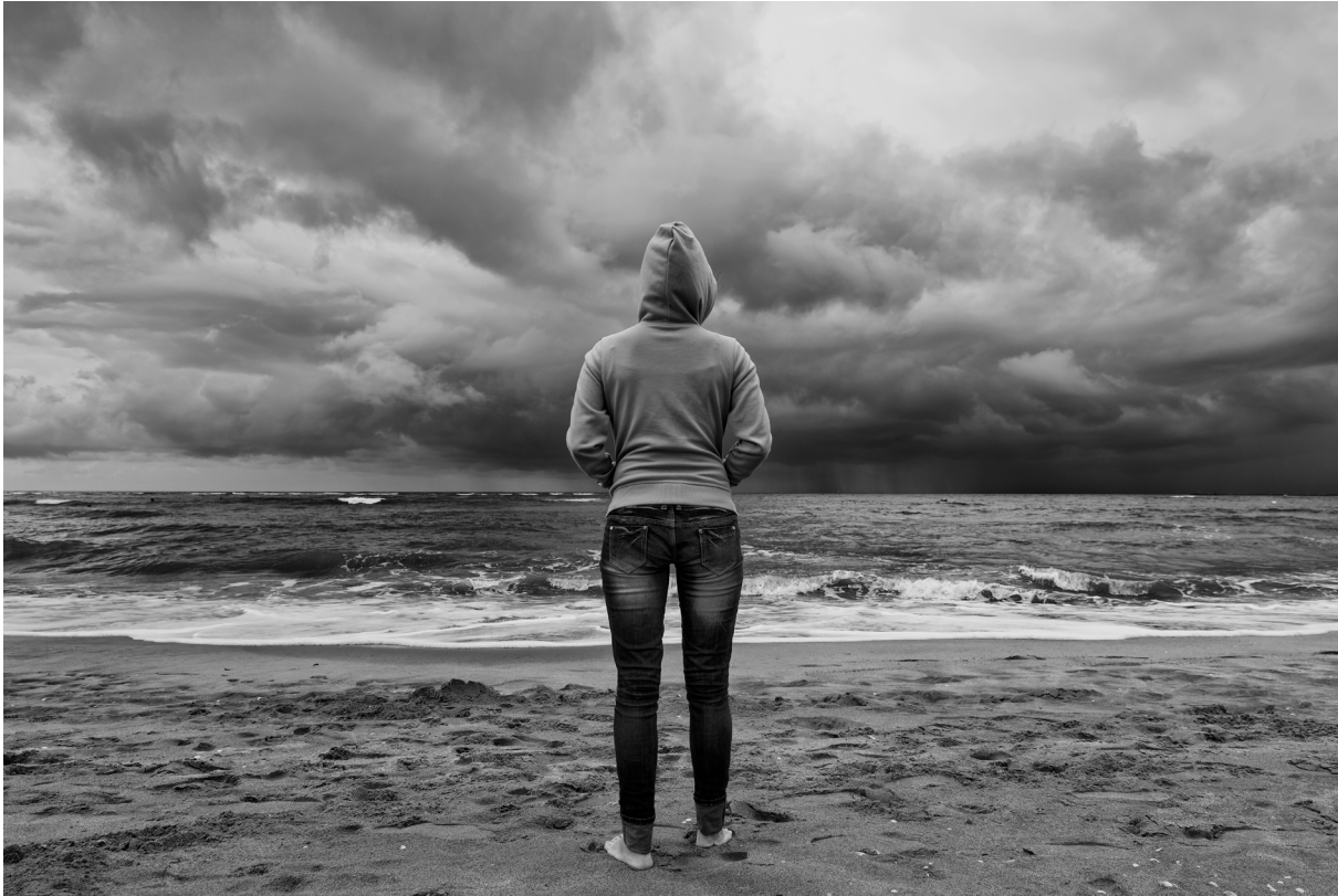
"LA OTRA CARA DE LA PESCA". AYAMONTE (HUELVA)