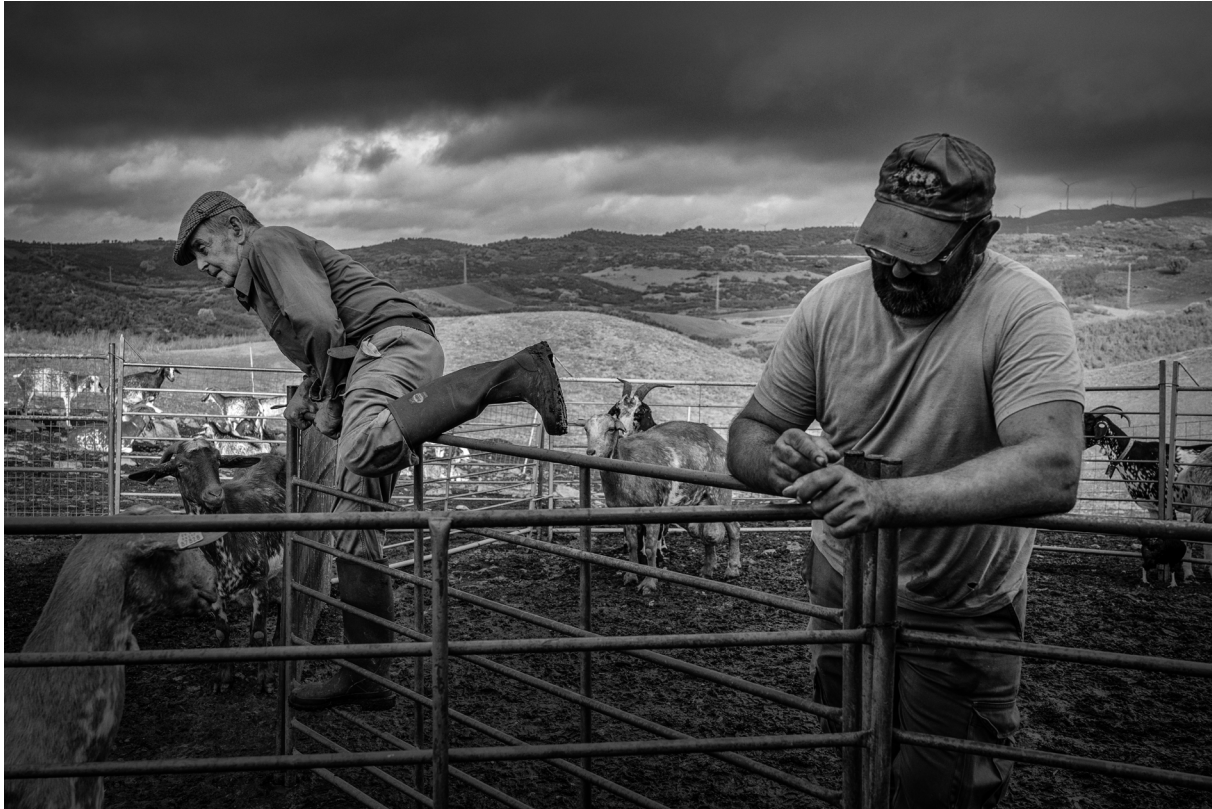
"DOS GENERACIONES". EL GRANADO (HUELVA)