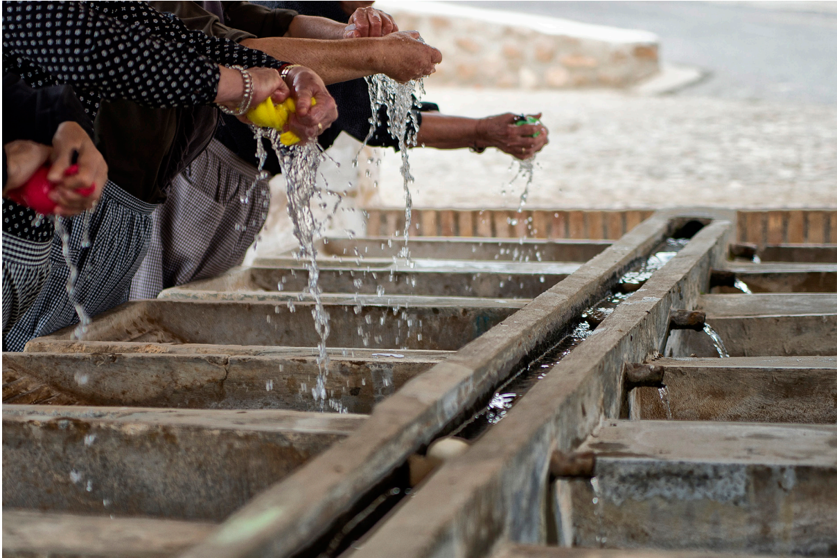
"VESTIGIOS EN EL LAVADERO" . LOPERA (CORTES Y GRAENA) (GRANADA)