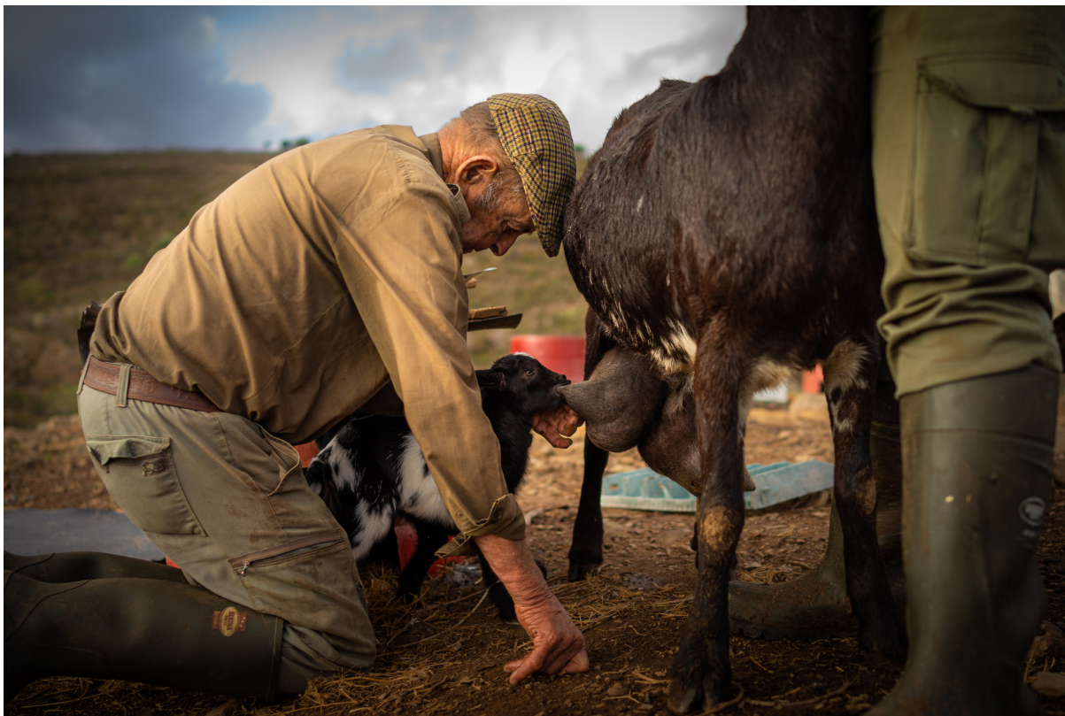
"UNA VIDA DE DEDICACIÓN". EL GRANADO (HUELVA)