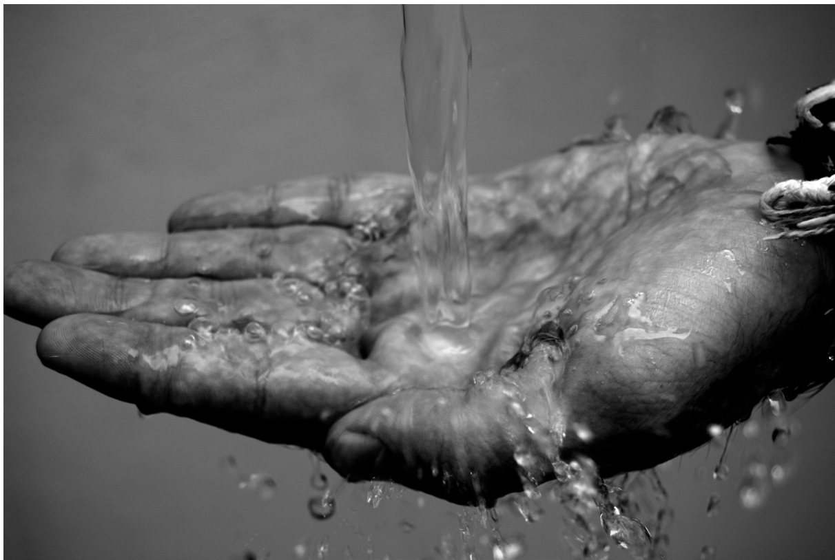
"LA SED" . ROQUETAS DE MAR (ALMERÍA)