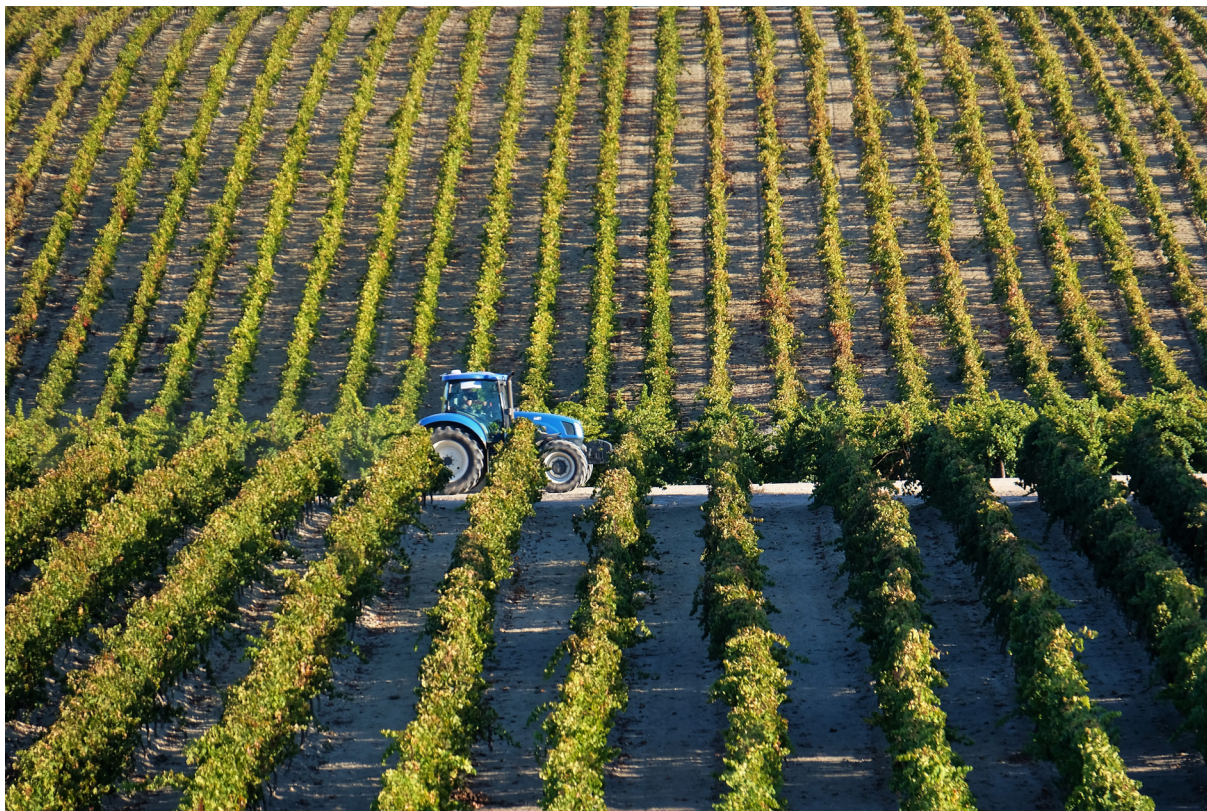
"FIN DE LA JORNADA". JEREZ DE LA FRONTERA (CÁDIZ)