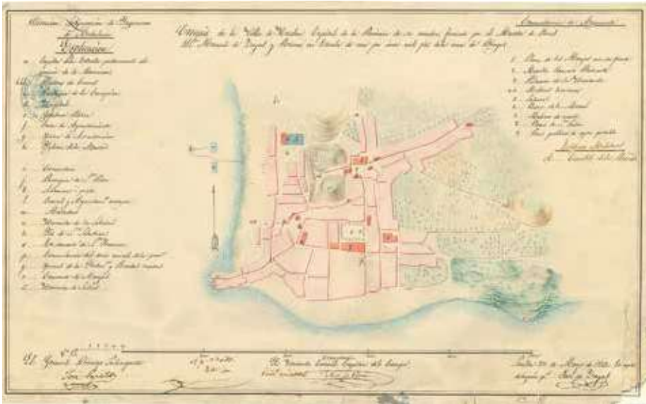
Imagen de cubierta

Croquis de la Villa de Huelva, Capital de la Provincia de su nombre , Manuel de Zayas y Rivero, copia de José de Zayas, manuscrito, Sevilla, 1847. Una imagen pionera en la cartografía de Huelva, por cuanto se trata de su primera planta conocida firmada y fechada. Con un limpio trazado del viario, los principales edificios resaltados en color y una leyenda de identificación con 30 entradas, el croquis muestra la población, de unos 7.000 habitantes por entonces, con una estructura muy similar a la que tuvo durante el Antiguo Régimen, antes de su expansión desde las últimas décadas del siglo XIX.