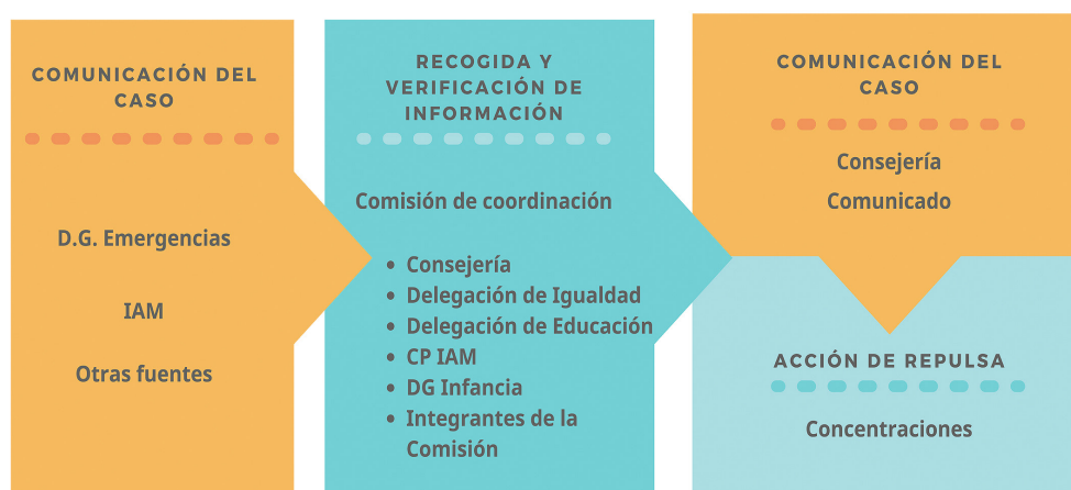
Imagen 1. Diagrama de flujo del protocolo de respuesta institucional.